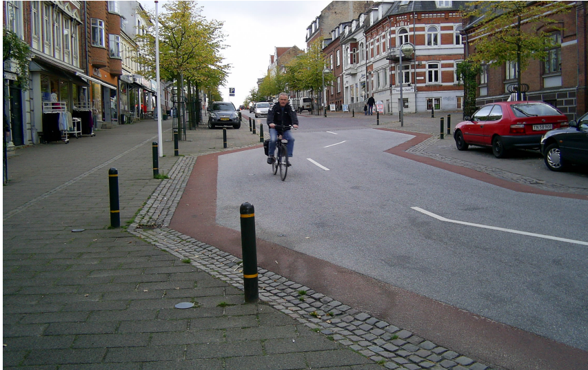
Figur 2. Adelgade i Skanderborg. Et eksempel på en projektlokalitet, hvor asfalkørebane er bevaret.