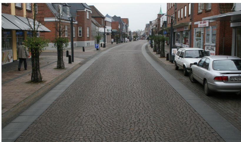
Figur 1. Storegade i Brande. Et eksempel på en af 14 projektlokaliteter, hvor asfaltkørebanen er udskiftet.