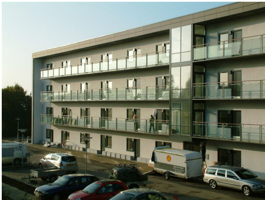
Figur 7. I oktober 2007 stod en række nybyggede ungdomsboliger til studerende klar til indflytning. Alle boliger var fuldt udlejet fra begyndelsen. I Bispehaven forventede de professionelle, at de unge ville blive en del af livet i boligområdet. (Foto: Hedvig Vestergaard).