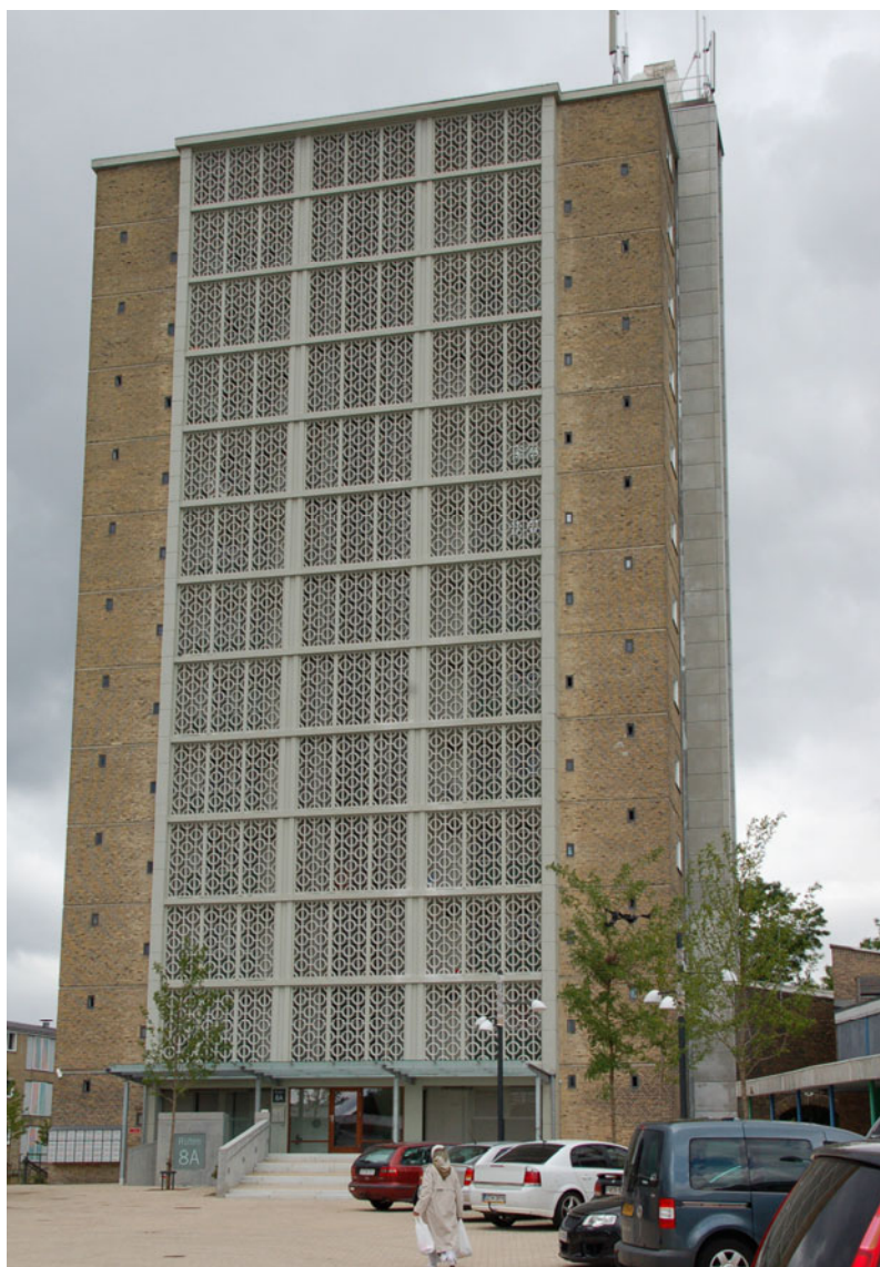
Figur 4. Tårnhuset på 12 etager står ved indkørslen til Tingbjerg som et markant vartegn. Boligforholdene er forbedret med bl.a. et nyt indgangsparti, moderniseret elevator og inddækkede altaner. (Foto: Christian Deichmann Haagerup).