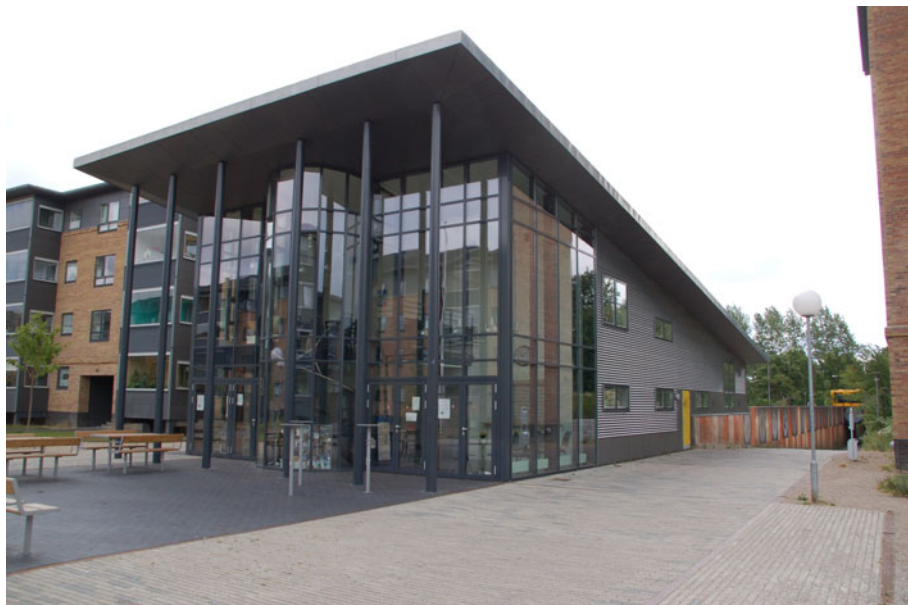
Figur 11. Stenbjerggård Beboer- & Kulturhus i Vejleåparken stod færdig i 2008. Det ligger i forbindelse med Ishøj Boligselskabs afdeling i Østergården. Det er sammen med kvarterhuset i Lokalcenteret i Strandgården ramme om en lang række aktiviteter, som bl.a. Kulturbroen står for. (Foto: Christian Deichmann Haagerup).