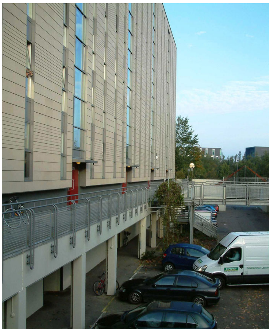
Figur 8. Bispehaven. Adgangsforholde i Bispehaven har fået et løft. Nye glaspartier bidrager med mere lys i opgange og på reposer. Dørtelefoner giver mere tryghed og der er et godt overblik over parkeringsarealer. Her ses en nordvendt facade på en af de høje syvetagers boligblokke.