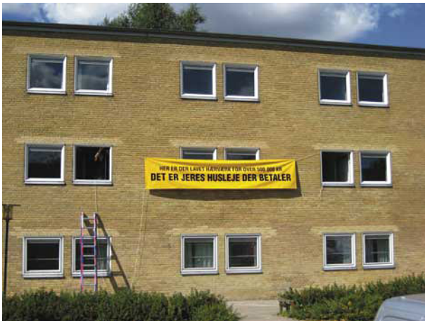
Figur 16. Banner mod hærværk opsat på områdesekretariatet efteråret 2007.

Den nye strategi, som udtrykt i en ny helhedsplan fra februar 2007, handlede derfor også om, at få nogle flere udefra til at komme ind i Tingbjerg-Utterslevhuse.