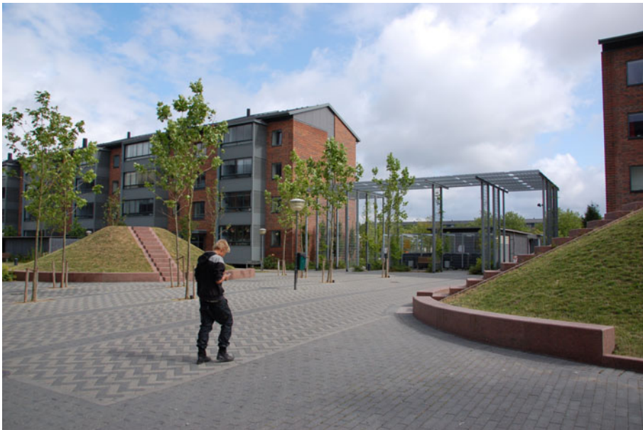
Figur 9. Vejleåparkens boligblokke har fået nye facader og inddækkede altaner. Boliggader og gangstrøg har fået nye belægninger, beplantninger, cykelskure, en ny ordning på affaldshåndteringen. Der er også lysthuse, boldbure og legepladser.