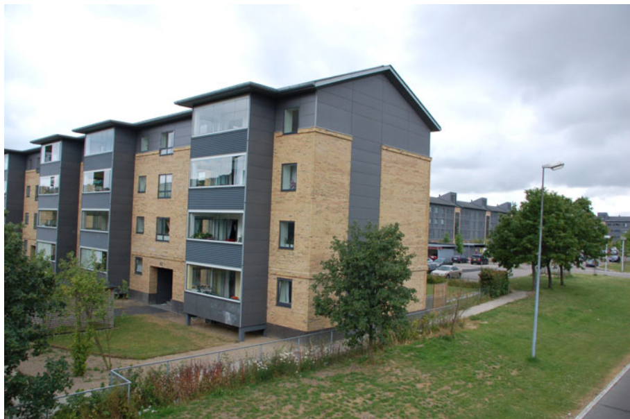
Figur 12. Dele af Vejleåparken har fået nye boliger i tagetagen. Her er der særligt gjort noget for at forbedre tilgængeligheden og mange af de nye boliger er specielt egnede til ældre og handicappede. Fra boliger i fx Vejlegården er der således niveaufri adgang til Ishøj Bycenter og S-togs station.

Men i Vejleåparken mente flere beboere, som deltog i et fokusgruppeinterview i november 2007 om renoveringen, at indgrebene havde været for omfattende. De ville aldrig have stemt for projektet, hvis de på forhånd havde været klar over, hvor ubehageligt det ville blive at bo i deres lejlighed, mens byggearbejdet stod på.