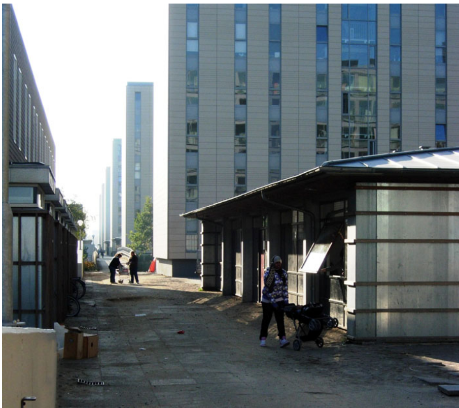
Figur 5. I efteråret 2007 var renoveringen af facader og boligblokke afsluttet, mens der stadig blev arbejdet på udearealer med at forny belægninger og beplantningen. Her ses Bispehavens hovedgangstrøg, som bl.a. passerer Trivselshuset midt i Bebyggelsen, fra nord mod syd.

Beboere i Bispehaven og Vejleåparken var glade for de fysiske forbedringer og energibesparelser på op til 30 procent.