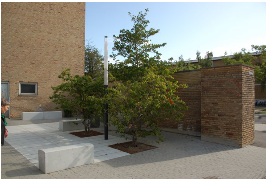
Figur 2. Uderum i Tingbjerg med nye belægninger, nye siddepladser, beplantning og belysning indbyder til ophold, leg og uformelt samvær.