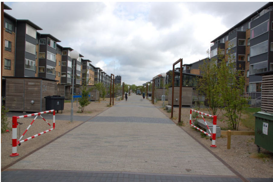
Figur 10. Det sydlige øst-vest-gående strøg, Østergården, ned gennem Vejleåparken. Strøget begynder ved gangbroen til Ishøj Bycenter og S-togs stationen og slutter ved Strandgårdsskolen.