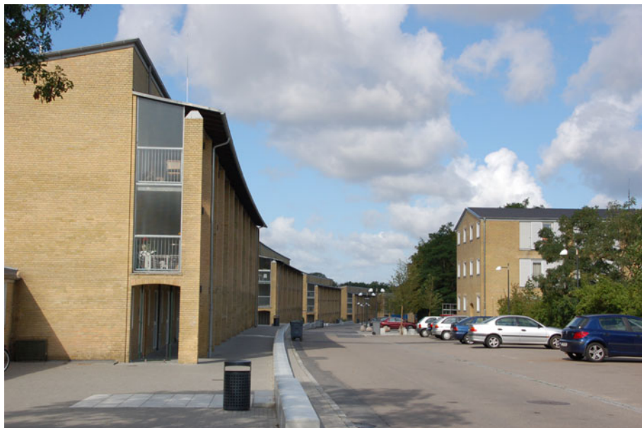
Figur 3. Arkaderne i Tingbjerg med nyrenoverede lejligheder står klar til at modtage familier, som gerne vil bo i en moderne bolig med let adgang både til byen og til grønne omgivelser. Arkaderne ligger midt i bebyggelsen tæt på skole, børneinstitutioner, indkøb og offentlig transport. Beboerne har direkte adgang til have fra bagsiden af husene. Fra stueetagen er der adgang via en trappe fra den enkelte bolig. Boligerne på 1. og 2. sal har adgang via en fælles hoveddør fra opgangen.