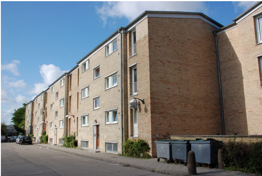
Figur 1. Tingbjerg er et veletableret boligkvarter opført 1957- 72 med mange treetagers boligblokke. Bebyggelsen fremstår i 2007 stort set som den oprindelig blev planlagt og bygget. Beboerne og boligorganisationerne yder en stor indsats for at fastholde og udvikle de kvaliteter bebyggelsen fik fra start. (Foto: Christian Deichmann Haagerup).

I Tingbjerg var renoveringer og ombygninger af lejligheder i Tårnhuset og Arkaderne langt fremme, og der foregik omfattende omlægning og renoveringer af friarealer og trafiksanering, bl.a. af hovedstrøget Ruten.