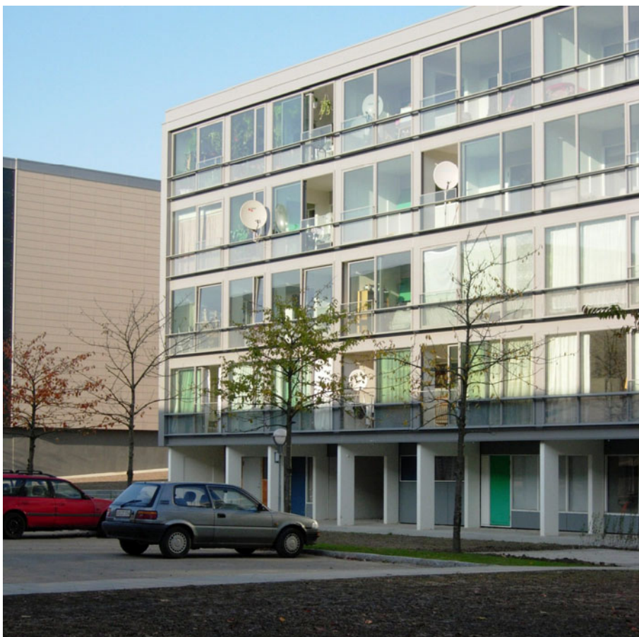
Figur 6. Nye facader i Bispehaven bidrager med et nyt arkitektonisk udtryk, mere komfort i den enkelte bolig og væsentlige energibesparelser. Her ses den sydvendte facade med glasinddækkede altaner på en af de lave firetagers boligblokke.