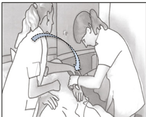
Figur 4. Den selvstændige aktør, illustration

Der sker to interessante ting i dette klip. Vi kan se, at den kliniske vejleders strategi med at bruge flere modaliteter bringes videre ind i denne situation, hvor det er den studerende, der skal fjerne et kateter. I linje 1 og i linje 9 benytter hun sig således ud over sin tale også af gestik, da hun peger ned på bestemte områder, den studerende skal forholde sig til. Denne bevægelse i linje 9 er også illustreret med en pil på billede 4. Den kliniske vejleder rækker ind over patienten og peger for at kunne lede opmærksomheden hen på et specifikt område, samtidig