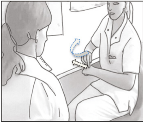
Figur 8. Evaluering i enerum, illustration

to modaliteter understøtter hinanden, og den kliniske vejleder har muligheden for at være præcis i sin kommunikation, når hun bruger den kropslige modalitet: Når hun ikke har selve kateteret i hånden, kan hun vise situationen hypotetisk gentagne gange og kan vende hånd og vride forskelligt og på den måde illustrere adskillige måder, man kan vende sin hånd forkert på. Hendes detaljerede gestik virker som en semantisk præcisering ( semantic specifier ) (Kendon 2004: 190), der sparer hende for lange verbale forklaringer om, hvordan man på forskellig måde kan vende hånden forkert. Den studerende er i dette klip igen aktiv og viser gennem minimalrespons at være engageret i samtalen. Hun svarer med »Ja« og nikker løbende.