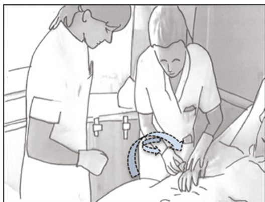
Figur 2. Multimodal instruktion, illustration

Den kliniske vejleder bruger flere modaliteter til at kommunikere sin viden om at fjerne et kateter til den studerende: Hun gør sin handling kropsligt, samtidig med at hun taler om, hvad hun gør. På den måde knyttes modaliteten 'kropsligt vist handling' (Norris 2004) til et beskrivende verbalsprog, tilsvarende hvad Heritage og Stivers beskriver i deres analyse af interaktion mellem patienter og læger som en 'online commentary' (1999: 1503). Vi ser det i linje 1, hvor hun løsner plasteret, samtidig