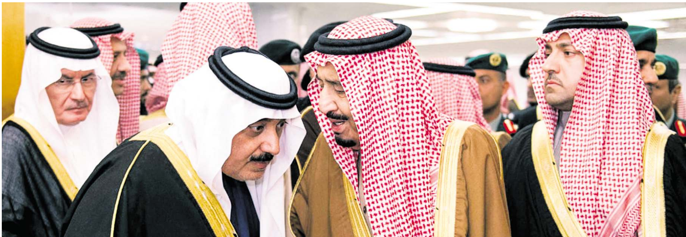
SMØRELSE. Saudi-Arabien må acceptere, at landet rykker ned i Mellemøstens hækkeorden i forhold til arvefjenden Iran, hvilket især skyldes, at man har prioriteret kortsigtet smørelse af klanledere over langsigtede reformer af økonomien.