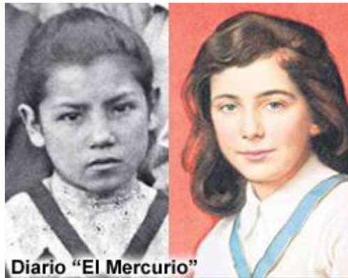
A la izquierda, el verdadero rostro de Laura Vicuña.