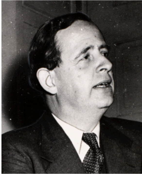
Finn Høffding (1948)