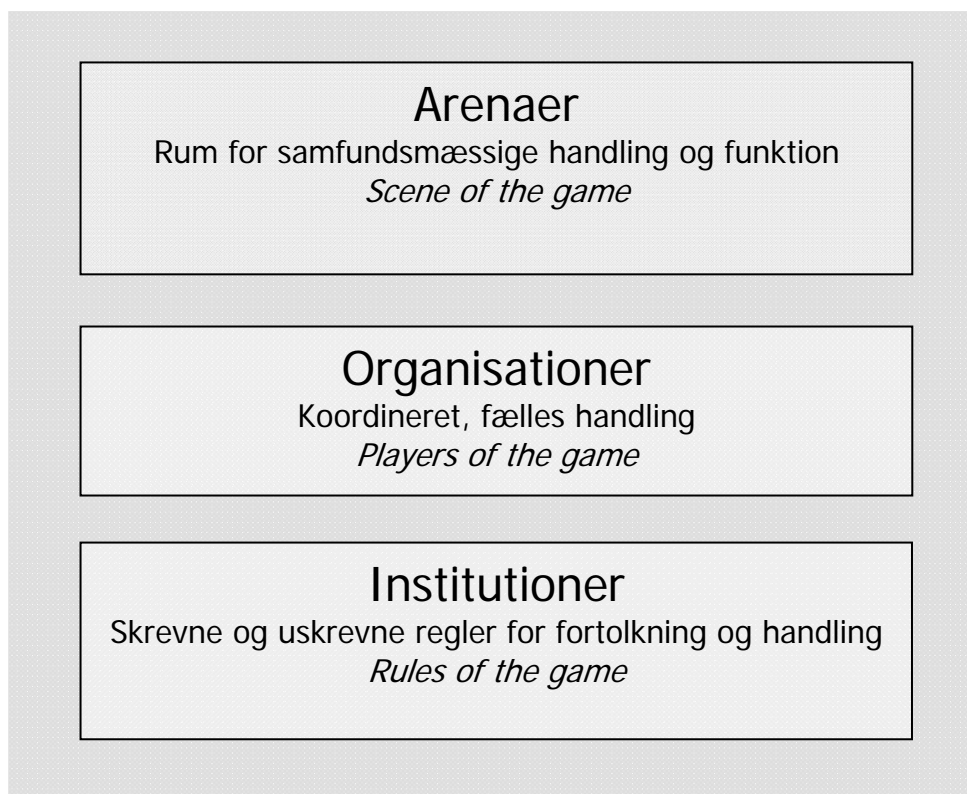
Figur 2: Det samfundsmæssige spil og dets elementer

Tilsammen kan de tre felter illustreret ovenfor beskrive et samfunds institutionelle arrangement og herved anvendes til nærmere at undersøge et givet samfunds institutionelle kapacitet.