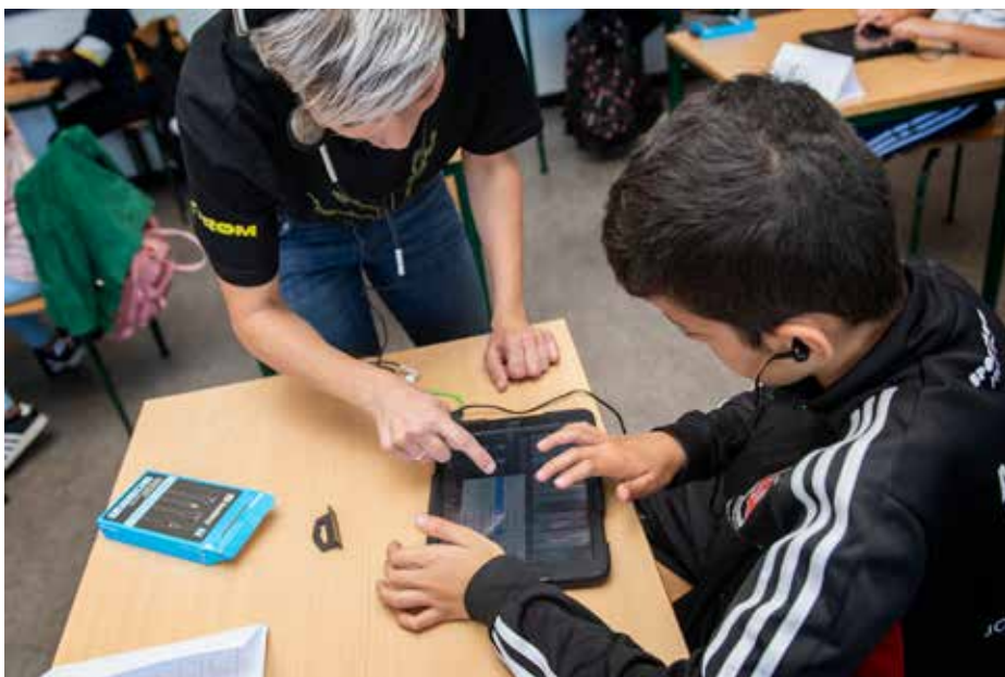
Ill. 6.3. Strøm til Børn på Bakkeskolen. Statens Kunstfond, 2020.

I musikforløbet Strøm til Børn skal børnene fra en skoleklasse på mellemtrin producere elektroniske musikstykker via en app på iPad. Formålet er, at børnene skal præsenteres for kunstneriske arbejdsmetoder, som de efterfølgende selvstændigt kan anvende til at producere egen musik. Forløbet foregår i deres klasselokale og som led i deres skoleuge. Under forløbet skifter børnene mellem individuelt arbejde og fælles øvelser, hvor der lyttes og kommenteres. Særligt under de fælles øvelser er der mulighed for at se, hvordan børnene anvender musikken som afsæt for at vise sig frem for hinanden på nye måder, og at det begejstrer mange. Under øvelserne lytter børnene opmærksomt til hinandens musik, ligesom de kommenterer engageret og kigger nysgerrigt rundt på de børn, hvis musik afspilles.