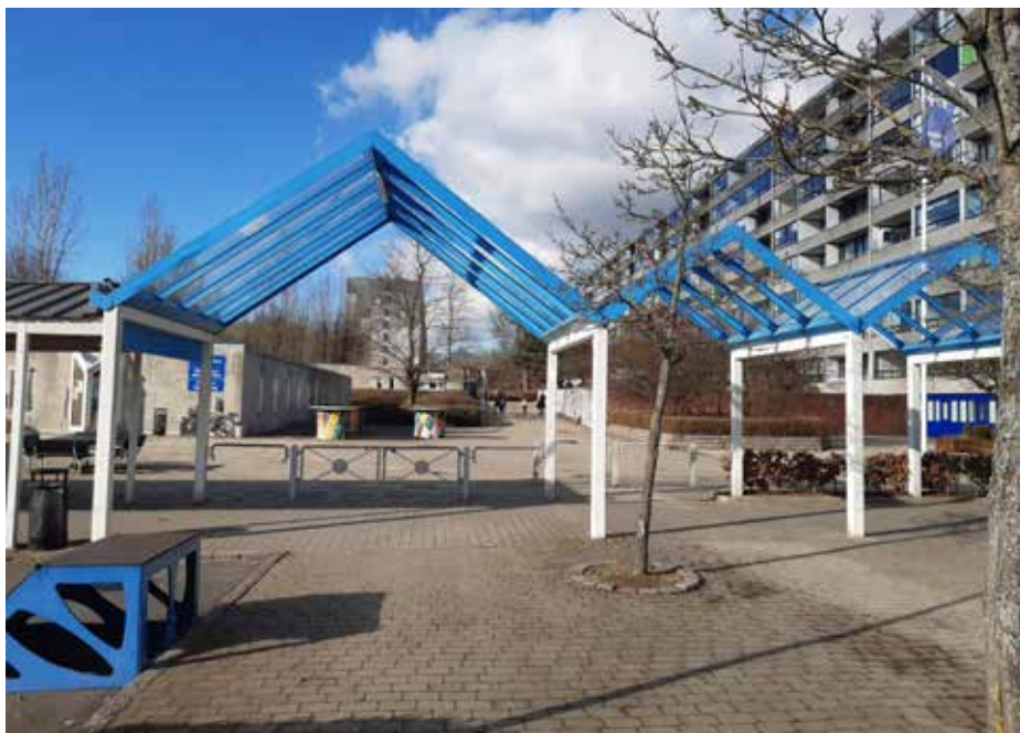
Ill. 7,16. Pergola, Værebros Park.

Selvom Larsens Opdag din by på mange måder skriver sig direkte ind i den strategiske udviklingsplan for Værebros Park ved at fokusere på forbindelseslinjerne mellem området og de nærliggende villakvarterer, er hendes valg af former og farver en direkte gestus til det æstetiske udtryk i Værebros Park. Formen på Zigzagbroen er fx en direkte reference til det afsluttende, glasoverdækkede forløb i den pergola, der binder hele Værebros Park sammen.