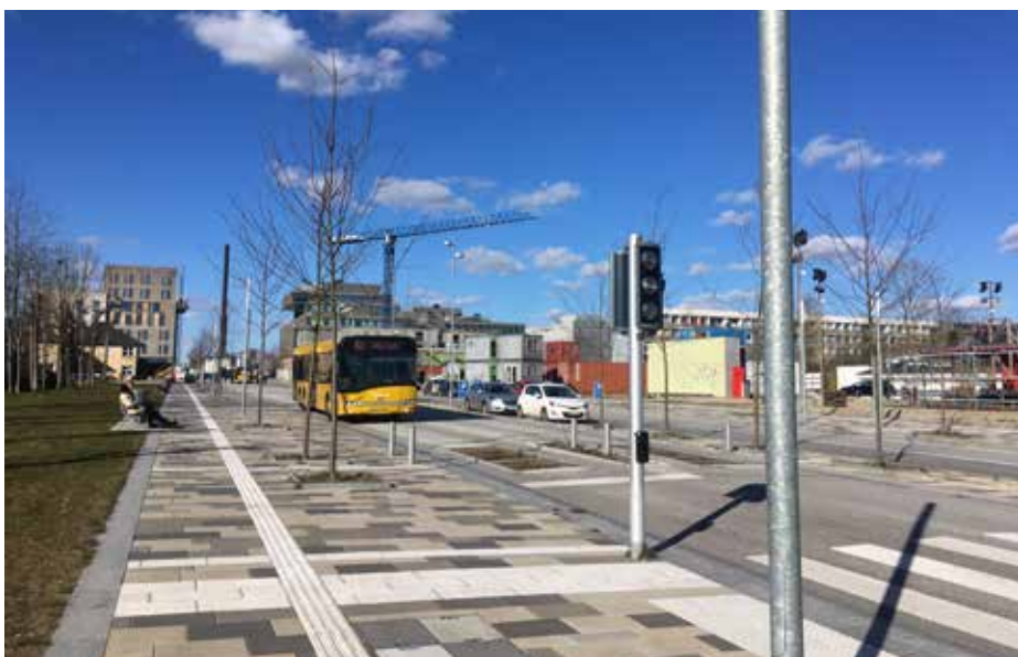
Ill. 8,1 og 8,2. Den ikoniske port, der både konkret og symbolsk skal åbne Gellerup op for byen, oktober 2021. Karen Blixens Boulevard, Gellerups nye hovedgade, marts 2019.