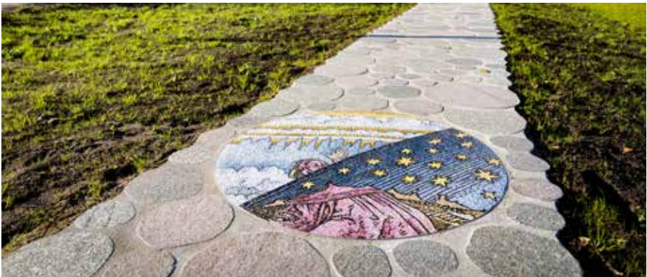
Ill. 9,7; 9,8 og 9,9. Galaksestien ved Jens Settegren. Ill. 9,7. Digital model af projektet ved kunstneren. Ill. 9,8 og 9,9. Stiforløb og nærbillede af mosaik.