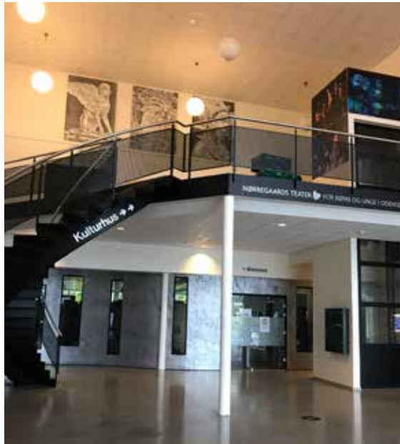
Ill. 9,4. Nørregaards Teater (det tidligere kulturhus) og Vollsmose Bibliotek, 2020.