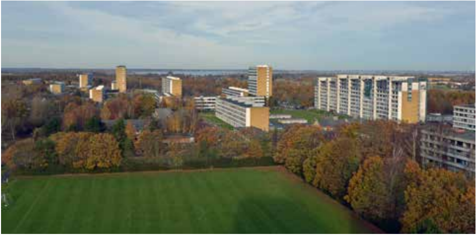
Ill. 3,2. Oversigtsfoto af Vollsrose november 2016.