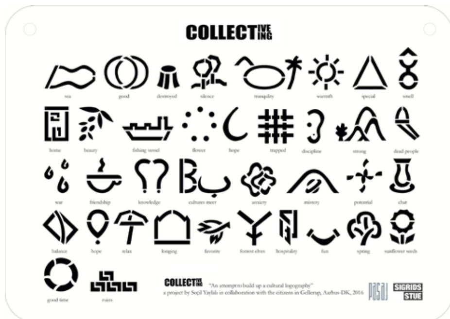
Ill. 8,6. Stencil af den kulturelle logografi skabt af Yaylı i samarbejde med beboere i Gellerup og Sigrids Stue. Se også billedet af neontegnene på bogens forside.

En anden konkret forandring af området har den tyrkiske kunstner Seçil Yaylı stået for. Under et arbejdsophold i forbindelse med det internationale kollaborative kunstprojekt Room for Improved Futures , som Sigrids Stue var