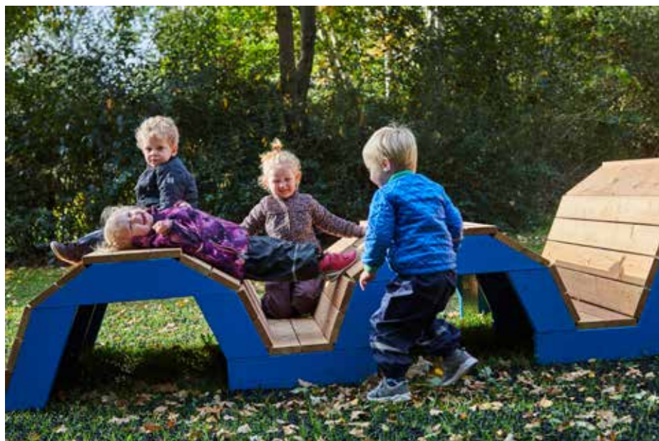
Ill. 7,14. Cirkelbroen. Kunst i Værebros Park. Statens Kunstfond.