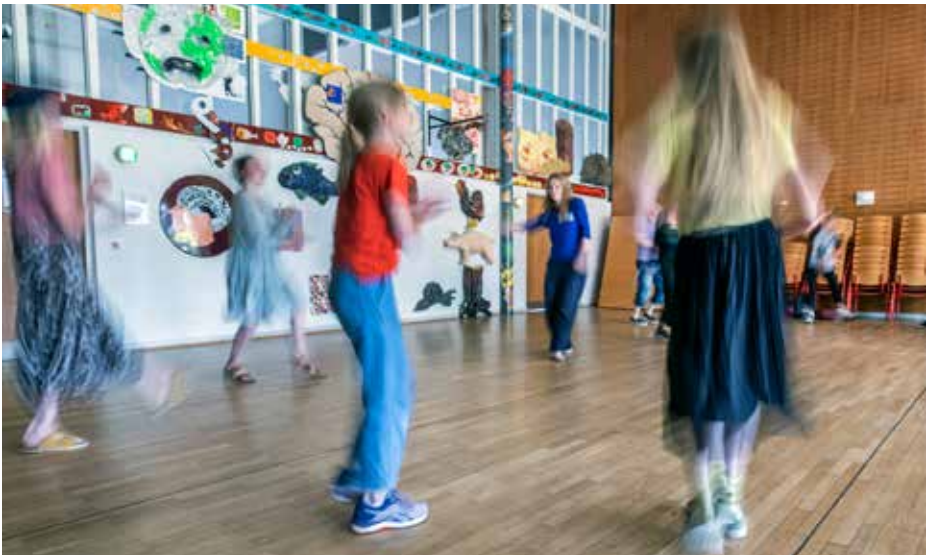
Ill. 6,4. Næste station Stengårdsvej på Bakkeskolen, 2020. Statens Kunstfond.

I en, stort set, indholdsmæssig identisk workshop, som Collective Bleeding laver med en mindre gruppe børn fra den lokale ungdomsklub på Stengårdsvej i samme uge, viser der sig imidlertid en helt anden situation, hvor børnene er motiverede og begejstrede for workshoppens øvelser. I denne workshop er der tale om en langt mindre gruppe af børn, hvoraf de fleste kender hinanden på forhånd, og desuden er der her tale om frivillig deltagelse via ungdomsklubben for de børn, som har lyst. Betingelserne for, at der kan opstå æstetiske fællesskaber, er derfor foruden motivation og til dels frivillighed den nævnte sikring af et trygt socialt rum, der kan give børnene ro og styrke til at fordybe sig i de kreative processer, samt at sætte sig selv i spil på nye måder.