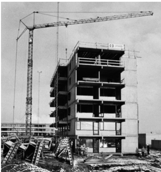
Ill. 6,2. Opførelse af højhus på Stengårdsvej ca. 1976. Bygningen står i dag overfor at skulle rives ned, og alle beboere genhuses.

Mens de politisk-strategiske visioner for området udtrykker et ønske om at styrke identitet og sammenhold lokalt, så oplever nogle beboere, at eksisterende fællesskaber opløses. Formanden for en af beboerforeningerne i området og en boligsocial medarbejder udtrykker situationen sådan: ”Det er ganske forfærdeligt, og der er en magtesløshed blandt beboerne”. 2 Magtesløsheden skyldes bl.a., at der på trods af en forståelse for nogle af de overordnede intentioner om bred beboersammensætning og tryghed i området, som ghettoplanen indebærer, er stor utilfredshed med den måde, hvorpå kravene bliver udstukket fra oven. Kravene forholder sig ifølge beboere og kommune hverken til den udvikling, som det specifikke boligområde i forvejen befinder sig i, eller til beboernes egne oplevelser af livet i området (ibid.; Christensen 2018; Falther 2020). En del beboere oplever, at de forholdsvist få negative fortællinger fra området får stor opmærksomhed i medierne, mens de positive fortællinger, som for mange kendetegner dagligdagen i området, sjældent har interesse (Elgaard 2018; Falther 2020; Stengårdsvej Beboere 2020). 3 Der udspiller sig dermed omkring Stengårdsvej en kamp om repræsentationen af området, som vi også ser i de øvrige områder, og som gør Stengårdsvej til en emotionel geografi i Høghøj & Holmqvists forstand