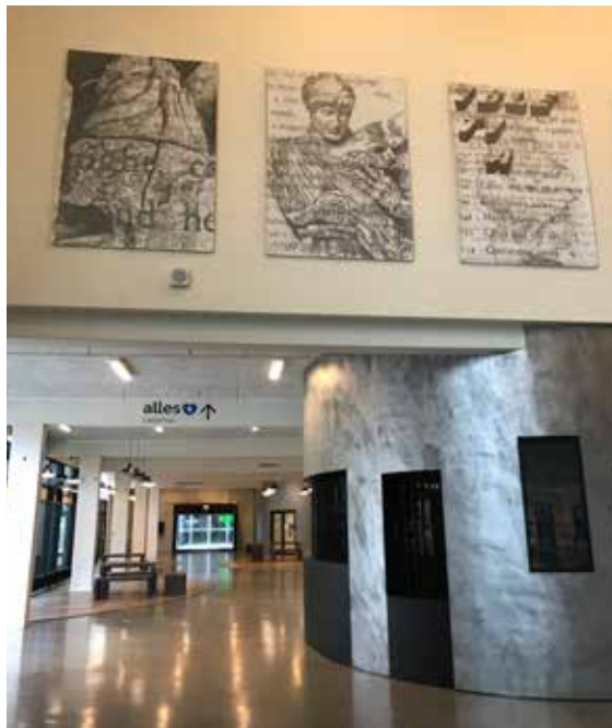
Ill. 9,5. BURET med blik til Usynlige Byer af Asbjørn Skou, 2020.