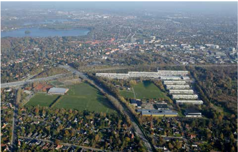
Ill. 3,3 og 3,4. Stengårdsvej. Værebros Park.