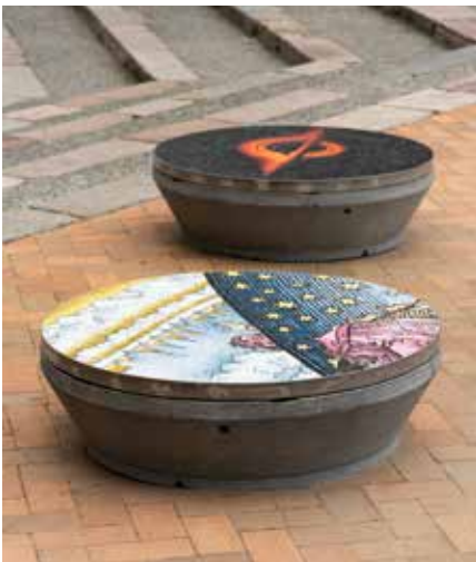
Ill. 9,10 og 9,11. Worldbuilding. Udstilling på Kunstmuseum Brandts. Kunstner: Jens Settergren. Kurator: Julie Tvillinggaard Bonde. Overblik over udstillingsområde samt nærbillede af mosaikker.