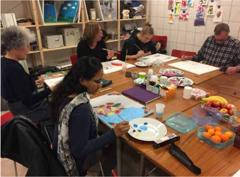
Ill. 7,11. Malerskolen i KunstVild.