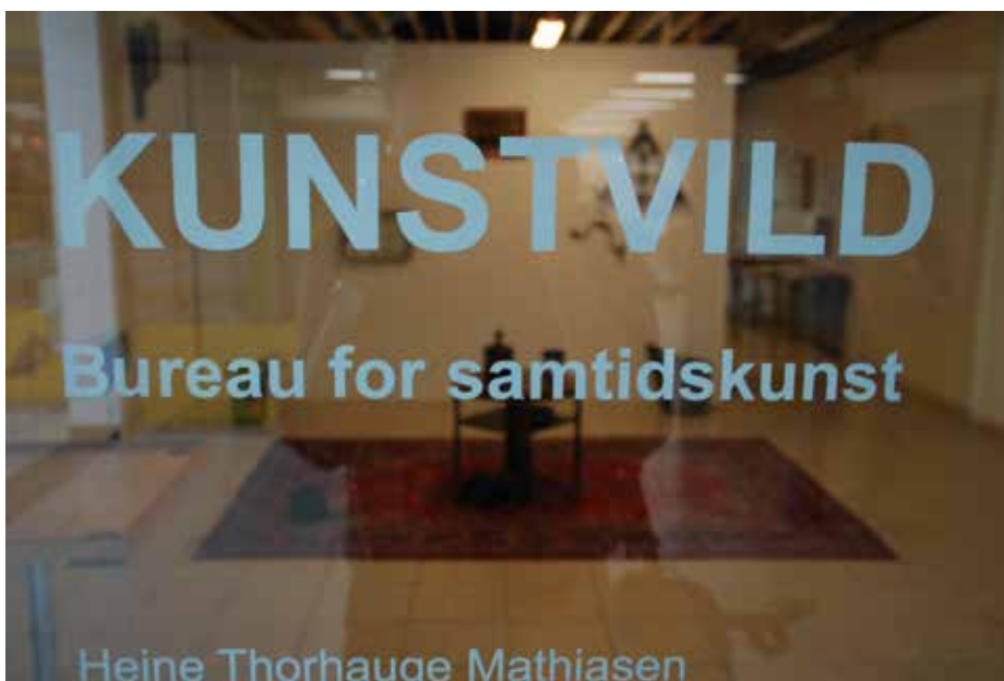
Ill. 7,6. KunstVild. Kunst i Værebros Park. Støttet af Statens Kunstfond.

Da de fire kunstnere indleder deres arbejdsophold i Værebros Park, er det som anført et krav, at de ikke allerede har etableret nogen samarbejdsaftaler i området. Det betyder, at de – udover den formelle, repræsentative struktur, som afdelingsbestyrelsen udgør i området – som udgangspunkt ikke har en allerede eksisterende infrastruktur at tænke deres dialog med beboerne og områdets andre aktører ind i (som fx den lokale skole, som det er tilfældet på Stengårdsvej i Esbjerg; se kapitel 6). I den forstand bliver de fire kunstneres indretning af det butikslokale, de får stillet til rådighed som base for deres arbejde i Værebros Park, også en etablering af en art infrastruktur rettet mod møder med beboerne og områdets øvrige aktører (i stil med Sigrids Stue i Gellerup Parken; se kapitel 8).