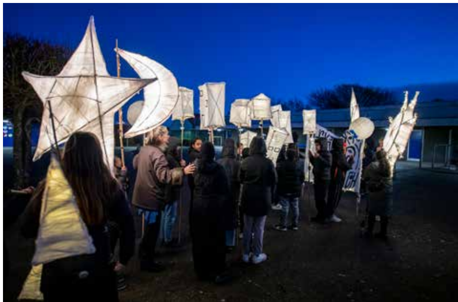
Ill. 6,5. Lysende Hjælpere på Bakkeskolen. Statens Kunstfond, 2020.

Betydningen af kunstnerens rolle som repræsentant for alternative livsbiografier, livsveje og livsvalg viser sig også i andre undersøgelser af børn og unges møder med kunstnere. Det gælder bl.a. i evalueringer af Huskunstnerordningen, hvor børns møder med kunstnerne vurderes at være et centralt udbytte og i nogle tilfælde af større betydning end selve den kunstneriske aktivitet eller 'værket' (Kunstrådet 2008). Det gælder også i Nielsen & Sørensen (2017), hvor det, at unge møder kunstnere, som har taget andre livsvalg, vurderes at være en væsentlig og positiv faktor.