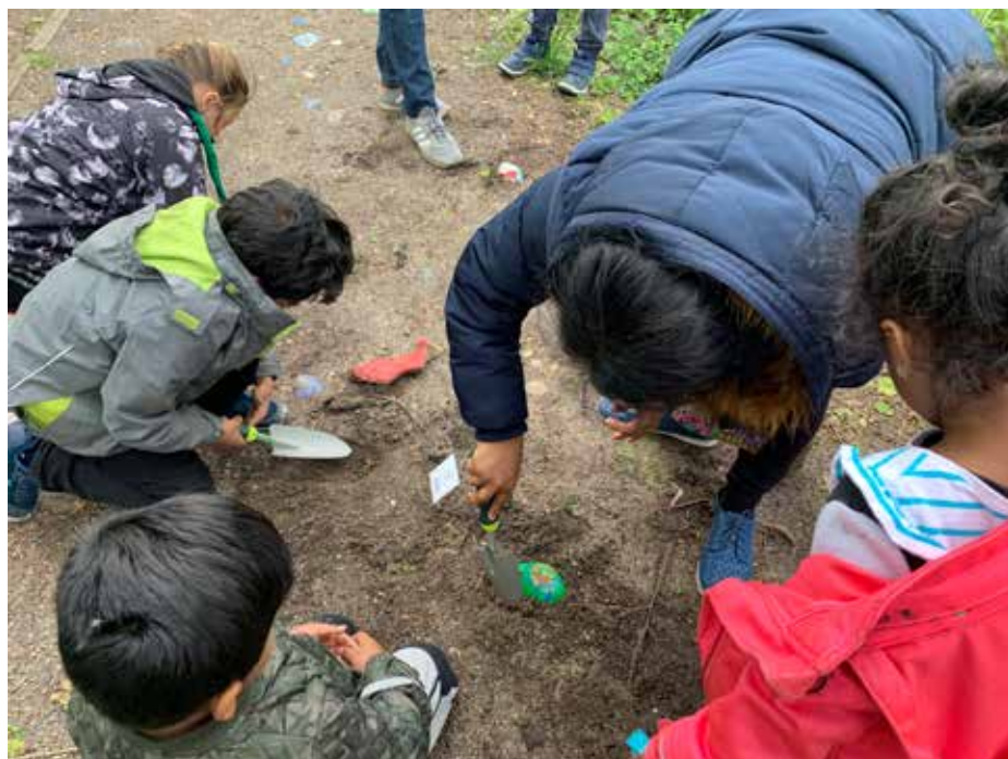
Ill. 7,15. Sansestien. Kunst i Værebros Park. Statens Kunstfond.