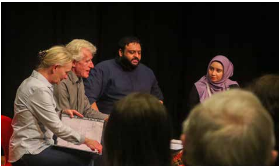
Ill. 9,2. Forumteater ved teatergruppen 5240 Act Now: Nu er det os! 8. november 2021 på Nørregaards Teater.

Indledningsvis 'ryddes tavlen' med nedlæggelsen af Vollsmose Kulturhus, der blev startet op med støtte fra netop Landsbyggefonden i 2008, med udgangen af 2017. Nedlæggelsen fremstår i den offentlige debat som en spareøvelse, men er også udtryk for en økonomisk omprioritering og en idé om at skabe rum for en ny samlet kulturstrategi, der kan støtte op omkring de øvrige planer for bydelen. Kulturhuset har ellers indtil da fungeret som en fleksibel ramme for kulturaktiviteter med mulighed for støtte til beboerforslag i kombination med initiativer fra faste medarbejdere og midlertidigt ansatte på tilknyttede projekter. Huset har haft hjemme oven på Vollsmose Bibliotek i det lokale center, Vollsmose Torv, og har foruden større sale til musik- og teaterarrangementer omfattet møde- og værkstedsfaciliteter og lokaler til brug for fællesspisninger og udleje m.v.