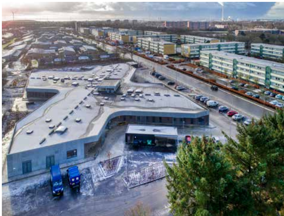
Ill. 6,1. Stengårdsvej med bydelshuset Krydset i forgrunden.

Boligområdet Stengårdsvej blev opført af boligforeningen Ungdomsbo i 1967-71, da borgerne i Esbjerg manglede gode boliger til overkommelige priser. Gennem årene har boligmassen i det østlige Esbjerg udviklet sig, og i dag består boligområdet af i alt 579 almene familieboliger, fordelt på 21 etageejendomme og et højhus (Landsbyggefonden 2020). Området er placeret mellem på den ene side grønne områder, uddannelsesinstitutioner og villakvarterer og på den anden side erhvervsbyggerier, sportsfaciliteter og en indfaldsvej. Beboerne i området har etnisk oprindelse i en lang række forskellige lande foruden Danmark, såsom Somalia, Tyrkiet, Libanon, Bosnien-Hercegovina, Vietnam og Myanmar. Den etniske heterogenitet betyder bl.a., at området adskiller sig markant fra, hvad sociologen Loïc Wacquant definerer som ghetto (se kapitel 4).