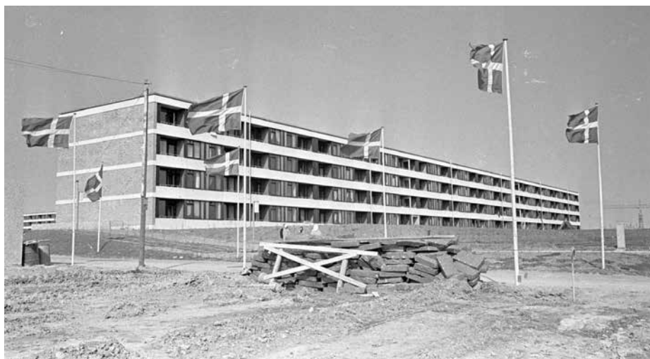
Ill. 3,1. Rejsegilde i Vollsmose 1967.

Nybyggeriet af almene boliger toppede i 1960'erne og begyndelsen af 1970'erne, hvor også de fire boligområder, som vi fokuserer på – Gellerup, Stengårdsvej, Vollsmose og Værebros Park – er bygget. Udbredelsen af de almene boliger medførte, at nybyggeriet kom til at indgå i statens rationaliseringsbestræbelser, og fra begyndelsen af 1960'erne var det ligefrem en betingelse for støtte, at byggeriet blev opført som montagebyggeri (ibid., 19-20). Fælles for periodens planbyggeri omkring de større danske byer er også, at man skabte nye almennyttige boligområder med store og gode lejligheder i modernistiske etagebyggerier. Udover de store, ensartede boligblokke lavet af betonelementer var her lys og luft, rekreative grønne områder og en række andre faciliteter. I de største af boligområderne som fx Gellerupplanen i Aarhus var der indkøbscenter, offentlige institutioner, svømmehal, teater, fritidsklubber m.m.: "Der er tænkt på det hele i landets mest avancerede boligbyggeri!", som Brabrand Boligforening skrev i 1972 (cit. efter Høghøj & Holmqvist 2018, 131). I et mindre område som Værebros Park, som blev kaldt 'Kollektivbyen', var der også plejehjem, hotel og posthus, og generelt var boligområderne tænkt som selvstændige enheder, der skulle rumme alle de funktioner, beboerne havde brug for.