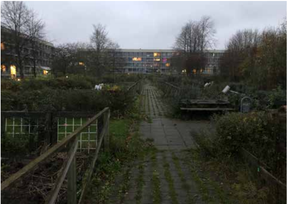
Ill. 8,9 og 8,10. Byhaverne mellem blokkene november 2020 og bænke foran Byværkstedet i UdeStuen december 2020.