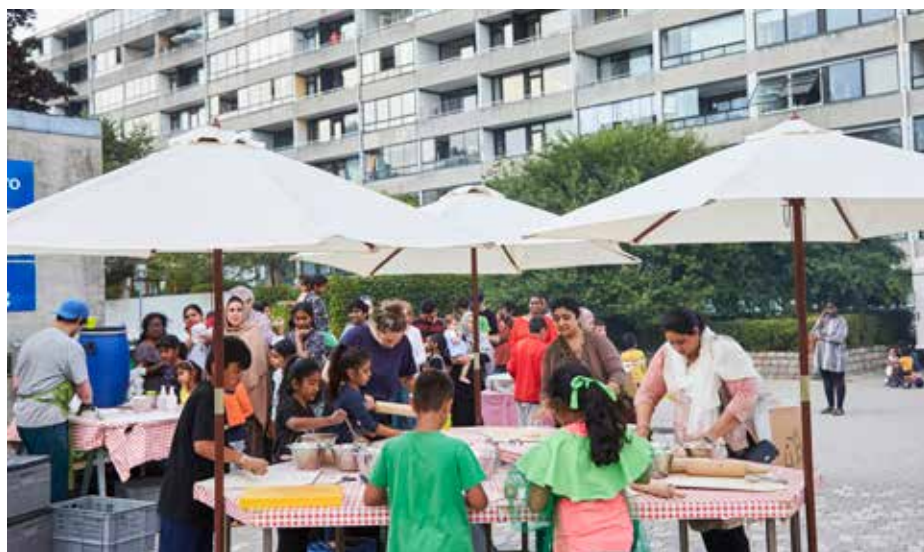
Ill. 7,3. Beboere laver pizza, Let's Make Pizza. Kunstner: Jesper Aabille. Kunst i Værebros Park. Støttet af Statens Kunstfond.

Efter arbejdsopholdene bevilges to af kunstnerne, Larsen og Aabille, yderligere midler i efteråret 2018 og foråret 2019 til at arbejde videre med at realisere Opdag din by som et midlertidigt værk (Larsen) og koordinere en række forskellige