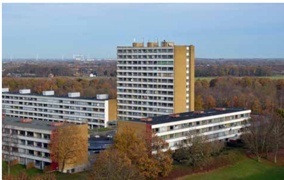
Ill. 9.1. Vollsmose, oversigtsfoto fra området. Foto: Jørgen Gregersen, 22. nov. 2016. Boligsocialt Hus.