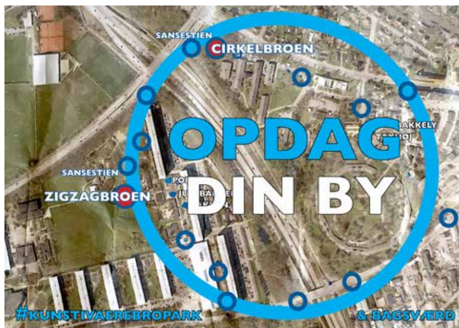
Ill. 7,12. Opdag din by, overblikskort. Illustration: Karoline H. Larsen.

I citatet forklarer Larsen, hvordan hun i løbet af mødet fokuserer på at etablere et rum, hvor pædagogerne fra de forskellige børnehuse kan præcisere, hvad de mener, når de taler om en kunststi, herunder hvilke ruter den skal følge med afsæt i de ture, de forskellige børnehuse går med børnene i deres hverdag.