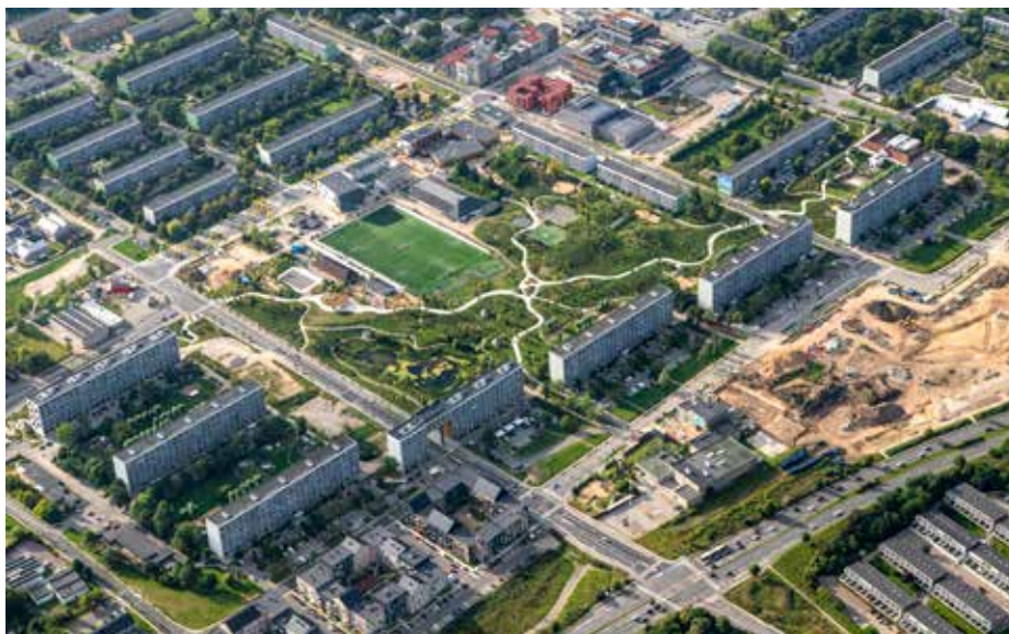
Ill. 3,5 og 3,6. Blandt de almene boligområder på ghettolisten er de fysiske omdannelser mest fremskredne i Gellerup. Ill. 3,5. Det nybyggede private lejlighedsbyggeri, Pionerhusene, mellem blokkene og Ringvejen juni 2019. Foto: Aarhus Kommune. Ill. 3,6. Gellerup med ny bypark, nye brede veje samt nye kommunale og private byggerier med varierede facader, hvor der tidligere lå boligblokke, september 2021. Foto: Aarhus Kommune.

Mette Frederiksen's S-regering har fortsat politikken. Senest har den ganske vist droppet ghettobetegnelsen i de officielle lister, men kun for at indføre det ligeledes stigmatiserende 'parallelsamfund' som officiel betegnelse. Den 1. december 2021 er 'ghetto' og 'hård ghetto' således erstattet med henholdsvis 'parallelsamfund' og 'omdannelsesområde', men betegnelsen 'udsatte boligområder' samt kriterierne for alle tre lister er uændrede (Indenrigs- og Boligministeriet 2021a & 2021b). 4 Som i 2020 er antallet af boligområder på listerne faldet, så der i 2021 er 20 'udsatte boligområder', heraf 12 'parallelsamfundsområder' og heraf igen 10 'omdannelsesområder' (inklusive Vollsmose, Gellerup/Toveshøj og Stengårdsvej).