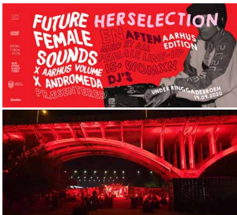
Ill. 8,13 og 8,14. Annoncering af og foto fra koncert med kvindelige DJs under Ringgadebroen i 2020.

Andromeda har en eksplicit politisk profil, der ligger i tråd med Schrags aktivistiske kunst og Mouffes strategiske dissens. Denne dissens udfoldes i et bredt spektrum af aktiviteter med mange forskellige samarbejdspartnere og udpræget funky titler. Eksempler er en Pimp dit banner og skilt bootcamp på kunstmuseet ARoS før en demonstration imod nedrivninger, zine-workshops , Vest for Paradis med screeninger af syriske film, Demolition Tours , der som alternativ til kommunens guidede ture om Helhedsplanen viderefremidler Gellerups egne stemmer og fortællinger, samt DJ-workshops for kvinder og femme -identificerende personer afsluttende med en koncert under Ringgadebroen i Aarhus. Andromeda arbejder i mange medier og har senest produceret kunstvideoerne Decolonizing Aarhus: A sonic walk from Aarhus C to Gellerup og Collective Amnesia – Update within the Crisis , hvor sidstnævnte blev vist på Berlin Biennalen 2020. Med dette brede spektrum af aktiviteter og samarbejdspartnere etablerer Andromeda dekoloniale og intersektionelle alliancer mellem minoriteter. De er på én gang lokale og globale, hvilket også ses i deres 'søndagsblok' på Facebookprofilen, hvor de kuraterer en mangfoldighed af videoer og tekster om køn, etnicitet, musik, betonarkitektur m.m. fra en globaliseret verden.