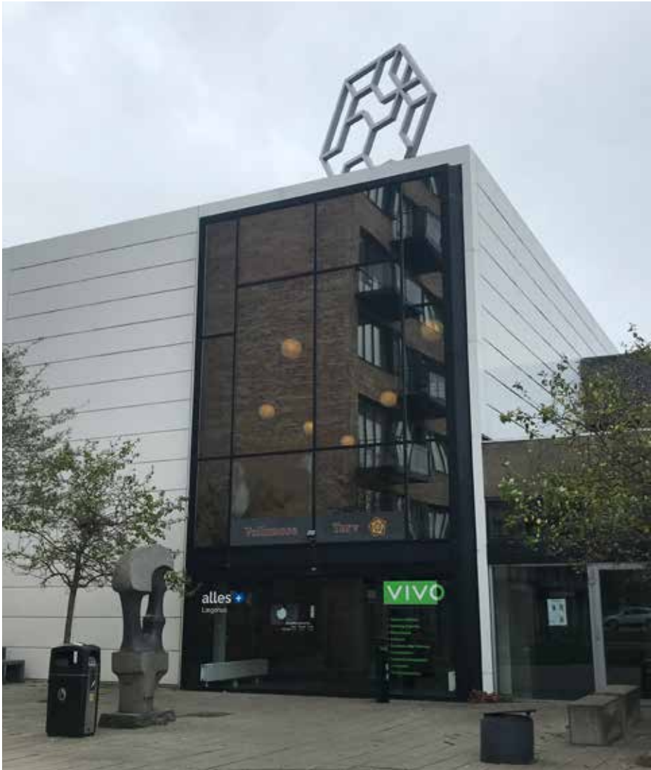
Ill. 9.3. Vollsmose Torv. Indgangspartiet mod øst med 5240 Vollsmose af Astrid Krogh som vartegn, 2020.

alt 200.000 kr. I 2018 udmøntes de i en række aktiviteter for forskellige aldersgrupper, omfattende både teater, film, musik og litteratur. Der samarbejdes med lokale foreninger, der også huses i det tidligere kulturhus' lokaler, idet adgangen til lokalerne gøres nemmere og billigere. 9 Samtidig arrangeres temarækken På tværs af grænser , der både vender blikket ud mod verden og bringer verden til Vollsmose gennem forskellige artist talks , koncerter m.v. 10