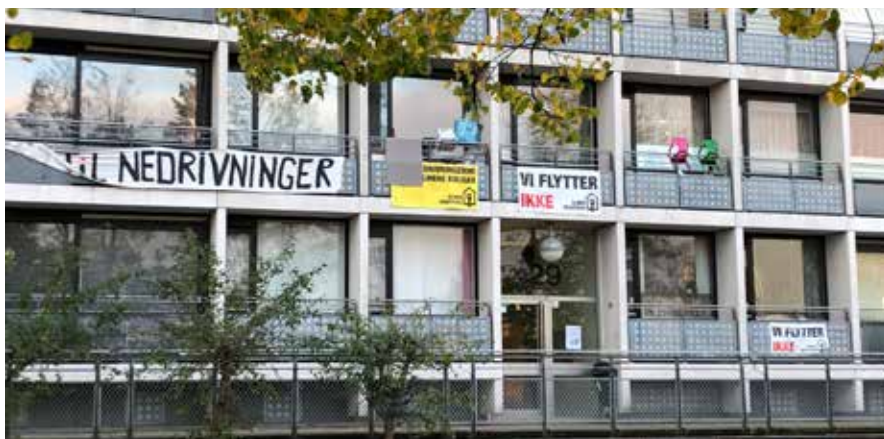
Ill. 4,1 og 4,2. Modstanden i boligområderne organiseres især af Almen Modstand. Demonstration og bannere fra lejlighederne i Gellerup henholdsvis april og oktober 2021.