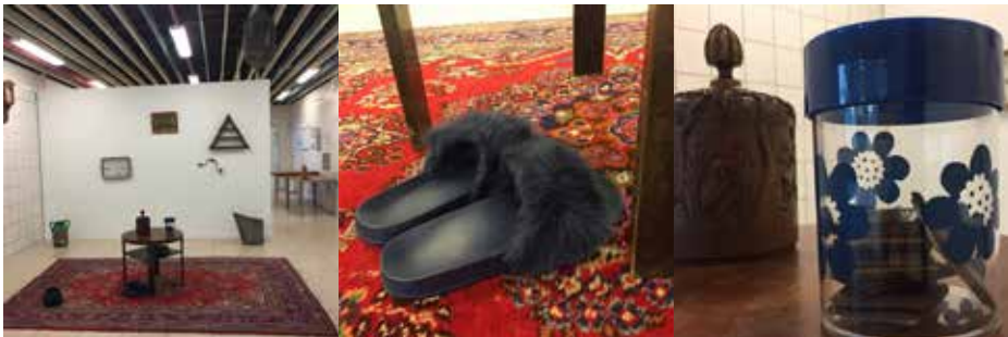
Ill 7,8, 7,9 og 7,10. Udstillingen Dagligstuen.

Det lykkes på mange måder hen over sommeren og i den efterfølgende periode at etablere KunstVild som et samlingspunkt for kunst i Værebropark. Butikken bliver et sted, som beboerne og andre aktører i området kender, hvor kunstnerne kan møde dem, og hvor de bringer deres netværk af andre kunstnere ind. For nogle af beboerne bliver KunstVild et særligt sted, som de vender tilbage til igen og igen og udvikler en tilknytning til. Her beskriver en af beboerne, hvorfor han personligt begynder at kigge forbi butikken, når der er åbent: