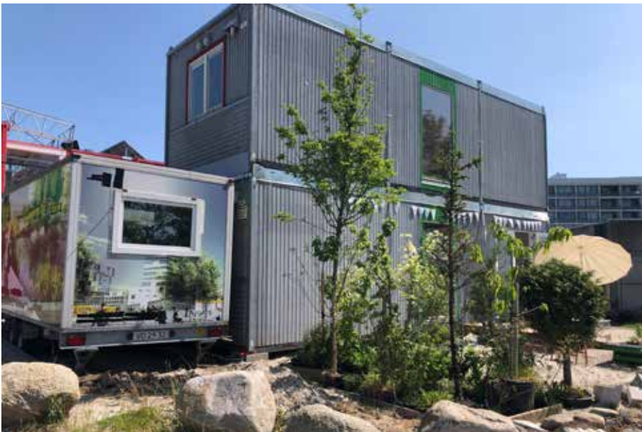
Ill. 8,7 og 8,8. Plantesanatoriet juni 2020 og detalje af samme december 2020.

arbejdede med Udviklingsplanen og også deltog i havevandringen, inviteret, på myntete og søde kager. Her – og også i en efterfølgende personlig mail til deltagerne – italesatte Aagaard den politiske kamp om området ved eksplicit at opfordre til at gøre indsigelse imod den Udviklingsplan, der stik imod den aktuelle interesse i byhaver og bæredygtighed glemmer Gellerups nyttehaver.