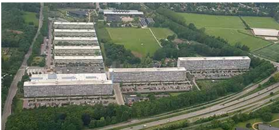
Ill. 7,1. Værebros Park, 2021.

I Gladsaxe nordvest for København ligger boligområdet Værebros Park fra 1967. Her bor knap 3.000 beboere i tre otteetagers og fem fireetagers boligblokke omkranset af velholdte udearealer med store plæner, træer og en lille sø. Området afgrænses af tre store omfarts- og motorveje, men ligger naturskønt med Hareskoven og Smør- og Fedtmosen tæt på og med villakvarterer i Bagsværd som nærmeste nabo. Værebros Park er i 2012 ramt af en række banderelaterede volds- og skudepisoder, der – både af en omverden og beboerne selv – beskrives som kulminationen på en længere periode, hvor området i stigende grad er blevet associeret med kriminalitet og hærværk, radikalisering, resourcesvage beboere og en stor andel af beboere med ikke-vestlig baggrund (interviews 2019-21; Bagsværd i balance 2018; Boligliv i Balance 2015; Byplanafdelingen; Gladsaxe Kommune 2012). Området er på regeringens liste over 'udsatte boligområder', da den offentliggøres første gang i 2010 og indtil 2018, hvor kriterierne for listen ændres, og Værebros Park udgår. Da der i 2021 igen introduceres nye kriterier med listen over 'forebyggelsesområder', optræder området igen på listen.