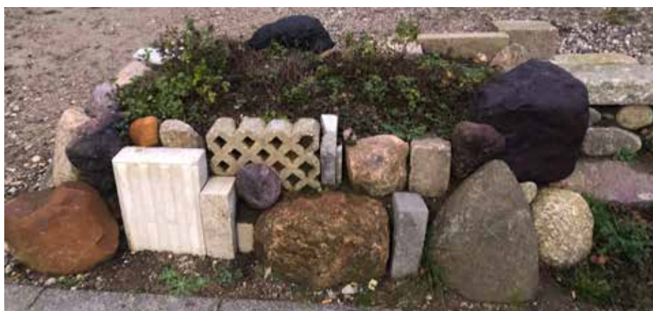
Ill. 8,4 og 8,5. Sigrids UdeStue med arbejde på Sten, sti, dige juni 2020 og detalje af samme december 2020.