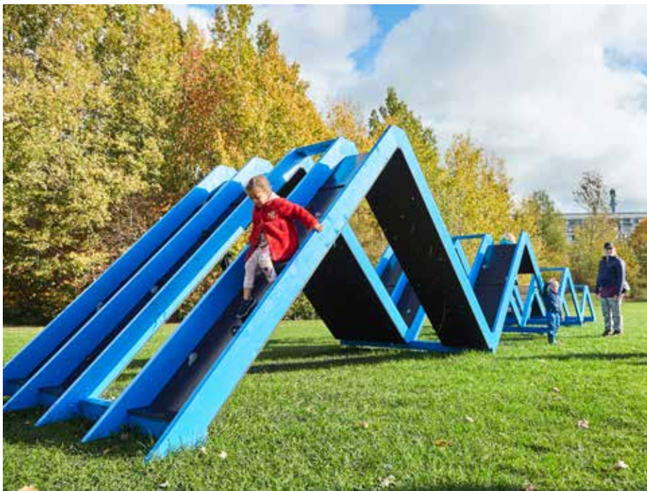
Ill. 7.13. Zigzagbroen. Kunst i Værebros Park. Statens Kunstfond.

henblik på at skabe nye mødesteder, som pædagogerne kan bruge på tværs af børnehusene. En måned efter præsenterer Larsen på en workshop for alle pædagogerne i de fem børnehuse skitsen til Opdag din by , og her arbejder de med at kommentere, slette og udbygge forskellige elementer i kunststien. Mens nogle elementer falder ud, er der stor opbakning til de bevægelsesorienterede og geometrisk inspirerede installationer Zigzagbroen og Cirkelbroen , som Larsen har placeret på hver side af motorvejen, der adskiller Værebros Park og villakvartererne. Efterfølgende mødes Larsen og pædagogerne fra de forskellige børnehuse løbende for at godkende den endelige skitse og senere for at udvikle og organisere et årshjul af aktiviteter, der sætter kunststien i spil i børnehusenes hverdag. I det tidlige efterår 2018 får Larsen tilladelse til at realisere Opdag din by som en semi-permanent installation (toårig), og i oktober 2018 afholder børnehusene en officiel åbning af kunststien, hvor også Aabille laver en pizza-happening. I foråret 2019 følger arbejdet med yderligere et element i kunststien, da Larsen skaber Sansestien som en fælles aktivitet mellem børnehusene. Der er tale om en beboertrådt sti, der etablerer en genvej gennem en lille skovbevoksning, og som Larsen lader børnene brolægge med sten, de selv har malet.