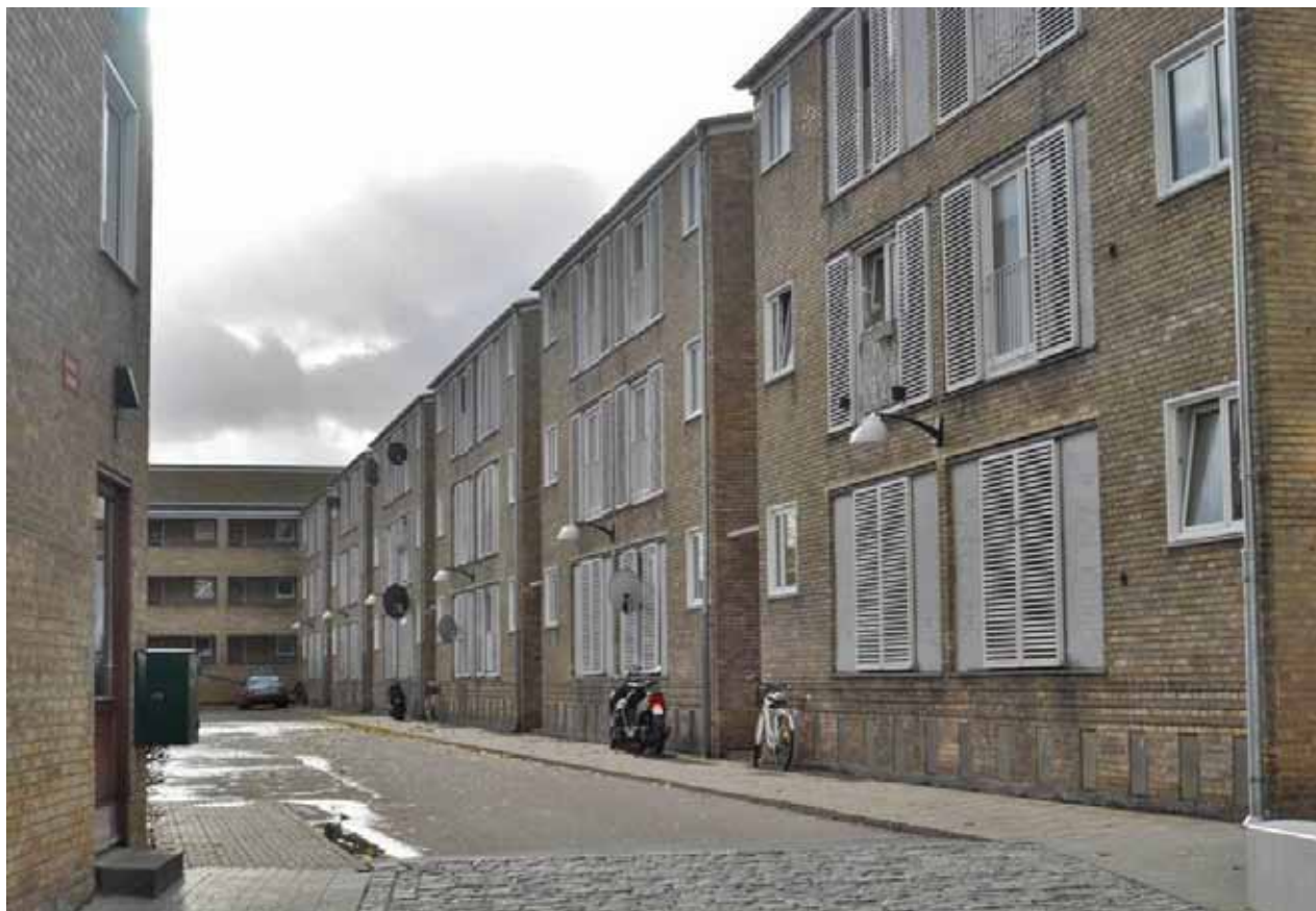
Steen Eiler Rasmussens fortræffelige bebyggelse "Menneskesamfundet Tingbjerg" har siden opførelsen i 1960'erne udviklet sig til en multi-etnisk bydel, hvor næsten 70 % er indvandrere og efterkommere. Bo Vagnby.