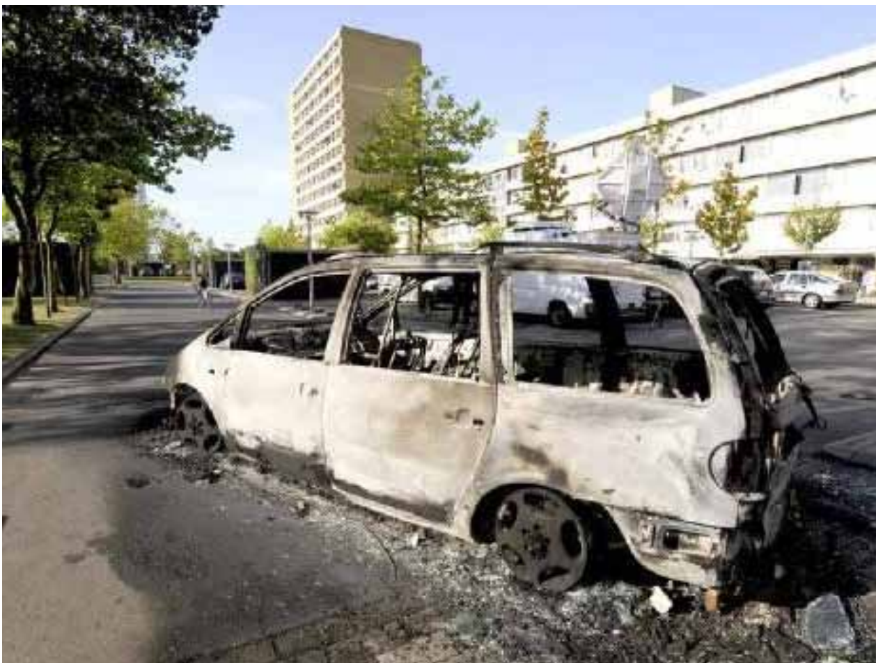
Afbrænding af en bil Vollsmose satte for alvor fart i debatten om den "stigende retsløshed i ghettoerne".

løbet af efteråret, men blev overhalet med en uges tid af oppositionens udspil. I indledningen nævnes det, at Danmark i generationer har opbygget et trygt, rigt og frit samfund, hvor det afgørende bindemiddel har været og stadig er vores værdier (Regeringen 2010: 5). Allerede få dage efter anklagede Dansk Folkepartis leder, Pia Kjaersgaard imidlertid statsminister Lars Løkke Rasmussen for ikke at være hård nok i værdipolitikken. Han burde i højere grad betone den kulturkamp, landet befinder sig i.