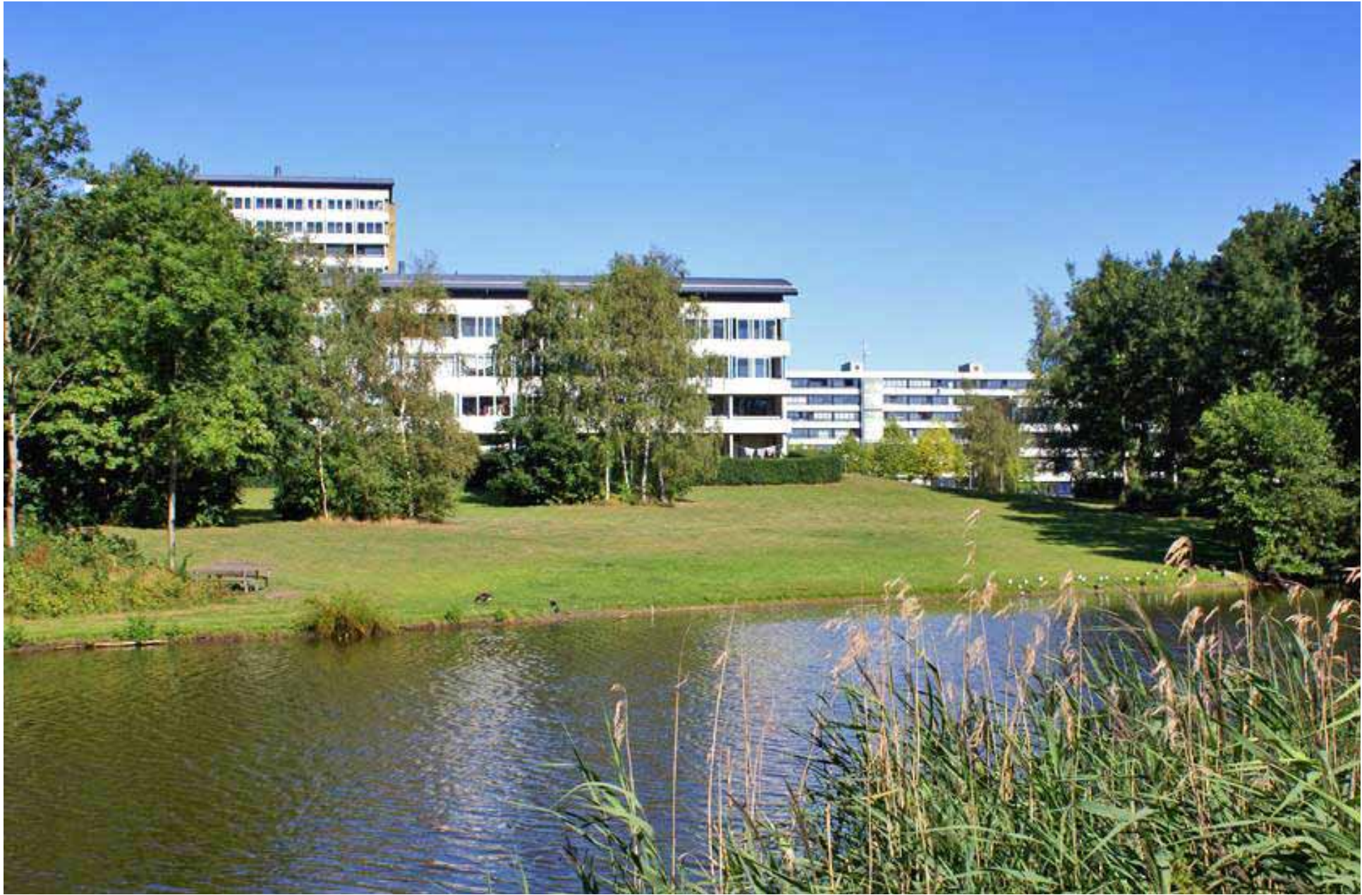
Vollsmose i Odense (1965-1980) er et af de store boligområder, hvor man tidligt søgte at gennemføre en bred og mangfoldig programindsats. Wikipedia.