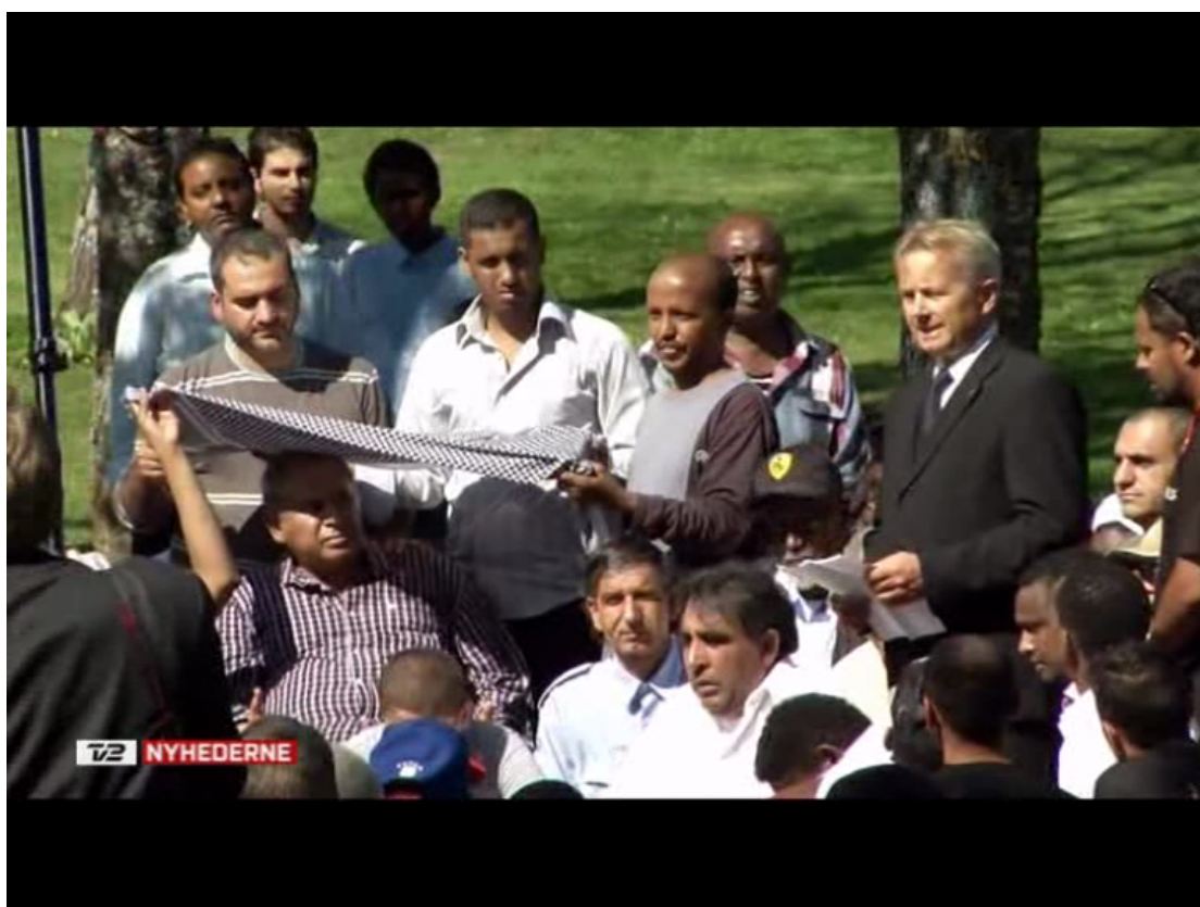
De to første billeder er fra den kristne