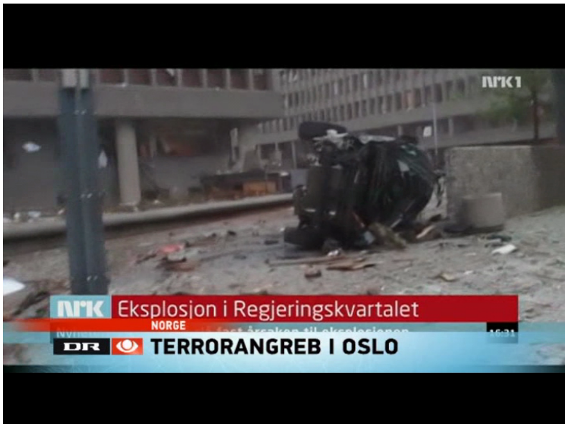
(Alle fire ovenfor gengivne bilder er framegrabs fra DR1/TV-Avisen 22.07.2011 kl. 21.00, o. 22:30 min)