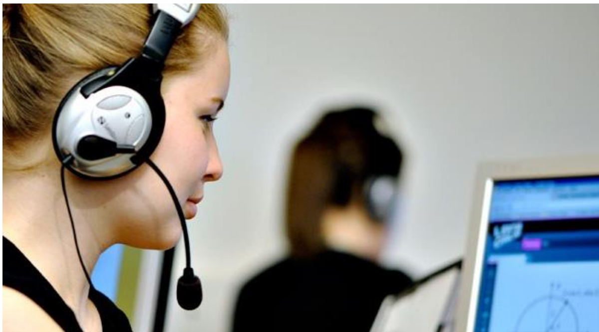
Fra en af Lektier Onlines hvervefoldere.

Som det fremgår, er vi her midt i en scene fra en af de mest populære former for frivillighed i Danmark: idrætsforeningen. Scenen er sat under åben himmel, ude i naturen, og der er lagt op til aktiv, opbyggelig, udendørs, gruppebaseret interaktion, på tværs af køn og etnicitet. Der er også lagt op til læring på tværs af generationer, hvilket den storsmilende unge mand indikerer, idet han instruktivt peger på en fodbold over for en gruppe af, ligeledes storsmilende, sportsklædte børn af begge køn fra forskellige etniske baggrunde. What's not to like? - kunne man retorisk, og lidt populært, spørge. Bogstavelig talt var det sådanne billeder, der havde formet mit syn på frivilligt arbejde. Billedgørelsen af den store kontrast, som Lektier Online repræsenterede i forhold til dette ideal, var projektets officielle hverveflyer, som jeg mødte flere gange undervejs i mit feltarbejde i både analogt og digitalt format: