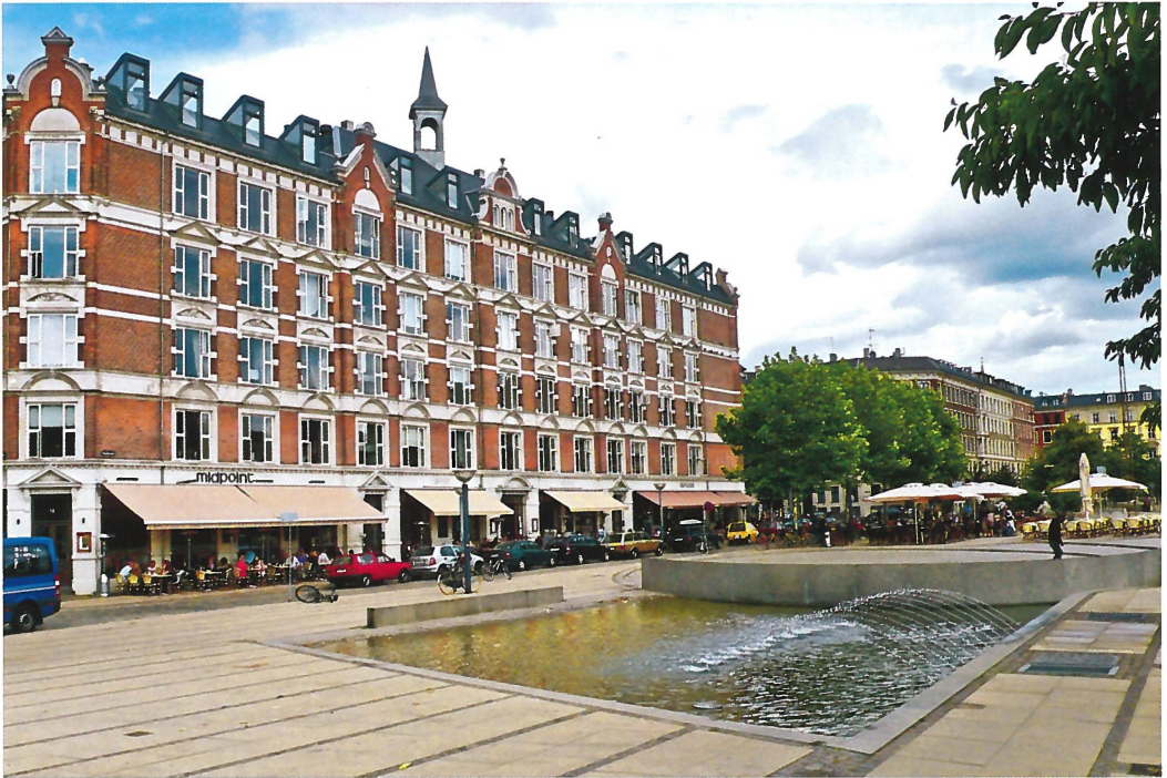
Fig. 1. Halmtorvet efter byfornyelsen.

Understøttet af Byfornyelsesloven af 1982, blev der lagt stor vægt på bevaring af de gamle huse. Men det blev også anerkendt, at byfornyelse ikke blot var et spørgsmål om boligkvalitet. I erkendelse af bydelens "tunge sociale problemer" havde planen som et helt centralt punkt også en "social dimension".