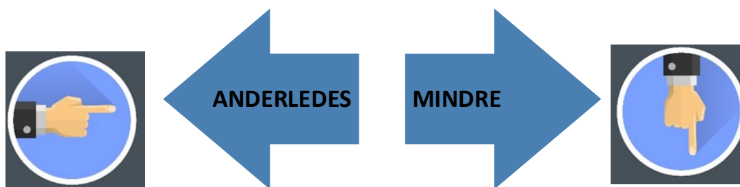
Figur 1. Forbrug anderledes overfor forbrug mindre.

Anskaffelse (køb) eller anvendelse (brug)?