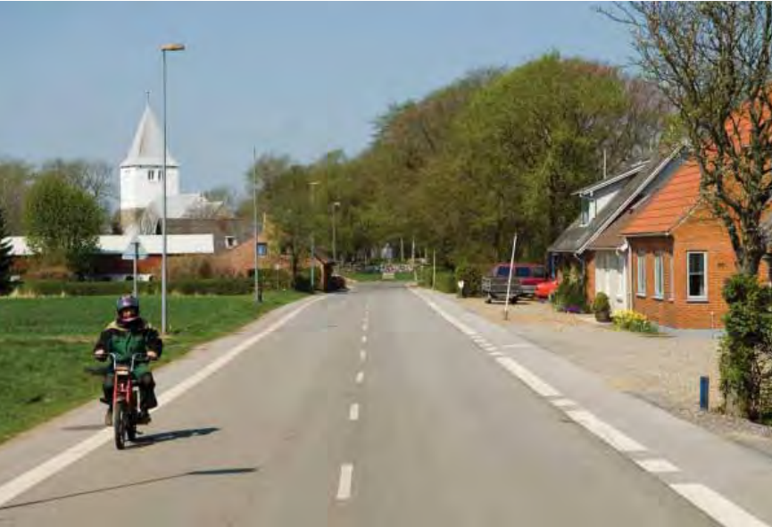
| Nors. Bymiljø omkring landevejen.

sådan, at jo mindre købstaden er, jo hurtigere møder man tilbagegangstegnene.