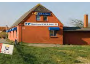
| Ydby. Traktørsted langs hovedvejen til salg.

Der findes op mod 60 mio. kvadratmeter overflødiggjorte landbrugsbygninger i Danmark. Da over halvdelen er umiddelbart bygningsmæssigt eller funktionsmæssigt kondemnable, er der et oplagt incitament for ejerne til, at de bliver fjernet, da der derved spares både på udgifter til vedligehold og forsikring. Det er imidlertid et problem, at nedrivningstrangen tilsyneladende