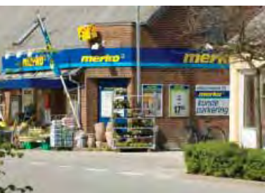
| Østerild. Dagligvareforretningen er en vigtig del af byens livsgrundlag.

Men selv hvis en sådan planlægning lykkes, vil det realistisk set stadig være sådan, at moderne og velfungerende landdistrikter og landsbyer vil være afhængig af, at langt størsteparten af de erhvervsaktive finder deres beskæftigelse i byerhvervene i de nærliggende større byer.