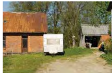
| Hørsted. Forfaldne landsbyhuse, der venter på nye kræfter.

Forfaldet og de fysiske problemer findes i alle landsbystørrelser og i størsteparten af landet. Og måske overraskende for mange også i ganske kort afstand fra større provinsbyer som fx Randers og tilsvarende byer. Det er dog vigtigt at fastslå som en generel tendens, at de fysiske problemer er større, jo længere man kommer bort fra provinsens købstæder. Ligeledes er det