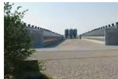
| Hørsted. Højt industrialiseret svineproduktion med ganske få ansatte, som pendler til arbejdspladsen.

Udviklingen i industri- og servicesektoren har indenfor de sidste 15-20 år ikke været gunstig for landsbyerne. Sammenfattende kan man sige, at landdistrikterne og landsbyerne i stor udstrækning er blevet tømt for arbejdspladser, hvilket tydeligt afspejler sig i deres fysiske fremtræden. De landbrugsrelaterede virksomheder,