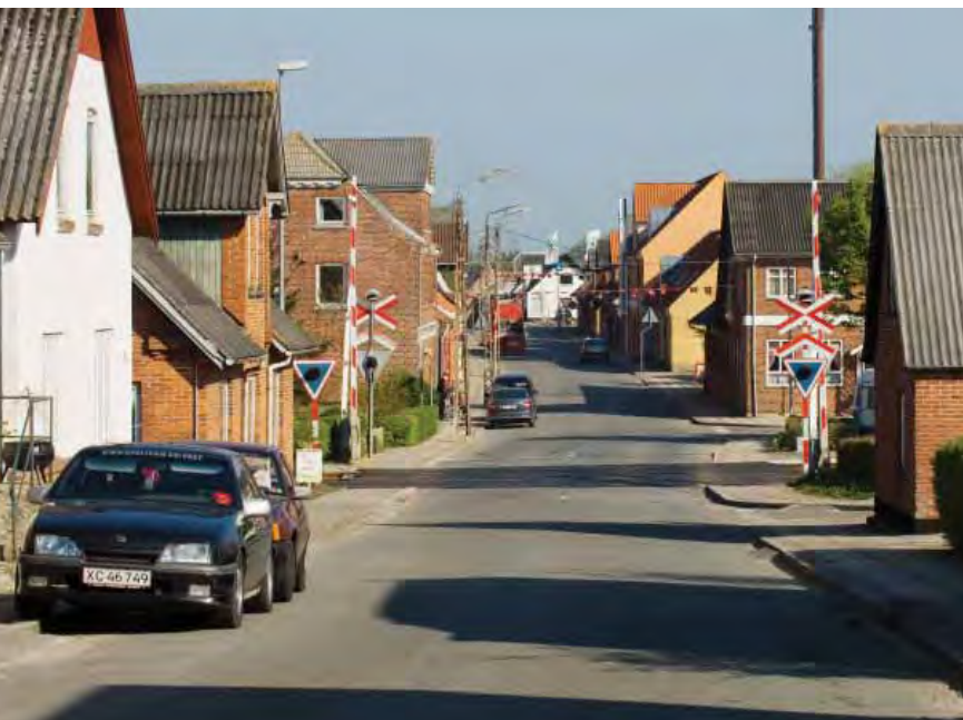
| Bedsted. Bymiljø omkring gaden og jernbanen.

Håndteringen af de dårligt vedligeholdte bygninger udgør et betydeligt, men ikke særlig anerkendt problem. Det samme gælder for landsbyernes hovedgader og offentlige rum. Også her er det påtrængende at få analyseret og diskuteret, hvad der kan stilles op med de ofte noget mistrøstige hovedgader, som ikke længere huser levende og fungerende fælles funktioner som brugs, bager, forsamlingshus eller andelsmejeri. En typisk landsbyhovedgade er i dag præget af funktionstømte butikslokaler, hvor facaden er ombygget uden særlig megen omtanke, og hvor mange af beboelseshusenes standard heller ikke understøtter gaderummets arkitektur.