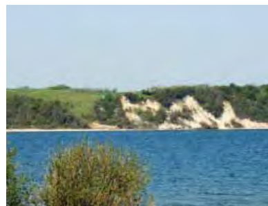
| Vilsund. Naturområde reguleret af arealorienteret planlægning.

Kulturministeren kan frede bygninger, som er over 50 år gamle. Uanset alder kan bygninger dog fredes, når det begrundes med særlige omstændigheder. I det omfang en bygnings umid-