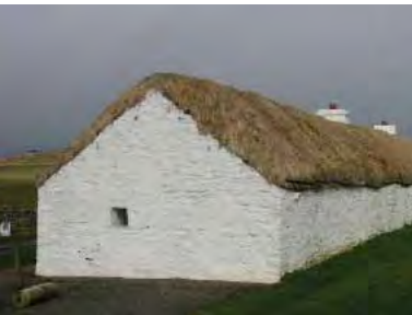
| Caithness. Traditionel bygningskultur på landet.

I modsætning til udviklingselskaberne er de lokale råd og styrelseres budgetter bestemt af det skotske parlament, der via indkomstskat overfører beløb til disse efter en beregningsmodel, der tager hensyn til lokalområdernes behov i form af diverse serviceforpligtelser. De lokale råd udskriver selv ejendomsskatter, men niveauet kontrolleres indirekte af det skotske parlament via udmeldte rammer. Endvidere inddriver de lokale råd virksomhedsskat. Men hovedparten af de