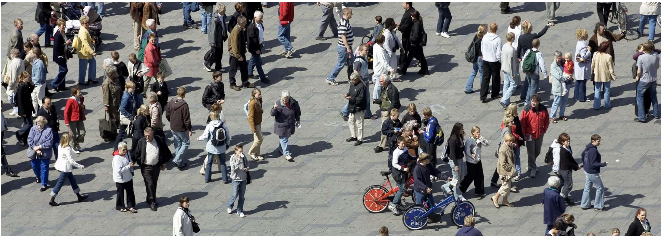
EGALITÆRE. Det typiske mønster i andre vestlige lande er, at man er mere tilbøjelig til at acceptere store lønforskelle mellem top og bund, jo højere uddannet man er. Men i Danmark er de højtuddannede faktisk de mest egalitære.