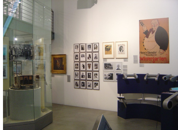
Udstilling af medier.