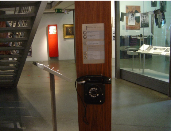
Telefon til kritiske røster fra fortiden.