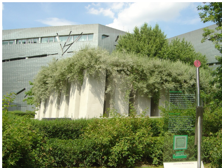
Garten des Exils set udefra.

Den anden akse fører til Garten des Exils, et kvadratisk udendørs rum forsænket i terrænet, hvor niogfyrre betonpiller hæver sig i vejret, hver bærende på en beplantning på toppen i form af buskads. De otteogfyrre af pillerne er fyldt med jord fra Berlin; den niogfyrretyvende og midterste er fyldt med jord fra Jerusalem. Tallet 48 skal henvise til det år, staten Israel blev oprettet. Grunden har en hældning på 10 %, hvorfor det er fysisk kompliceret at bevæge sig rundt mellem betonpillerne. Retter man blikket mod omgivelserne overrumpler man af terrænets hældning. Man er uafsladigt ved at miste balancen og orienteringen. Denne effekt ved haven forstærker samme oplevelse i kælderakserne, hvor gulvene også skræner, men mindre.