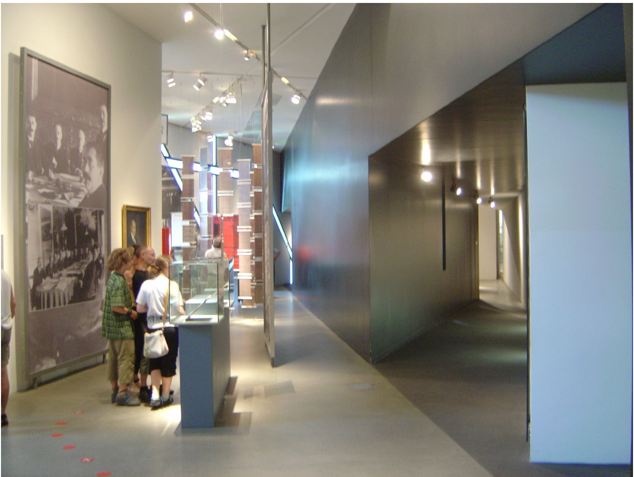
Parti fra den faste udstilling

Udstillingernes indhold er imidlertid bragt i tale gennem en række formidlingsmæssige tiltag, der nok er værd at hæfte sig ved. For det første er udstillingsrummene indrettet således, at de udstillede genstandes fylde er proportionerede i forhold til rummene, således at fx de tværgående eller mønsterdannende vinduesbånd danner baggrund for og indgår i samspil med de udstillede genstande.