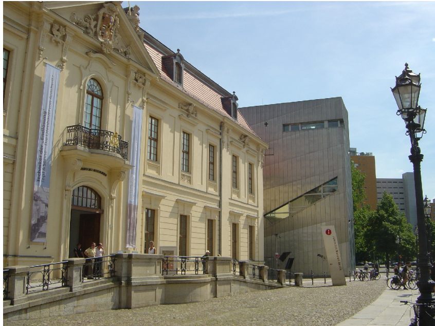
Collegienhaus med annekts i baggrunden.