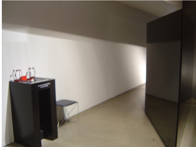
Kontakt til fortiden.

Etableringen af tomrum i museets arkitektur tilføjes yderligere en dimension i kraft af en anden type rum i udstillingen.