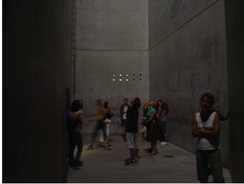
I Holocaust Turm.

Den anden akse fører til Garten des Exils, et kvadratisk udendørs rum forsænket i terrænet, hvor niogfyrre betonpiller hæver sig i vejret, hver bærende på en beplantning på toppen i form af buskads. De otteogfyrre af pillerne er fyldt med jord fra Berlin; den niogfyrretyvende og midterste er fyldt med jord fra Jerusalem. Tallet 48 skal henvise til det år, staten Israel blev oprettet. Grunden har en hældning på 10 %, hvorfor det er fysisk kompliceret at bevæge sig rundt mellem betonpillerne. Retter man blikket mod omgivelserne overrumpler man af terrænets hældning. Man er uafsladigt ved at miste balancen og orienteringen. Denne effekt ved haven forstærker samme oplevelse i kælderakserne, hvor gulvene også skræner, men mindre.