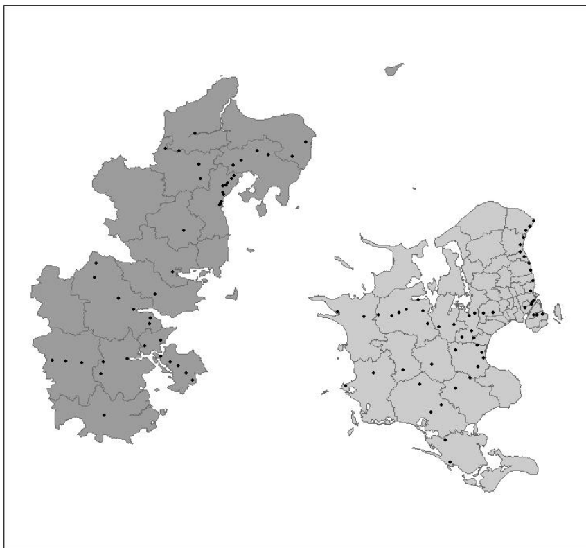
Figur 1. De to regioner; Østjylland (gråsort) og Sjælland (gråhvid), med indtegnede regionale togstationer.