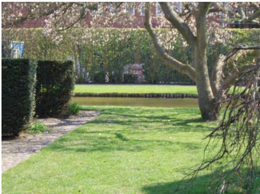
Bag de høje hække i Kongens Have sker der bl.a. handel med stoffer.

På Skt. Hans Plads ligger Skt. Hans Kirke samt Marie Jørgensens Skole. Mellem kirken og skolen er der en parkeringsplads, som bl.a. benyttes af skolebørnernes forældre og kirkegængere. Der har været klager fra skolebørnernes forældre