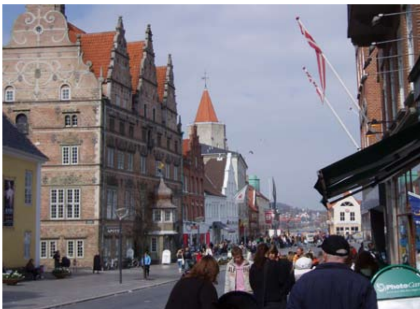
Bispensgade og Nytorv er stedet, hvor man mødes og fortsætter ud i byen. Nytorv er regionalt trafikknudepunkt - her stopper mange regionale busruter.

disse episoder kan bidrage til at skabe utryghed hos andre brugere. De interviewede brugere oplever dog ikke Bispensgade som utryg. Gaden har god belysning, og der er desuden lys i butikkerne uden for normal åbningstid. Dog påpeges, at der er et par smalle stræder eller nicher, hvor folk kan gemme sig, og dette kan opleves som utrygt.