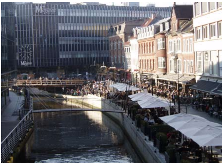
Ved Vadestedet ligger cafeer og restauranter side om side.

"utryghedsskabende unge". Hvis man tager højde for, at der færdes mange mennesker i området, er forekomsten af kriminalitet lav. Brugere beskriver området Vadestedet - Skt. Clemens Torv/Bro, som et trygt område og som "gode steder" at opholde sig.