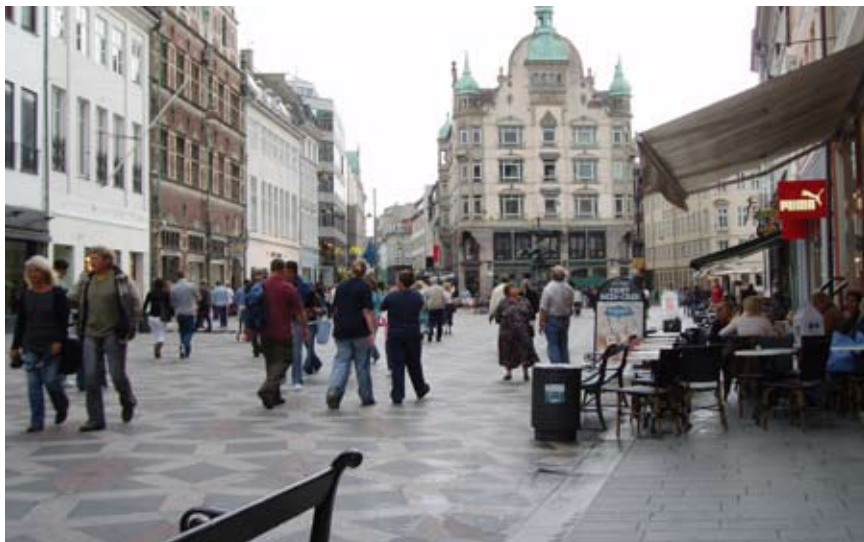
På Strøget og Amager Torv er der mange mennesker. De tætte butiksstrøg trækker mange til - også de der begår kriminalitet så som f.eks. tyveri og røveri.

Amagertorv i København er et mødested. Der er et mangfoldigt byliv med optræden og mange andre aktiviteter. Amagertorv er et sted med cafeer, som appellerer til de unge, så det er her man mødes. Amagertorv er også et sted, hvor der er mange forretninger og hvor der kommer mange turister. Der samles en masse folk, hvilket tiltrækker personer som begår kriminalitet som tyverier, røverier og gaderøverier. Vold forekommer senere på aftenen især i forbindelse med, at folk går fra værtshusene og skal op mod Rådhuspladsen og hjem via natbusser eller op til hovedbanegården og have toget hjem. Denne problematik gælder hele Strøget. Det er berusede mennesker som typisk laver vold og det sker mellem personer som kender hinanden i forvejen eller som har mødt hinanden i løbet af aftenen. De personer, der er blevet interviewet på Amagertorv, har alle det til fælles, at de føler sig trygge på stedet, uanset tidspunkt på døg-