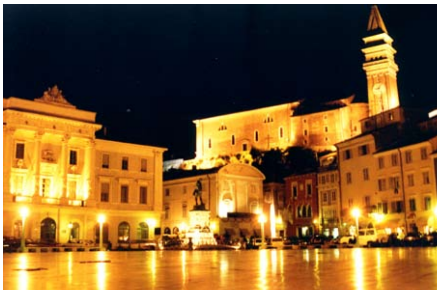
Den gode plads. Her Piran i Slovenien.

er mangfoldige, multikulturelle og fleksible, som kan imødekomme forskellige brugeres behov og give mulighed for vekslende aktiviteter. Det indebærer, at brug og brugere skifter, hvilket er attraktivt for nogle, men kan skabe utryghed for andre.