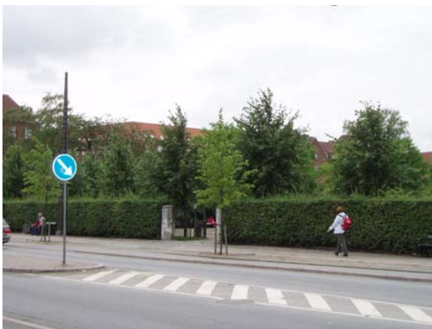
Høje træer, tætte buske og steder som er uoverskuelige skaber utryghed fordi man frygter, at nogen kan ligge gemt bag en busk. Her Enghaven i København.

trygheden, og manglende vedligeholdelse, f.eks. affald, der ligger og flyder, ødelagte bænke, smadrede ruder, hærværk, graffiti og andre tegn på kriminalitet, føles utrygt. Øde områder og små gader uden mennesker opleves også som utrygge.