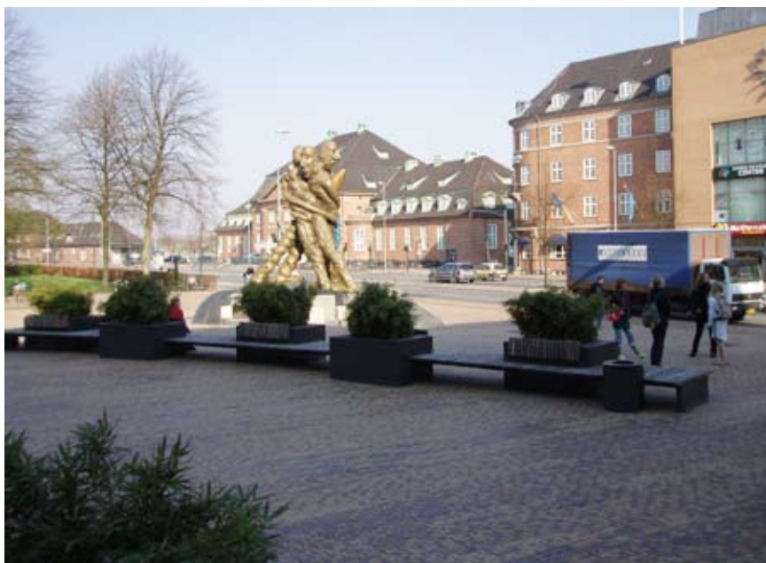
Banegårdspladsen fungerer mest som et transitrum.

af den rejsende H.C. Andersen i Bjørn Nørgaards fortolkning. Under pladsen er en parkeringskælder. Området fungerer primært som transitrum og til kortvarigt ophold, for eksempel når folk stopper op for at læse vægavisen på Fyens Stiftstidendes nye mediehus. Brugere føler sig generelt trygge ved at færdes både på Skt. Hans Plads og på Banegårdsplads.