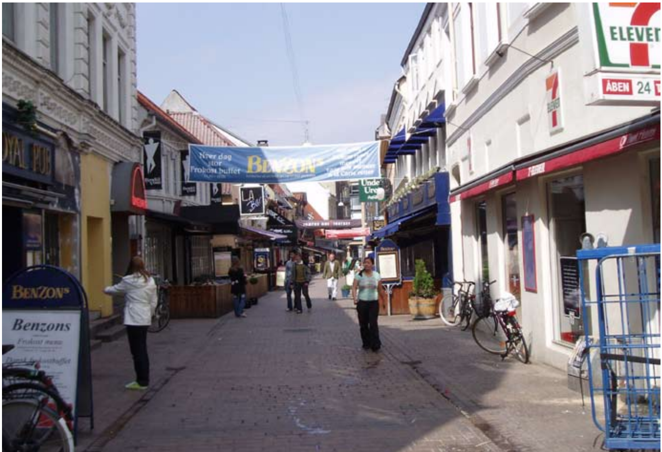
“Gå i byen steder” er ofte populære, men ikke for alle. Der opstår konflikter, når beboernes ønske om fred og ro ikke kan forenes med det fest- og natteliv, som de omkringliggende funktioner indbyder til. Her Jomfru Ane Gade i Aalborg.

af individualitet samt forskellige og skiftende behov.