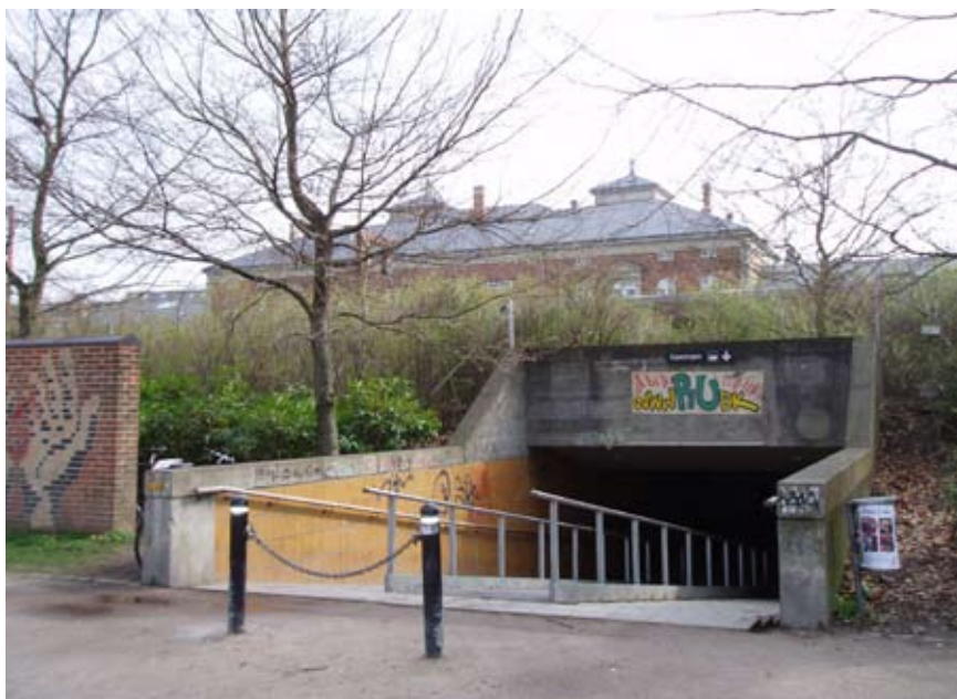
Den mørke tunnel er knudepunkt mellem Kildeparken og banegården i Aalborg. Om dagen er trafikken stor, men om aftenen er der øde og for nogen føles det utrygt at gå gennem tunnelen.

Brugerne føler sig generelt trygge ved at færdes i byen og i de undersøgte byrum, og en af de vigtigste grunde er et personligt kendskab til stedet. Samlet peger de interviewede brugere på, at der er stor forskel på at færdes, når det er lyst hhv. mørkt og at mørket alene giver en følelse af utryghed. Nogle ældre kvinder giver udtryk for, at de helt holder sig hjemme efter mørkets frembrud, og generelt er de interviewede kvinder mere utrygge efter mørkets frembrud sammenlignet med mændene.