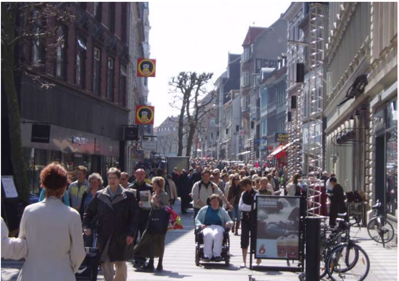
Byernes succes indebærer et øget brug af byns forskellige steder og byrum. Det betyder større slid og forudsætter løbende vedligeholdelse, istandsættelse og fornyelse. Her Søndergade - Strøget i Århus.

De mange funktionsblandede byrum indfrier målet om, at byrum principielt indrettes til almenvællets brug. Alligevel har man som byplanlægger ofte bestemte brugere i tankerne og nogle steder arbejder man bevidst på at lave byrum, som appellerer til udvalgte grupper. For selvom det overordnede mål er at lave fleksible, mangfoldige og multikulturelle byrum, er det svært at skabe "fælles rum" i en tid præget