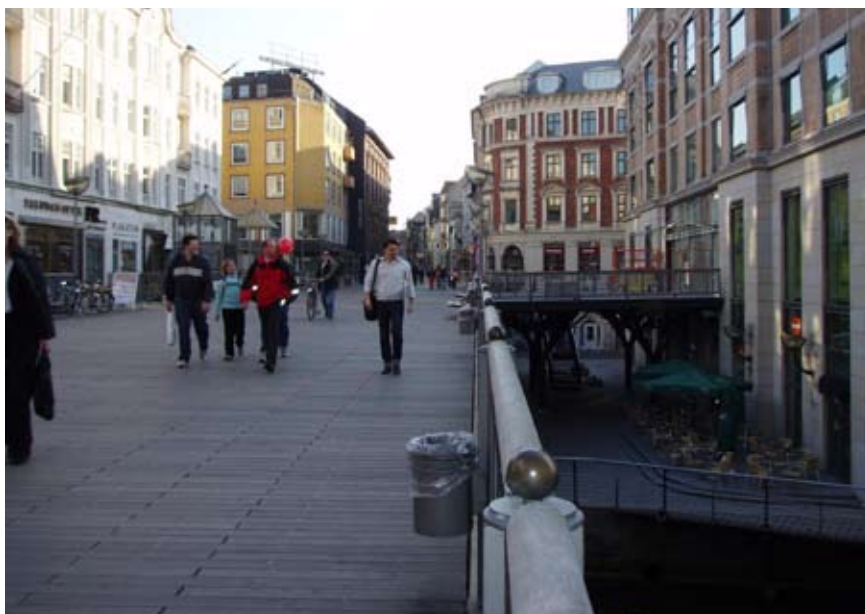
Fra Clemens Bro kan man overskue bylivet ved åen, men man kan ikke se, hvad der sker under broen, og det afholder mange fra at gå der.

I forbindelse med frilægningen af Århus Å i slutningen af 1990'erne, blev der på strækningen Immervad - Skt. Clemens Torv, skabt et særligt byrum kaldet Vadestedet. Vadestedet huser en lang række restauranter og caféer, og der er lagt stor vægt på mulighed for udeliv om sommeren. Stedet tiltrækker både turister og byens borgere. Publikum skifter flere gange i døgnet: om dagen er det forretningsfolket der spiser frokost, om aftenen er det de unge familier, der spiser aftensmad, derefter følger de universitetsstuderende, som drikker en café latte eller en fadøl. Ved 22-tiden går de studerende hjem og den lidt mere "hardcore" brugergruppe overtager. Det er også først efter klokken 22 og 5-6 timer frem, at der opstår problemer. Fra slutningen af maj måned og til slutningen af juni måned samt fra midten af august og frem til slutningen af september, er politiet særligt opmærksomme på området, da