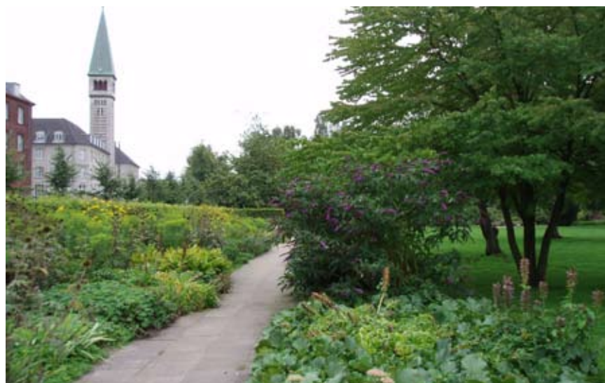
Enghaven er en grøn oase i byen, men alligevel et sted som nogle brugere undgår

ges parken af grupper af unge, som aftaler at mødes i parken. Der sker ofte hærværk og der kommer folk med store kamphunde, som arrangerer slagsmål i parken. Der er hashhandel med livlig trafik af købere og sælgere. I forbindelse med musikstedet Vega, der ligger lige ved parken, opstår der ofte ballade. Det liv, der leves i parken om aftenen, giver lokale beboere stor utryghed. I umiddelbar nærhed til Enghaveparken findes Enghaveplads, som primært bruges af øldrikkere, som kommer der hver dag. Pladsen er delvist afskærmet af et cirkelformet hegn, og rimelig godt skjult for forbi-passerende. Enghaveplads beskrives som et trygt sted om dagen, mindre trygt om aftenen.