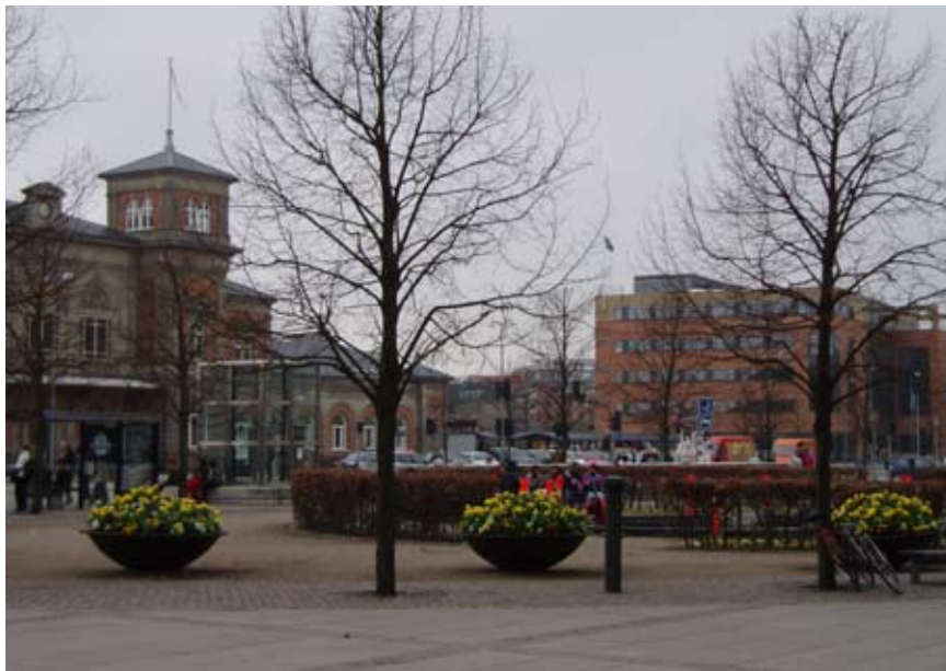
Kennedy Plads er primært opholdssted for byens udsatte grupper.

Bispensgade er en aktiv strøggade med specialforretninger, caféer og et pulserende folkeliv. Bispensgade er et sted man slentrer, shopper, "ser" og oplever byen. En sidegade til Bispensgade er Jomfru Ane Gade med mange restauranter og diskoteker, populære steder, som de unge flittigt besøger. Jomfru Ane Gade og strøget gennem