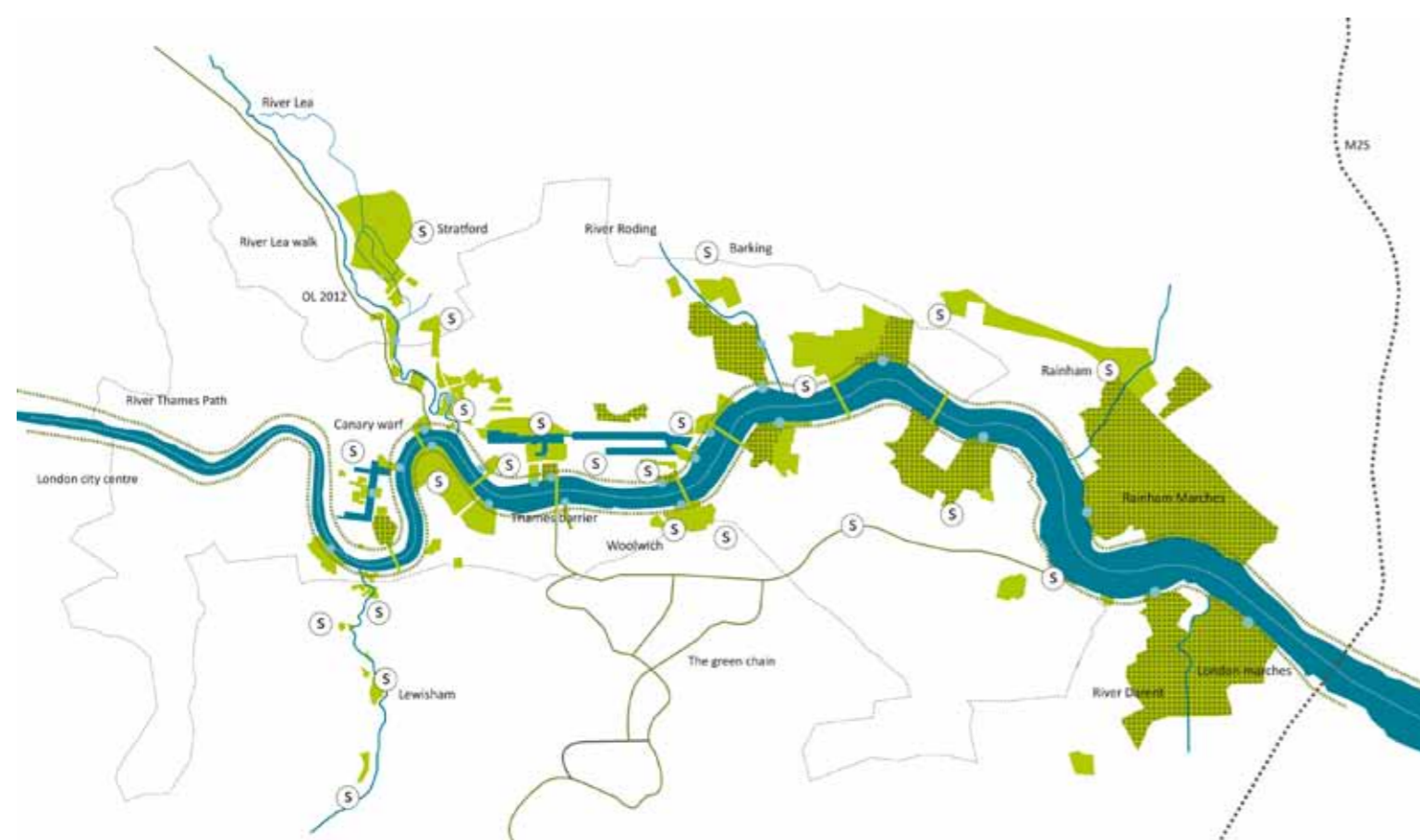
Udviklingsområdet i London Thames Gateway

eringen af Urban Agriculture ikke kun drevet af nødvendighed, men også af et globalt budskab – et budskab, der ikke kun vedrører de enkelte storbyer, men hele verdens befolkning og klodens fremtid.