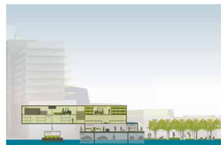
Snit - Hydroponic growing

London Arena er udvalgt som case for en detaljeret bearbejdning og er et udviklingsområde af høj prioritet. Det er placeret i den vestlige del af LTG, tættest på Londons centrum. London Arena (2,0 ha) er placeret på the Isle of Dogs i et af Londons tættest bebyggede områder. Området er omgivet af kontorbyggeri i nord og beboelseskomplekser i syd, varierende i højden fra 4 til 30 etager. Når landbrugsproduktions-arealer lægges til de øvrige programmer i London Arena (7,5 ha beboelse, 2,6 ha kontorbebyggelse og 2,0 ha hotel og fitness) vil den samlede bebyggelsestæthed for området nå op på 800 %. Netop pga. den høje bebyggelsesprocent er fødevarerproduktionen i London Arena baseret på "hydroponic growing". 9 Det er en dyrkningsmetode, hvor planter dyrkes i næringsvæsker, uafhængige af adgang til jord. Denne dyrkningsmetode gør det muligt at implantere