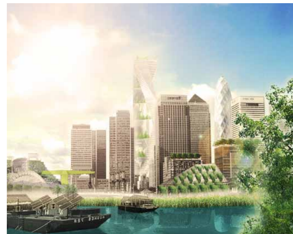
Alle illustrationer er fra projektet Urban Agri_Polis