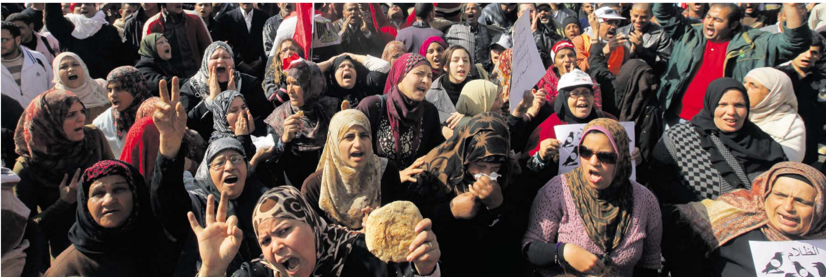
UTILFREDSHED. Der er mange demonstrationer i Egypten – både for og imod den siddende præsident, Mohammed Morsi. Den spændte stemning på gaden afspejler stemningen i de politiske cirkler, hvor der også spekuleres i Morsis fremtid.