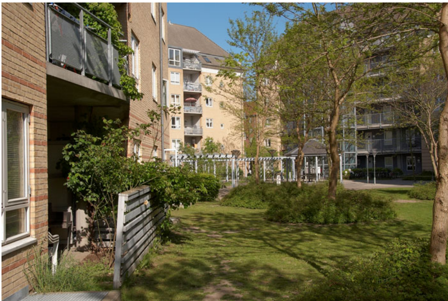
Figur 2 Gårdmiljø i etagehusdelen