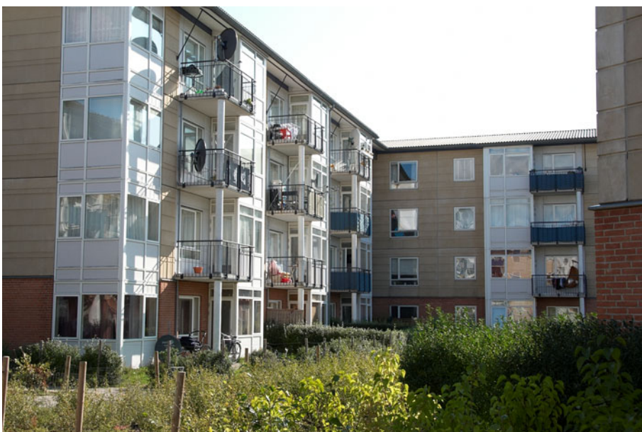
Figur 10 – Bagsiden af Utterslevhuse med altaner og mindre grønne områder.