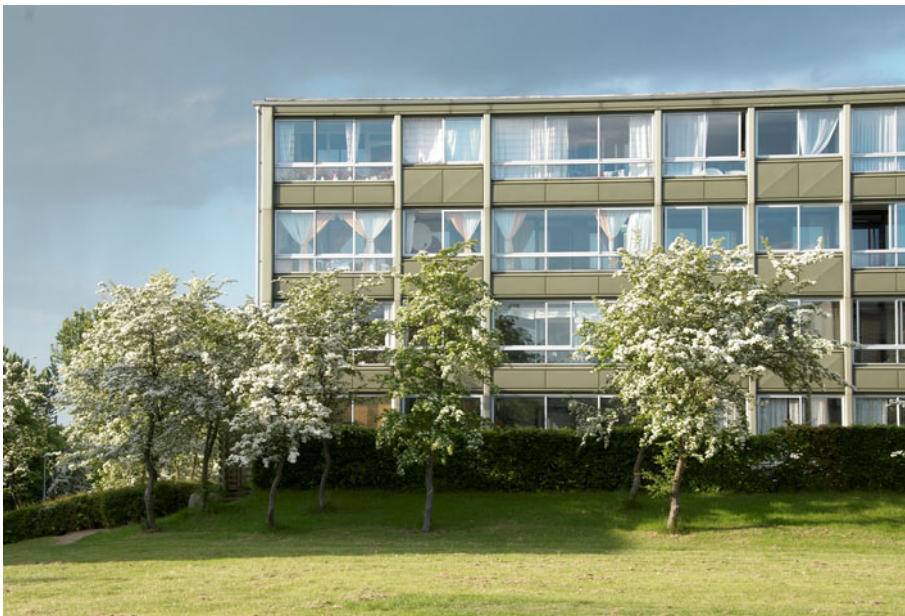
Figur 12 Altanside facade - med blomstrende tjørn