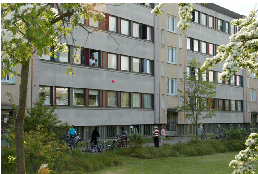
Figur 13 - Indgangssiden