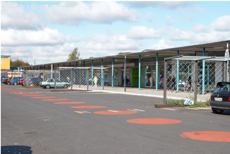
Figur 8 – Den centrale indkøbsarkade i Tingbjerg