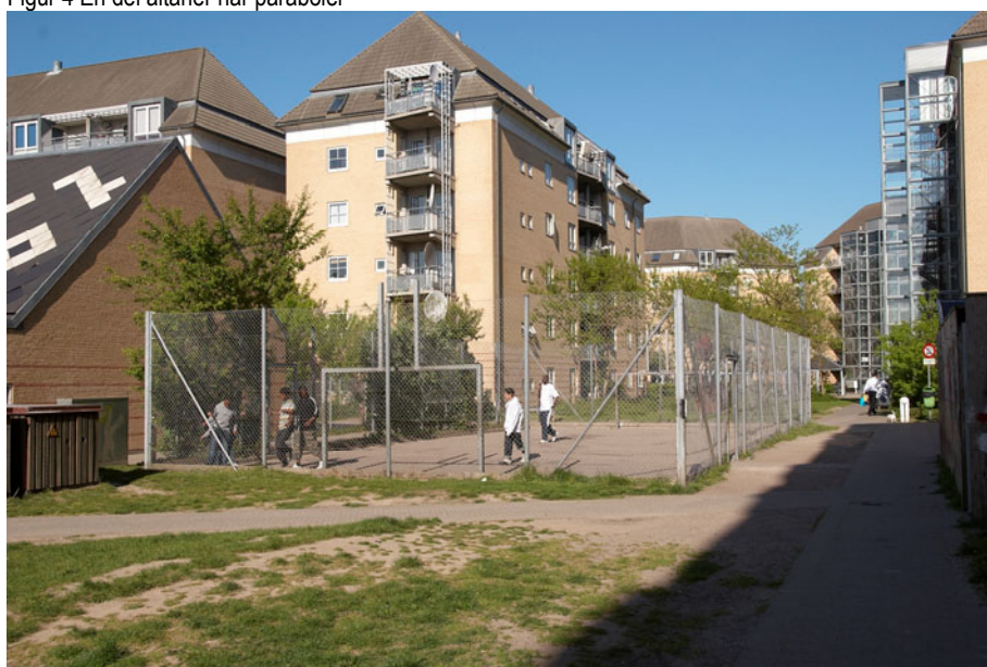
Figur 5 Boldbur til de unge - bruges flittigt