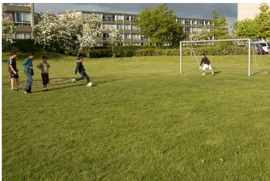
Figur 15 - Der er god plads til udendørs liv og boldspil i Rosenhøj