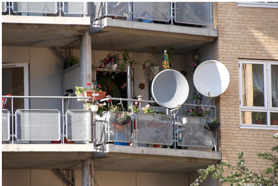
Figur 4 En del altaner har paraboler