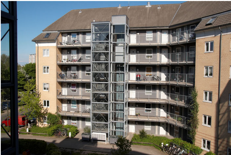
Figur 1 Indgangssiden i etagebebyggelse med altangange og elevator/trappe/affaldsskakt..