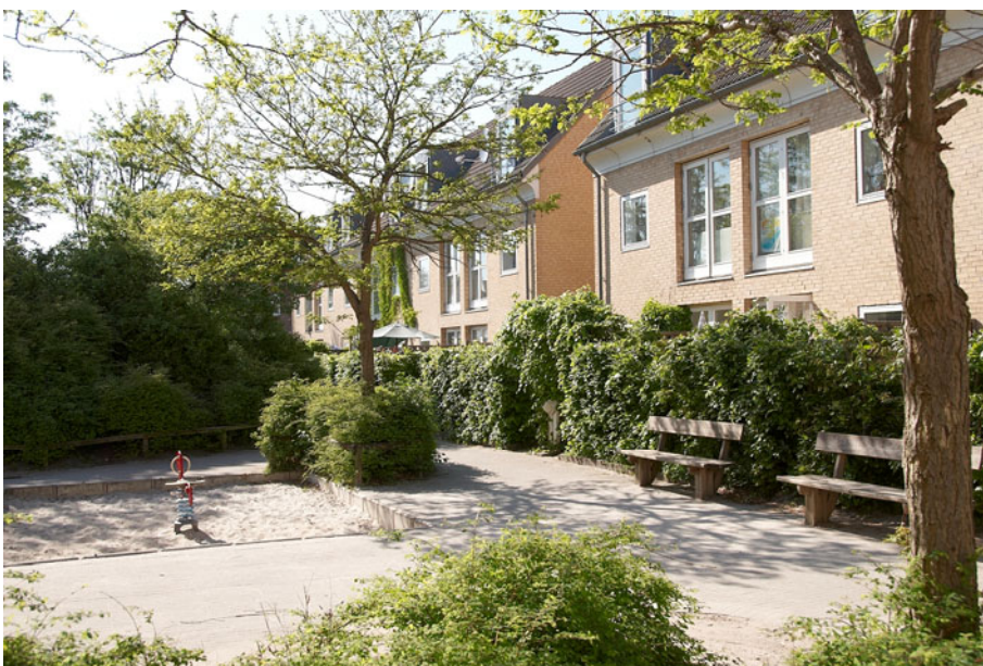
Figur 3 Gårdmiljø i rækkehusdelen