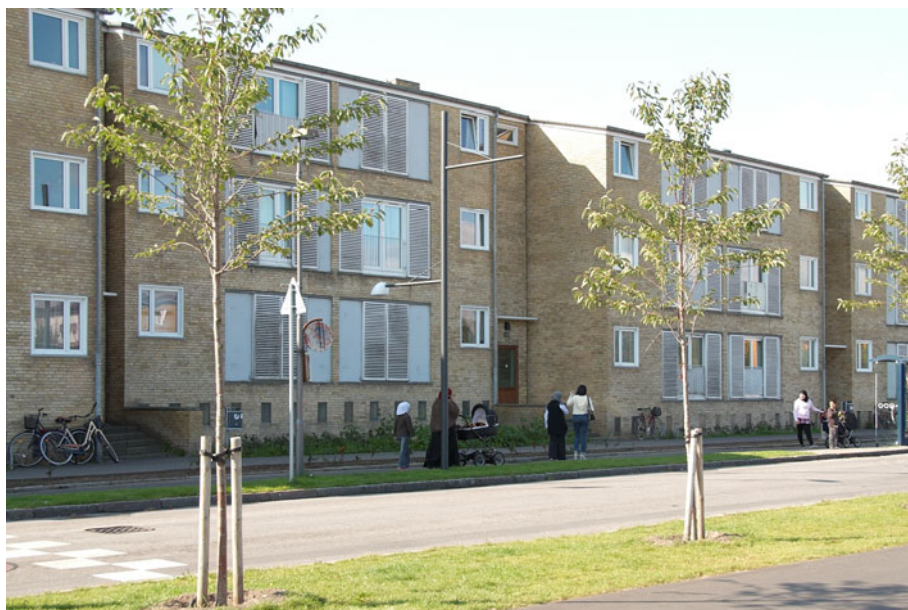
Figur 6 – Tingbjergs boliger set ude fra hovedgaden "Ruten". Her ses byggeriets karakteristiske gule mursten og hvide skodder.

Begge områder har større græsarealer, der forbinder områderne og fungerer som store gårdarealer, men de har også mindre afgrænsede opholds områder og legepladser. (se billeder)