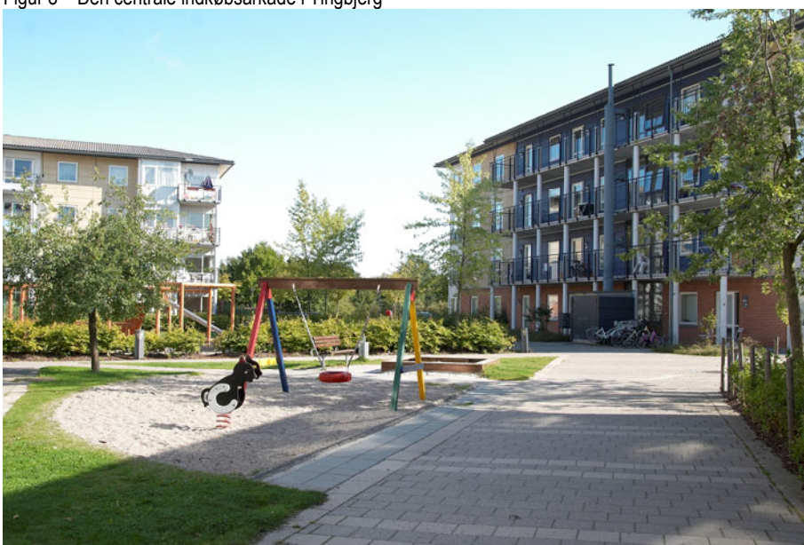
Figur 9 – Utterslevhuse har en væsentlig anden karakter end Tingbjerg.