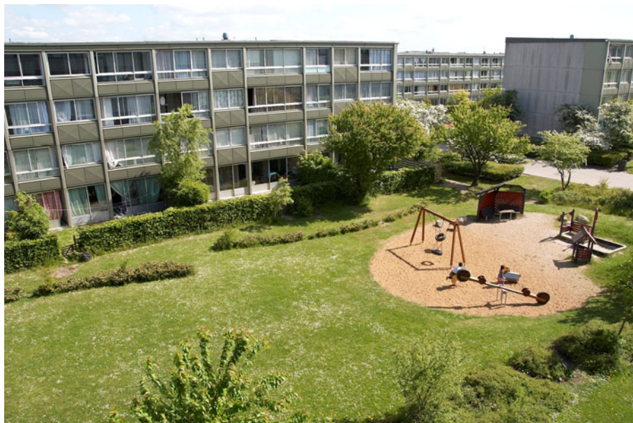
Figur 14 - Grønne udearealer og legeområder