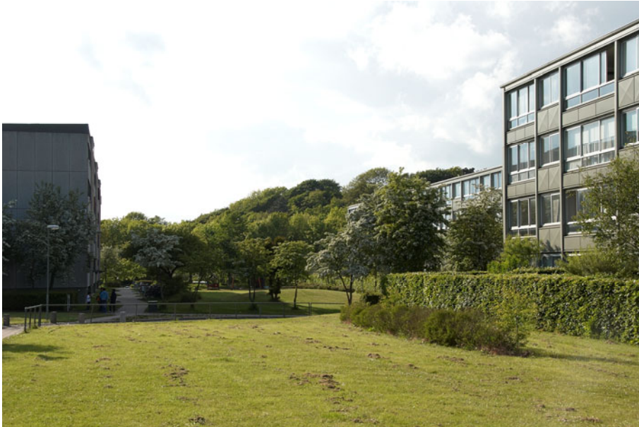
Figur 11 - Altansiden med grønne områder