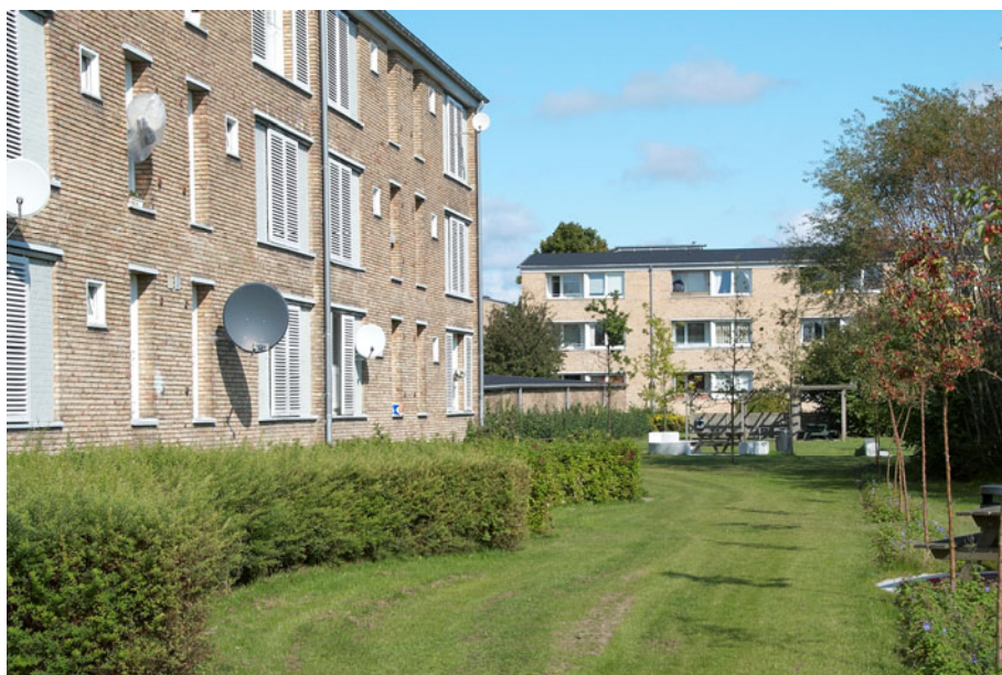
Figur 7 – Tingbjerg set fra bagsiden, med mindre grønne gårdområder med bænke.