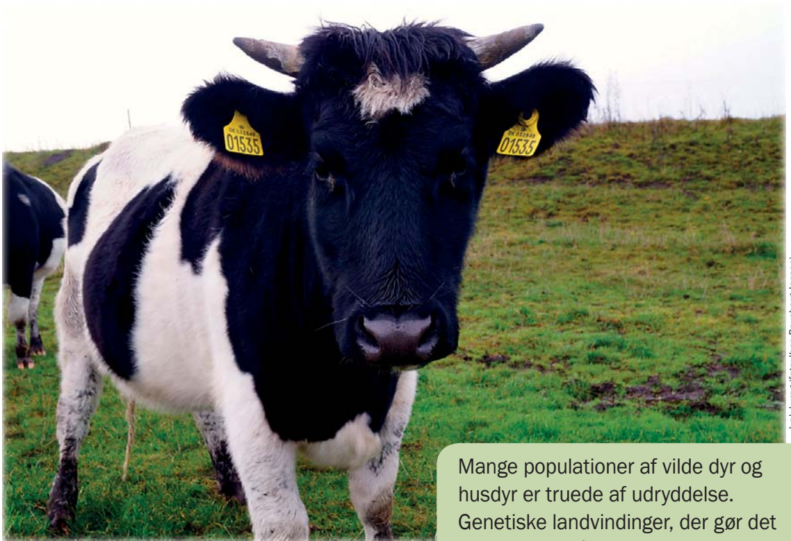
Jysk kvæg