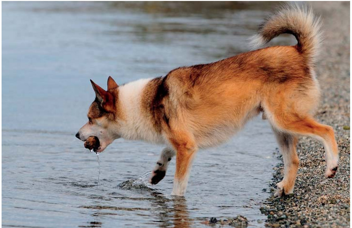
Den norske lundehund.