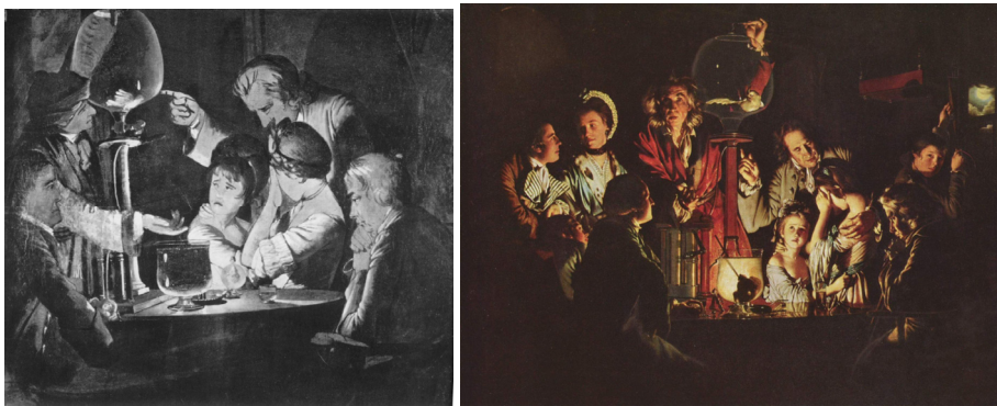
Joseph Wright of Derby: An Experiment on a Bird in the Air Pump (1767 og -68).

Argumentet kommer let til at fremstå som en raffineret udgave af “tante Tillies dragkiste-argument” (kapitel 10), dvs. argumentet om, at vi skal bevare alle arter, fordi vi en dag kan tænkes at få interesse i dem – eller måske ligefrem skal bestræbe os på at få en interesse i dem. Hvis argumentet nøjes med at hævde, at der skal sikres muligheder for at opnå tilfredsstillelse, så er det ikke særligt stærkt. I hvert er der ingen grund til at bevare arter frem for alle andre ting og sager, som potentielt kan have interesse. Forskernes subjektive interesser må konkurrere med andre slags fornøjelser om samfundets begrænsede midler. Desuden gælder, at der selv med en radikal indskrænkning af diversiteten vil være rigeligt tilbage at tage fat på. Argumentet bliver først plausibelt, hvis det samtidig antages, at den videnskabelige interesse er forbundet med en værdi, som ikke kan reduceres til subjektive tilstande. Der vil være to veje at gå.