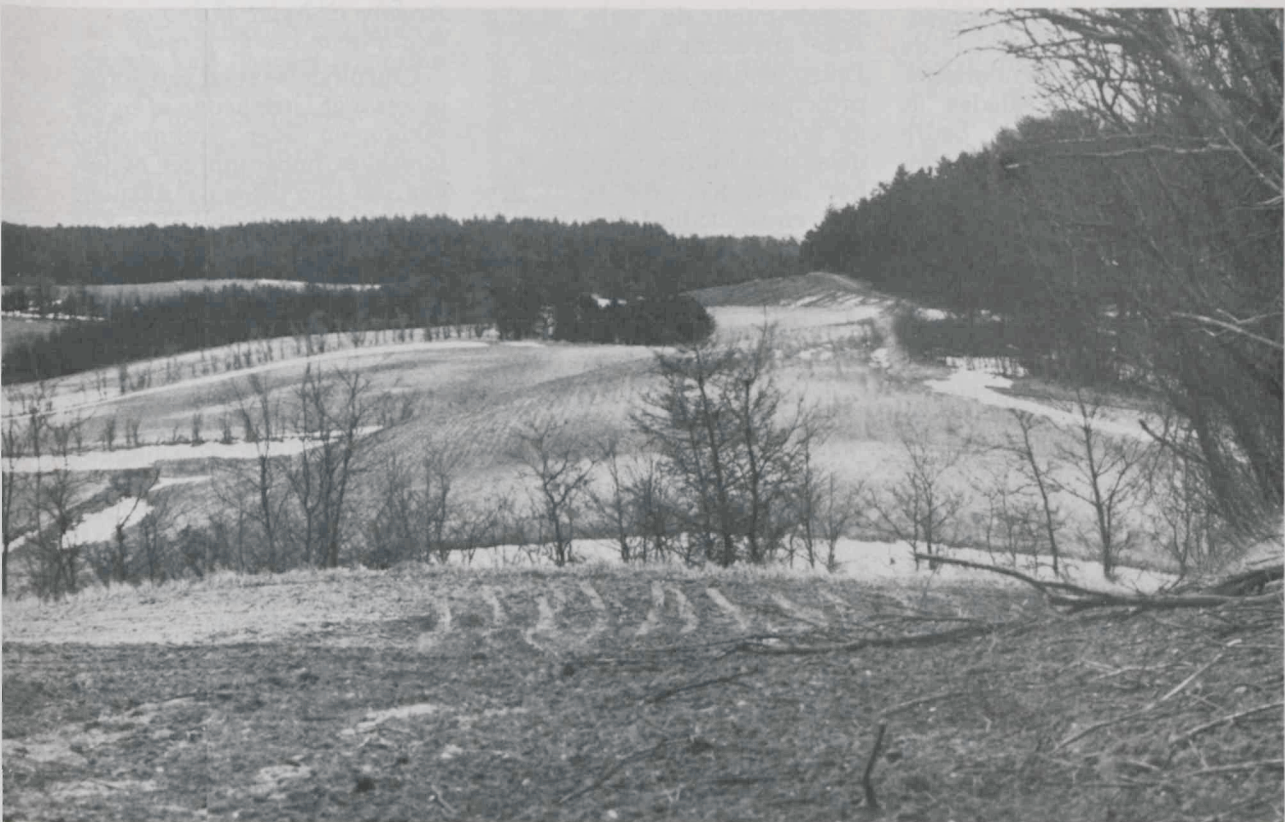
Læplantning i forbindelse med jordfordeling vil kunne foretages på grundlag af en ajourført arronderings- og ejendomsstruktur..

for læplantning og anden form for tilplantning.