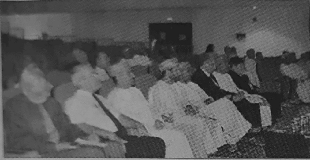
■ حضور افتتاح الحلقة