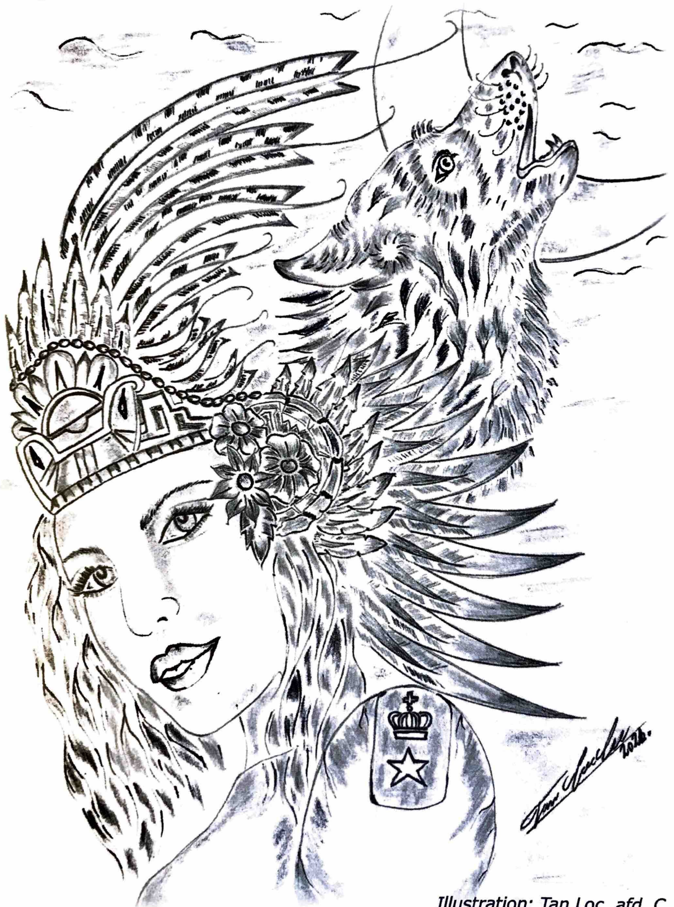
Illustration: Tan Loc, af. C

Nyheder fra Enner Mark Fængsel, juli 2021