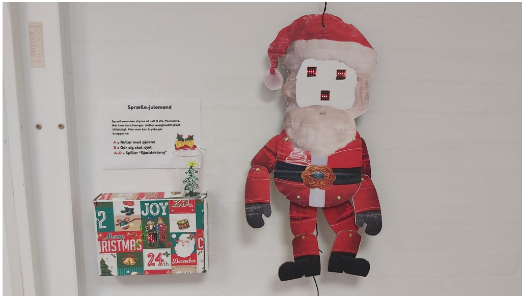
Figur 3 – Interaktiv sprællejulemand