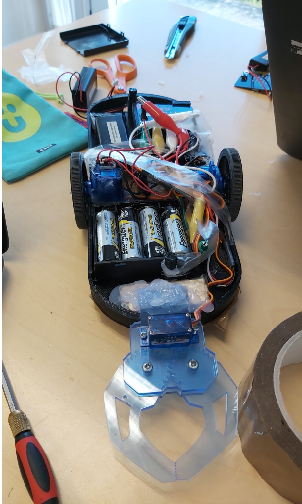
Figur 1 – Mars Rover