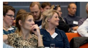
UNDERVISNINGENS DAG (2016-19)