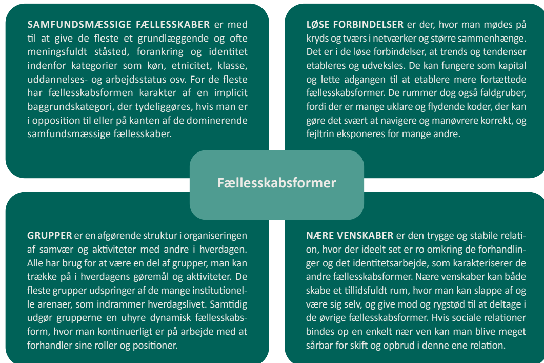
Figur 3. Fællesskabsformer i ungdomslivet

Det lægger med afsæt i Bruselius-Jensen et al (2023) op til en differentiering mellem de forskellige former for fællesskaber – 'samfundsmæssige fællesskaber', 'løse forbindelser', 'grupper' og 'nære venskaber' – der fylder og er tilbøjelige til at virke ind på unge og deres liv på forskellige måder. Det illustreres i figur 3