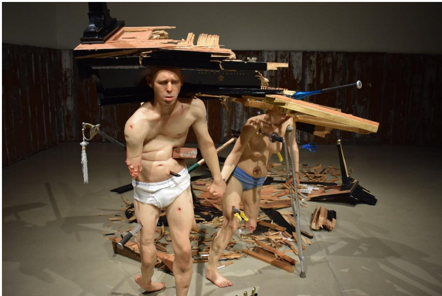
Figur 2: Kunstværk: Fucked (Couple) af Tony Matelli.

'Fucked Couple' udgøres af to voksfigurer i menneskestørrelse, en mand og en kvinde. Begge er sårede på snart sagt alle lemmer. Et baseballbat har kløvet kvindens hoved, hun mangler halvdelen af sit venstre ben, og der ses sår og rifter mange steder på hendes krop. Manden mangler et stykke af sin højre arm og har ligeledes sår, rifter og også knivstik på kroppen. I baggrunden ligger et flygel, der er gået i tusinde stykker. Noget af flyglet har ramt de to personer, og der er blodstænk mange steder på deres kroppe.