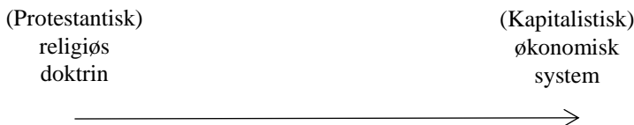
Figur 1 - Makro-niveau relation. Metodologisk holisme