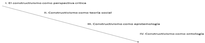
Figura II: Posicionamientos dentro del constructivismo social según Wenneberg (2000). Elaboración propia.