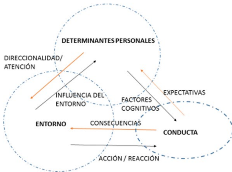
Figura III: Esquema de la determinación recíproca triádica a través de la interrelación de factores intrapersonales, conductuales e influencias del entorno.

produzcan una conducta o efectos comportamentales determinados. Tras esta explicación, pudiera parecer que el yo o los factores personales jugaran un papel reactivo ante la influencia de factores externos. No es este el caso; El yo, como entidad socialmente constituida, ejerce, a su vez, influencia en el medio y, de esta manera, la agencia humana opera de forma generativa y proactiva (Bandura, 1986, 1989, 1999).