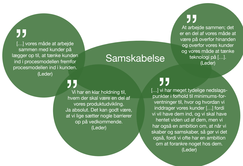
Figur 1, illustration af udsagn om samskabelse, interviews med ledere fra den digitale branche, interviewet af Sophie Lanng Gulstad, 2021.

De fleste ledere vil nok mene, at de har en strategi vedrørende samskabelsesprocesser; at de har truffet en strategisk beslutning om, hvorvidt virksomheden skal gøre brug af dette eller ej. Ikke mindst, at de i så fald har indsigt i, hvordan disse faciliteres og efterfølgende implementeres. Hos de tre virksomheder tegner der sig et tydeligt billede af, at samskabelse er hele fundamentet for virksomhedernes kerneforretninger; det er udgangspunktet for opgaveløsningen at samskabe med kunderne. Dette eksemplificeres i nedenstående udsagn, der alle kommer fra medarbejdere i ledende positioner. I udsagnene fremgår det ligeledes, at der stilles krav til, hvem der samskabes med.