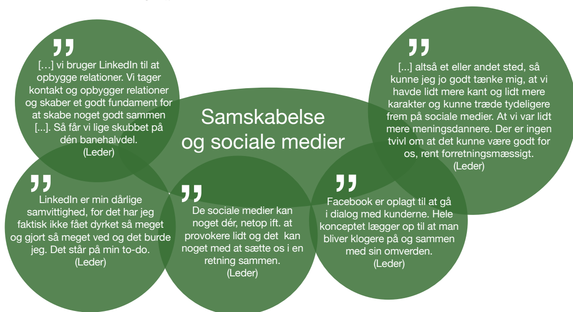
Figur 2, illustration af udsagn om samskabelse og sociale medier, interviews med ledere fra den digitale branche, interviewet af Sophie Lanng Gulstad, 2021.

Sociale medier nævnes også som en del af denne tankegang omkring samskabelse. Herunder fremhæver de interviewede ledere Facebook og LinkedIn, som værdiskabende for virksomhedens samskabelsesprocesser samt generelle digitale tilstedeværelse (eller mangel på samme).