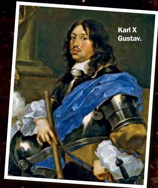
Karl X Gustav.