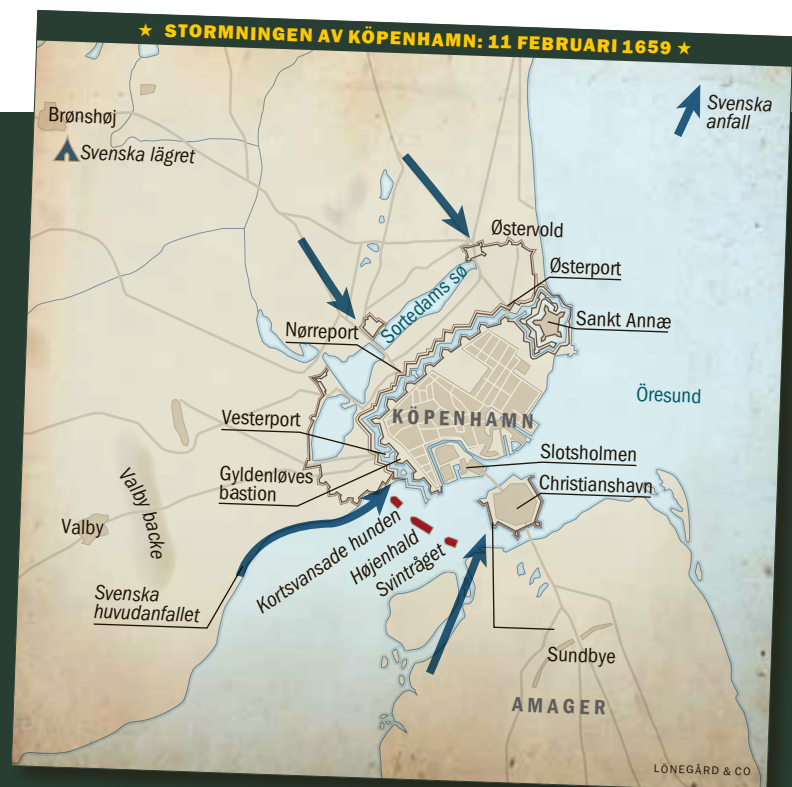
Vid stormningen skedde avledningsanfall mot Nørreport, Østerport och Christianshavn, innan huvudanfallet inleddes mot Slotsholmen.

Många historiker har hävdad att Kristian IV var en usel fältherre som inte hade något som helst begrepp om krigföring och militär strategi, men om det inte vore för hans förstärkningar av Köpenhamns försvar är det inte säkert att den danska huvudstaden hade motstått det svenska stormanfallet i februari 1659.