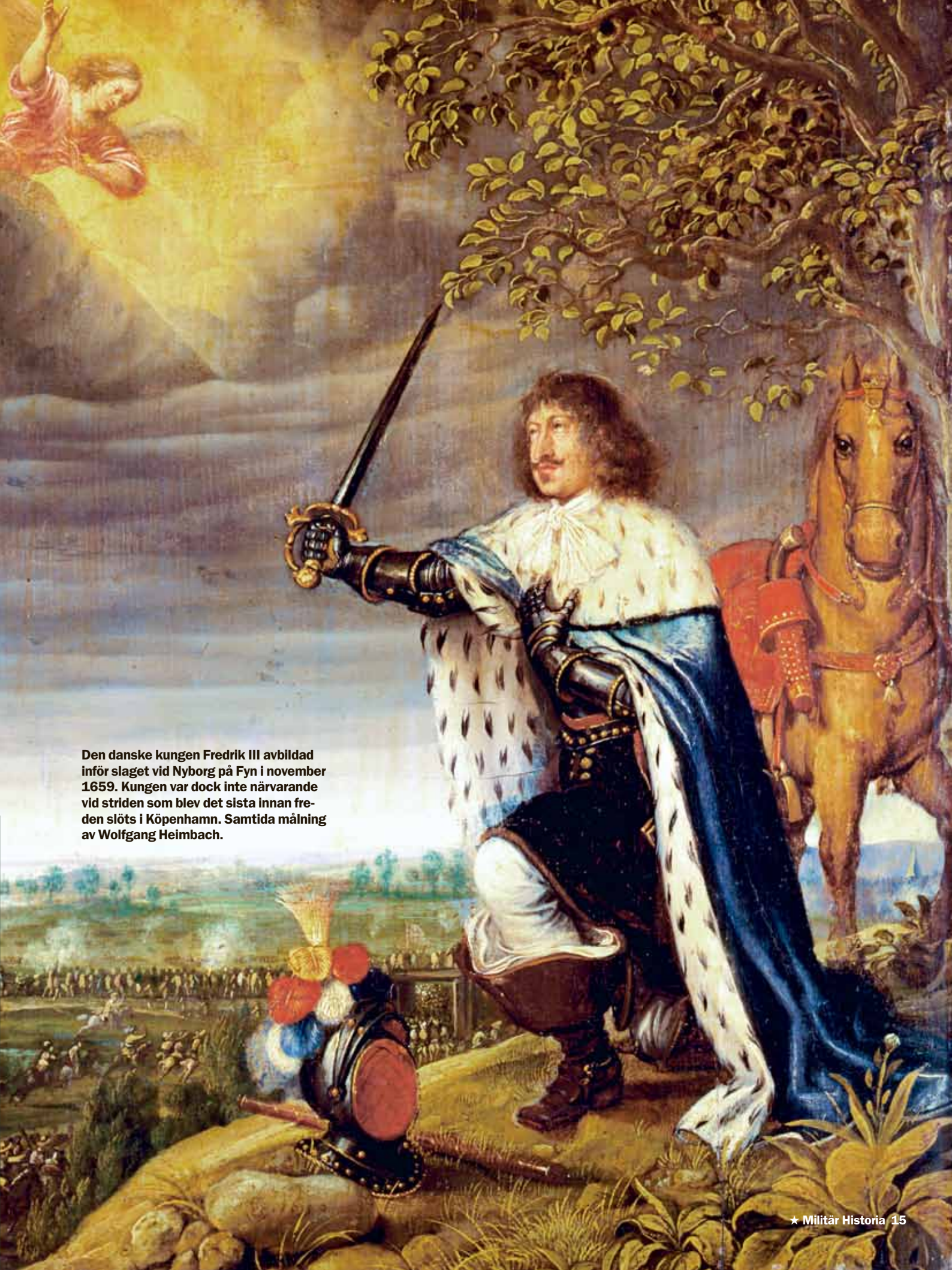
Den danske kungen Fredrik III avbildad inför slaget vid Nyborg på Fyn i november 1659. Kungen var dock inte närvarande vid striden som blev det sista innan freden slöts i Köpenhamn. Samtida målning av Wolfgang Heimbach.