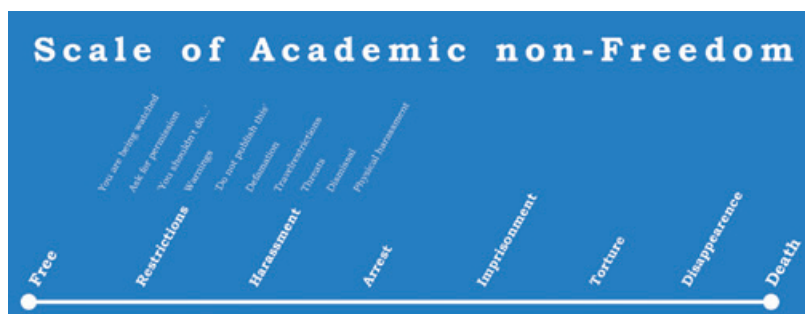
Figur 1. Begrebet "akademisk frihed" er et nøglebegreb for arbejdet i Scholars at Risk Network.

Når man så kigger på, hvilke discipliner der er i farezonen med hensyn til restriktioner-chikane-trusler-vold-fængsling-forsvinden-drab, tegner der sig et billede som i figur 3, hvor jura, politisk videnskab og ingeniørvidenskaber topper listen over risikable discipliner skarpt fulgt af medicin, sprogvidenskab og journalistik.