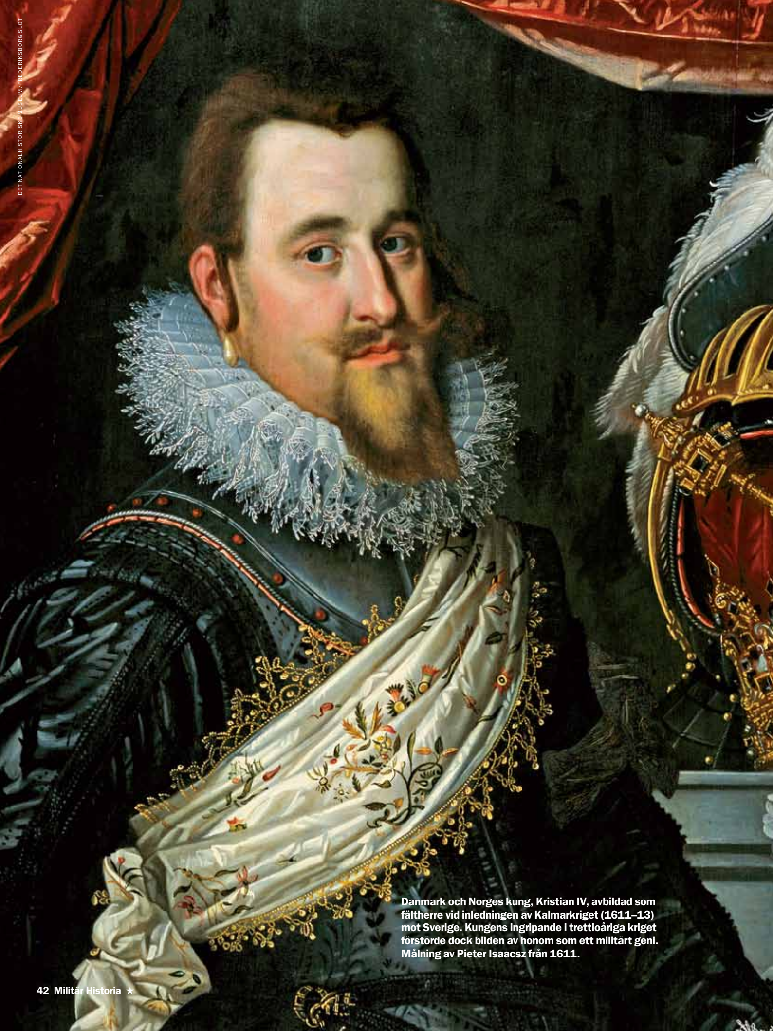
Danmark och Norges kung, Kristian IV, avbildad som fältherre vid inledningen av Kalmарkriget (1611–13) mot Sverige. Kungens ingripande i trettioåriga kriget förstörde dock bilden av honom som ett militärt geni. Målning av Pieter Isaacsz från 1611.