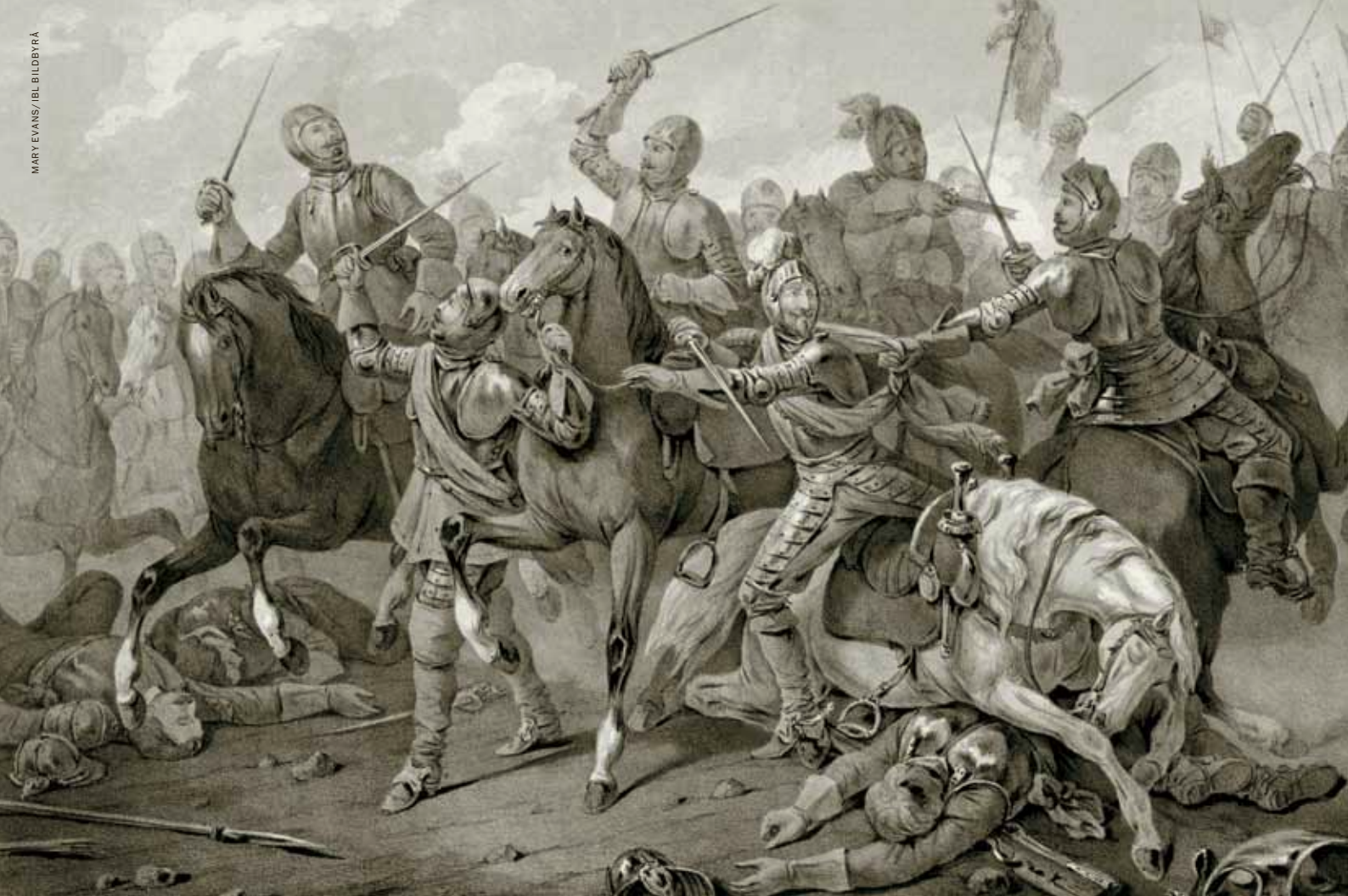
Två gånger föll Kristian IV:s häst omkull under flykten, men till slut kunde kungen fly från slagfältet med delar av sitt kavalleri.

och terroriserade befolkningen. Än så länge kunde den danska flottan visserligen hålla Wallensteins trupper borta från Fyn och Själland, men man var rädd att vintrarna skulle bli så hårda att fienden kunde gå över isen (som svenskarna senare gjorde vintern 1658).