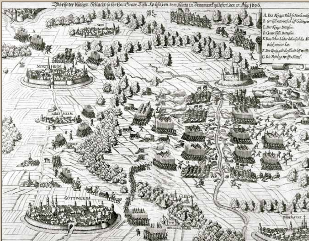
Detta samtida kopparstick visar i reportageform de viktigaste striderna mellan Tilly och Kristian IV sommaren 1626. Till vänster syns arméns förflyttningar före det avgörande slaget och i mitten själva slagfältet vid Lutter am Barenberge. Tillys motattack över bäcken är i full gång och Kristian IV:s trupper har tagit till flykten. I det övre högra hörnet skildras kungens ritt mot Wolfenbüttel.