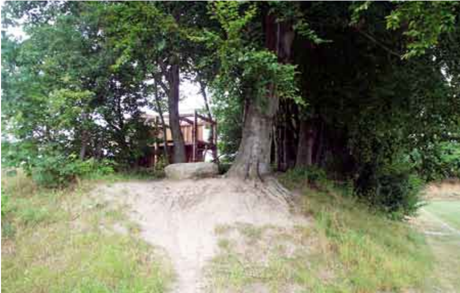
◀ Slidet viser, at skråningen udnyttes aktivt af børnene. Bjedstrup Skole ved Skanderborg.

skabt rum, der gør asfalkolegården brugbar for forskellige grupper børn. Samtidig betyder overdækningen, at der er mulighed for at opholde sig udenfor i frisk luft i frikvartererne og f.eks. spille bordtennis, selvom det er regnvejr.