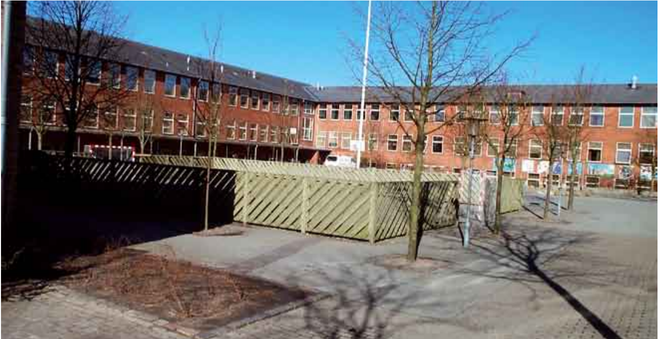
▲ En enkel og fin bandebane giver asfalt-skolegården nye muligheder. Gl. Lindholm Skole i Nr. Sundby.