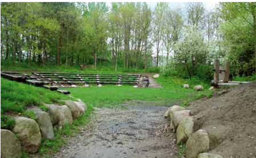
◀ Amfiteatret på Stavns Holt skolen i Farum udnytter fint det eksisterende terræn. Amfiteatret bruges i undervisningssammenhæng til bl.a. dramaopførelser.

Der findes mange nyere skoler med bygningsdefinerede uderum, fra atriumgårde til L- og U-afgrænsede rum op mod facaderne, ofte med direkte udgang fra klasselokaler. På nogle skoler, f.eks. Uglegårdsskolen (s. 56) og Stenvadsskolen i Farum Kommune, er det set, hvordan sådanne uderum anvendes optimalt i sammenhæng med lokalerne indenfor. Andre steder vokser der imidlertid så meget ukrudt el-