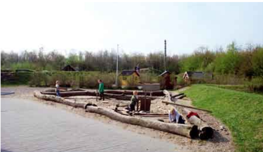
◀ Hvis skolen ligger i et fladt område, er kunstige legebakker og terrænformer en oplagt mulighed. Fladhøjskolen i Rødekrø.

Der er andre steder set amfiteatre, rutsjebaner, svævebaner osv., der udnytter terrænforskelle på skolegrunden på en optimal måde, men eksemplerne er forbausende få i forhold til de mange skoler, som har terrænforskelle. Her ligger en oplagt udviklingsmulighed.