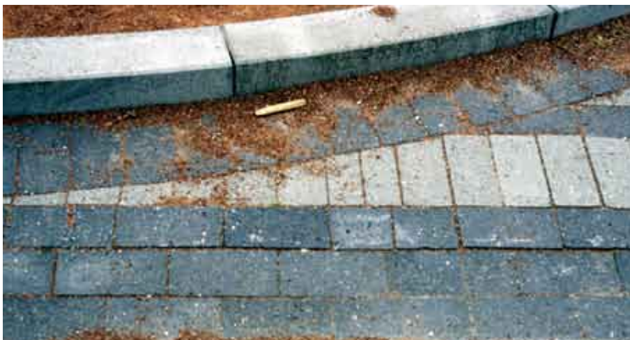
◀ På Asgård Skole i Køge er anlægskvaliteten i orden helt ned i mindste detalje.

Med de næsten 300 besøgte skoler som udgangspunkt tegner der sig et klart billede af, at det ikke er materialevalget, der afgør, om udemiljøet fungerer i det daglige. Modsat er det lige så klart, at materialevalget skaber forskellige æstetiske indtryk, som kan præge det enkelte anlæg væsentligt.