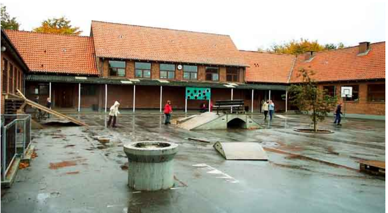
▼ Man kan få meget ud af et engageret gør-det-selv arbejde, når der er brug for at udnytte skolegården til aktiviteter for lokalområdets børn. Bregninge-Bjergsted Skole ved Kalundborg.

Skolen ved Bülowsvej (s. 50) vurderes som et næsten optimalt nærmiljøanlæg – næsten, fordi der ikke er overdækkede opholdsmuligheder. Skolen har eksempelvis værdi for andre skoler i tætte byområder, hvor mødestederne for de unge er få og mulighederne for udeaktiviteter begrænsede.