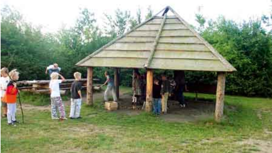
◀ Bålhuse er populære udendørs undervisningsrum, men er lige så anvendelige til leg i fritiden. Sønderisskolen i Esbjerg.

tematik, fysik og kemi. Set ud fra de næsten 300 skoler, denne eksempelsamling bygger på, er det dog et meget begrænset antal, hvor der virkelig er satset på at udnytte det givne potentiale.