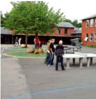
▲ Når der plantes træer i skolegården skal man vide, at trækronen ikke bliver meget større end plantebedets udbredelse. Her er det store, cirkulære muldareal i asfalt-skolegården beskyttet med græsarmering og træet med store sten, så sliddet kan tåles. Skægkjærskolen i Silkeborg.