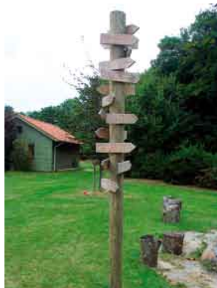
▲ Skiltet med destinationer til den store verden blev udført som et skoleprojekt.

Skolen blev opført i 1949 og er løbende blevet renoveret. Den sidste større renovering og et nybyggeri blev afsluttet i 2000, og skolen fremtræder nu som et vellykket u-formet konglomerat af rødstens- og træbygninger. Blandt tilføjelserne er en stor idrætspavillon di-