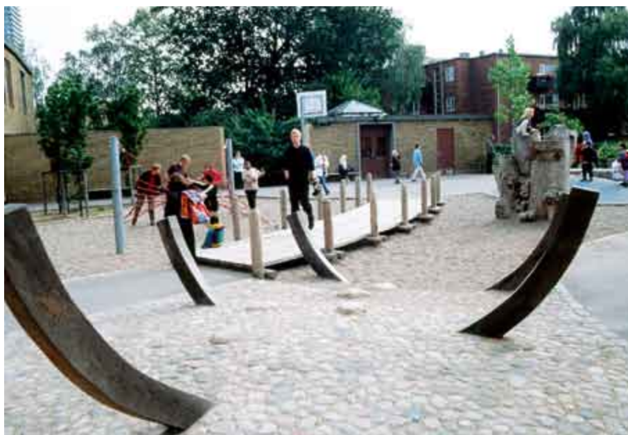
◀ Der er kommet fine anlæg ud af den ekstra økonomiske støtte til Københavns skoler, som kommunen har ydet. Ålholm Skole i København.

Der er ingen tvivl om, at der er brug for økonomisk støtte til istandsættelse og udvikling, hvis udearealerne skal fungere som et godt alternativ til indeundervisning og