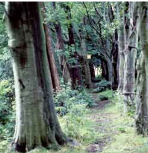
▲ På Bjedstrup Skole ved Skanderborg er randplantningen blevet et robust skovmiljø, der er populært i både undervisnings- og legetiden.