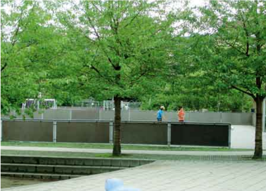
◀ Anlægget på Skolen ved Bülowsvej på Frederiksberg er åbent efter skoletid som nærmiljøanlæg.

Der har ikke i Danmark været gjort lignende storstilede forsøg på at udnytte skolens udearealer til nærmiljøanlæg. Der var en mulighed for at åbne byskolernes udearealer via de såkaldte 'kvarterløft', der er statsstøttede byfornyelsesindsatser med udgangspunkt i beboernes ønsker, men muligheden blev mærkeligt nok ikke udnyttet (Attwell & Sonne Olesen, 2005). Til gengæld har bl.a. Lokale- og Anlægsfonden i en årrække ydet økonomisk støtte til en del skoler, der har ønsket at etablere faciliteter til idrætsleg til brug for for både skolen og lokalsamfundet. Det har betydet, at der er kommet lidt større opmærksomhed omkring den flersidige brug af skoleanlægget.