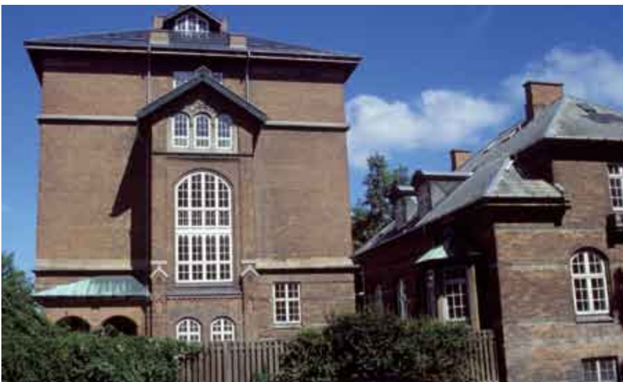
◀ De gamle byskoler er typisk store, tunge bygninger, der vidner om skolens daværende betydning i samfundet.

Generelt kan man sige, at efter mange års manglende fokus på skolens fysiske rammer og en generelt manglende økonomisk prioritering af området er situationen tilsyneladende vendt. Mange kommuner har planer om eller er i gang med at forbedre deres skoler, og skolerne viser stor interesse. Med de modsvarende statslige initiativer på både den idémæssige og økonomiske front er der skabt grundlag for, at skolens fysiske rammer kan blive opdateret. Det giver mulighed for, at skolerne efterhånden kan leve op til folkeskoleloven fra 1993, hvoraf det fremgår, at " folkeskolen må søge at skabe sådanne rammer for oplevelse, virkelyst og fordybelse, at eleverne udvikler erkendelse, fantasi og lyst til at lære, således at de opnår tillid til egne muligheder og baggrund for at tage stilling og handle. " (§ 1, stk.2).