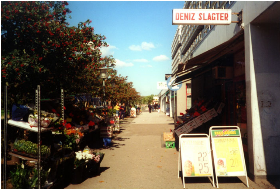
“Forretningsstrøget” i Avedøre Stationsby.

Helt som planlagt blev Avedøre Stationsby altså ikke, men byen holdt sig alligevel i store træk til de overordnede planer, som de dels blev udarbejdet af Køge Bugt-sekretariatet, dels af arkitektfirmaet Skaarup og Jespersen. Avedøre Stationsby blev en afgrænset bebyggelse, bygget og planlagt ud fra de kollektivistiske principper med sammenhæng, nærhed og fælles anlæg. Desuden strakte opførelsen sig over en periode på 12 år, hvilket arkitekterne håbede kunne være medvirkende til, at skabe en aldersmæssig afbalanceret beboersammensætning.