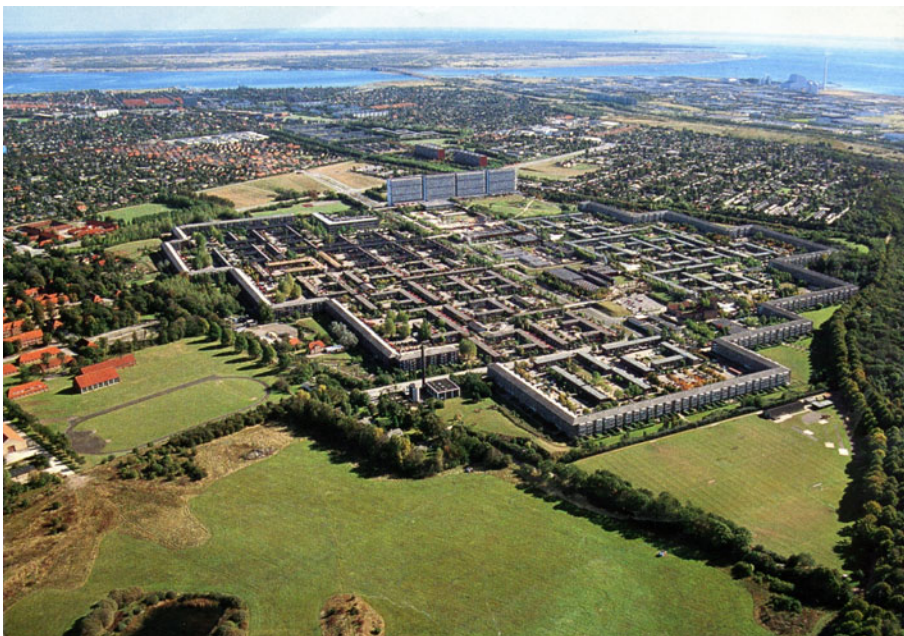
Luffoto af Avedøre Stationsby. efteråret 1997.

Avedøre Stationsby blev således opført som et fysisk afgrænset boligområde fra resten af Hvidovre Kommune. Den fysiske afgrænsning er sket ved at udforme byen med inspiration fra middelalderbyen. Således består byens tre sider af sammenhængende etageblokke med fire etager. Den fjerde side af byen består af et tieters højhus Store hus. I midten er der opført rækkehuse med tilhørende private gårdhaver.