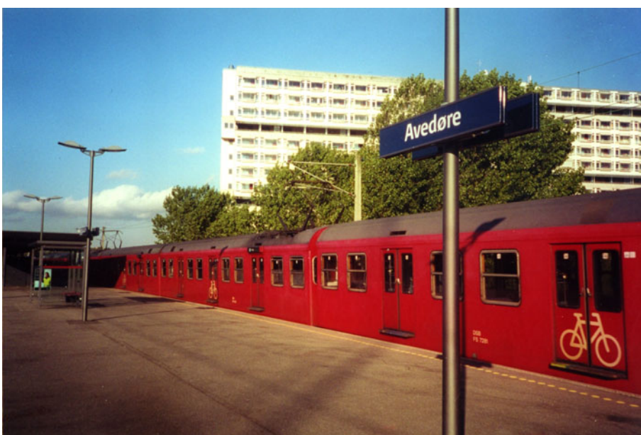
Avedøre Station. I baggrunden af billedet ses bagfacaden af Store hus.

Sammenhængen mellem boligområdet og de forskellige byfunktioner er etableret med et fælles stort institutionsbånd, der via byens hovedsti løber på tværs gennem boligområdet. Sammenhængen mellem boligområdet og offentlig transport blev etableret i form af en S-togslinie fra Købehavn, og med tværgående buslinier fra Avedøre Station til Brøndby og Glostrup. Den indre trafikplanlægning blev udformet med en klar adskillelse af gående og kørende trafik. Sammenhængen mellem boligområde og den private service blev sikret med planer om etablering af et større butikcenter i en park - Byparken - op mod Store hus og S-togsstationen, der med en overdækket butiksgade skulle forbinde bebyggelsen nord og syd for banen. Sammenhængen mellem boligområde og arbejdspladser blev etableret med inddæmning og udbygning af Avedøre Holme knap tre kilometer fra Avedøre Stationsby.