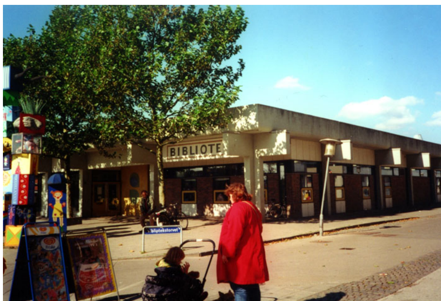
Biblioteket i Avedøre Stationsby. Foto: Kristina Skovdal, 2001.

Da Avedøre Stationsby omsider stod færdigbygget i 1983 levede byen ikke helt op til de oprindelige planer. Blandt andet blev der bygget et mindre antal offentlig institutioner, og det planlagte forretningscenter i Byparken blev droppet. I stedet blev der gjort plads til forretninger i den nederste etage af Store hus 50 .