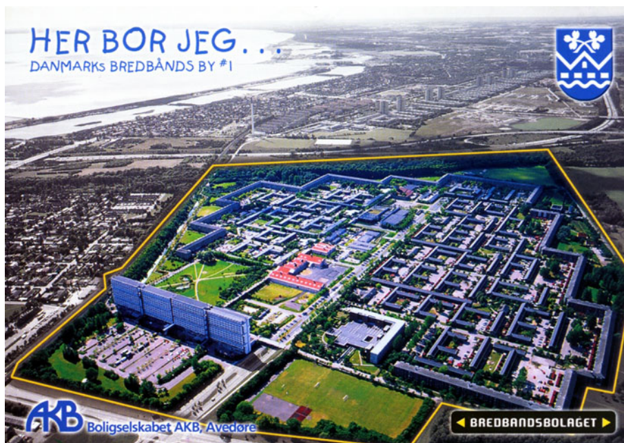
Luftfoto af Avedøre Stationsby.

altså være afhængig af hvem det er, som repræsenterer stedets betydning og mening 78 .