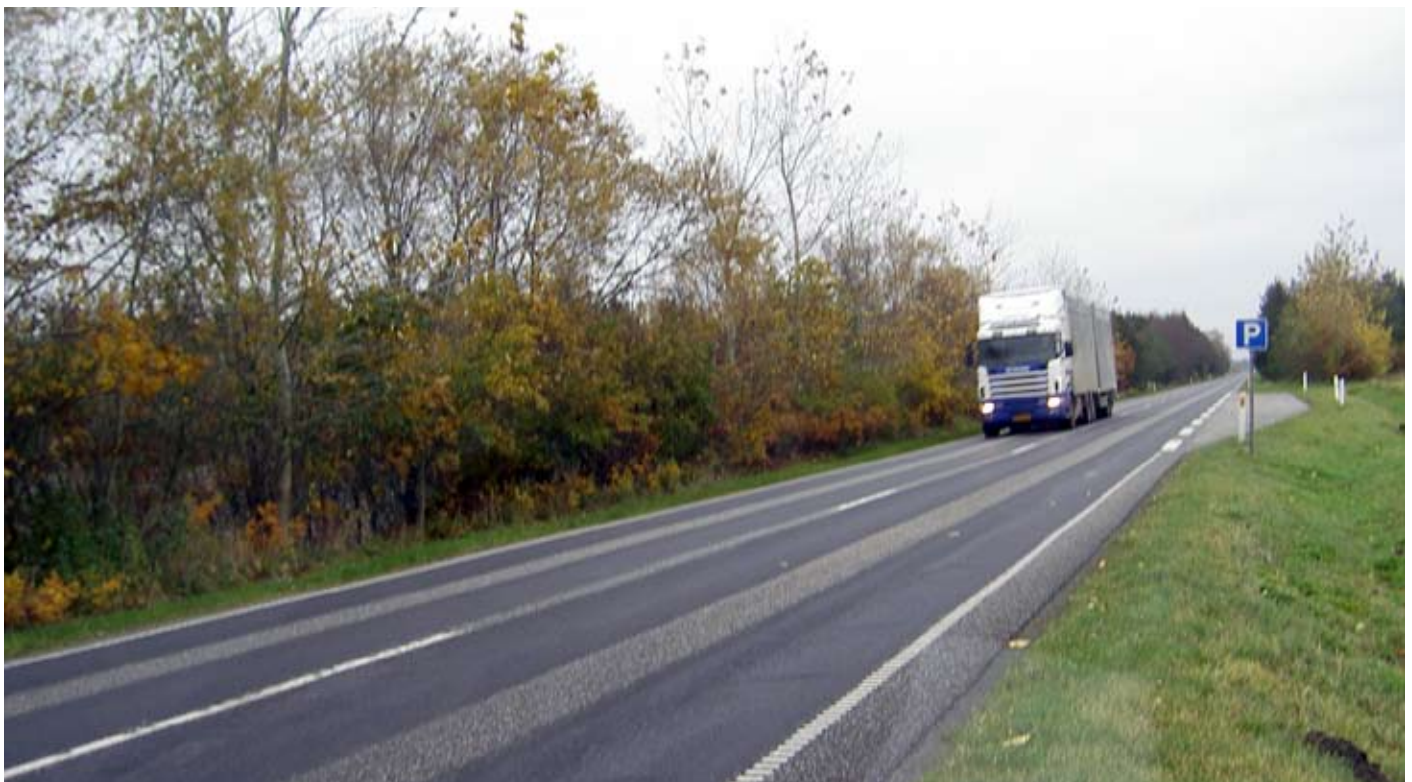
Udpeget trafikfarlig skolevej i Herning Kommune. Vejen fungerer som skolevej for 5-10 elever.