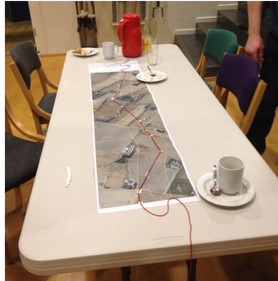
Et eksempel på resultatet af dialogen – en gruppes forslag til kabeltrace