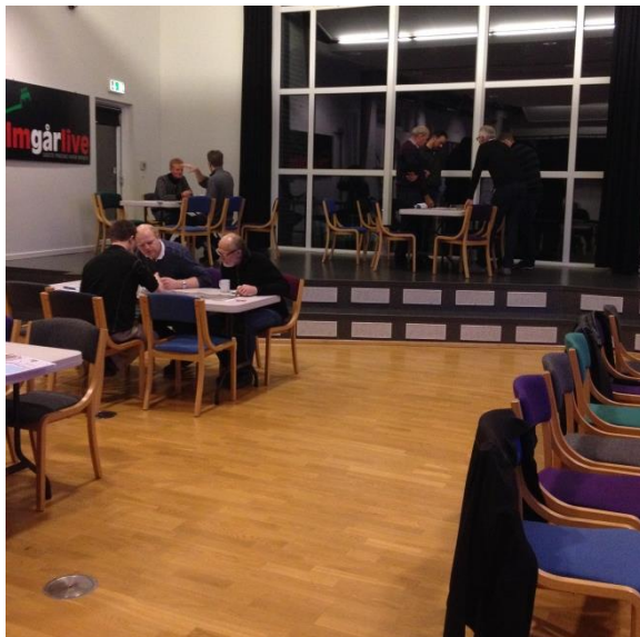
Dialog i nabogrupperne

En forsker fra forskningsgruppen deltog i planlægning og afholdelse af initiativet. Der var således mulighed for at evaluere på forsøget ved at foretage observation under arrangementet samt foretage interview med deltagere og planlæggere både før og efter. Desuden blev lodsejersamtalerne optaget.