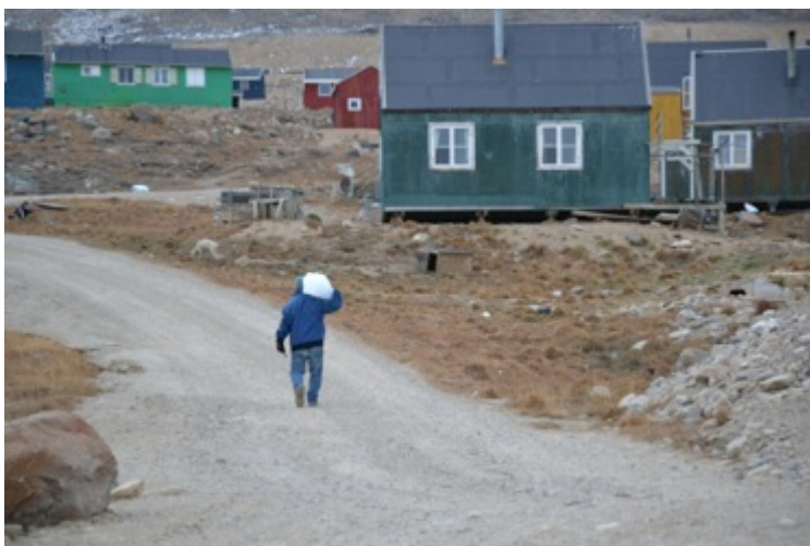
Qaanaaq september 2014

Projektets mål er at analysere omfanget af sektoriseringens konsekvenser og initiere en dialogproces mellem de helt eller delvist selvstyrejede virksomheder, kommunerne og selvstyret.