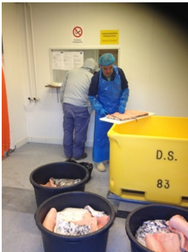
Indhandling af mattak i Qaanaaq september 2014

Der har været et mindre fiskeri efter hellefisk i flere perioder bl.a. omkring 1970 og 2005 og i de seneste år, hvor fiskeriet er steget og flere fangere nu arbejder systematisk med fiskeriet.