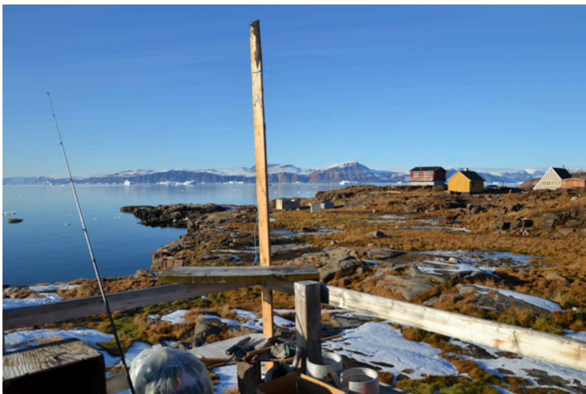
Qeqertat september 2014

Det bør endvidere undersøges, om der relativt let kan etableres en atlantkaj i Qeqertat. Umiddelbart vurderet er der relativ stor dybgang helt ind til bygden, men der savnes søopmålinger for at kunne afklare dette. Hvis det er muligt direkte at besejle Qeqertat, vil det kunne reducere RAL's omkostninger ved eksport af hellefisk, sammenlignet med i Qaanaaq, hvor fisken i øjeblikket skal prammes ud. Hvis der er mulighed for både atlantkaj og tilstrækkeligt ferskvand til fiskeforarbejdning, kan det overvejes at flytte distriktets primære fiskeproduktion til Qeqertat.