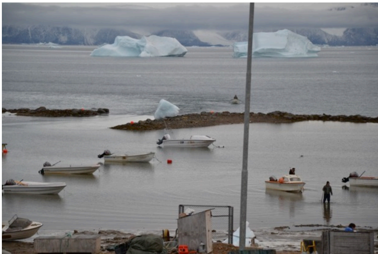
Joller for sveg indenfor revet i Qaanaaq