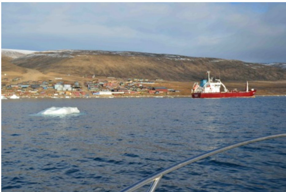
Årets tankskib for sveg ud for Qaanaaq

To forsyningskibe fra Royal Arctic Lines (RAL) anløber i henholdsvis slutningen af juli og i september, og dertil kommer et årligt anløb af en olietanker. Forsynings- og tankskibene anløber i samme forbindelse Siorapaluk, Qeqertat og Savissivik.