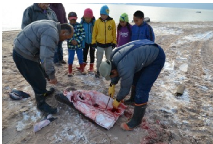
Grønlandshaj parteres på stranden september 2014

Der kan muligvis stilles spørgsmålstegn ved reguleringsgrundlaget, i det omfang den er baseret på fangernes indrapporteringer. Flere fangere fortæller, at deres og bygdens indrapporteringer er mindre - omkring det halve - af den egentlige fangst. Hvis det er korrekt, betyder det, at kvoterne er fastsat ud fra et estimat over bestanden, der er betydeligt under det reelle niveau. Vi har ikke grundlag for at vurdere dette udsagn, men peger på, at det er en klassisk problemstilling i fangerdistrikterne.