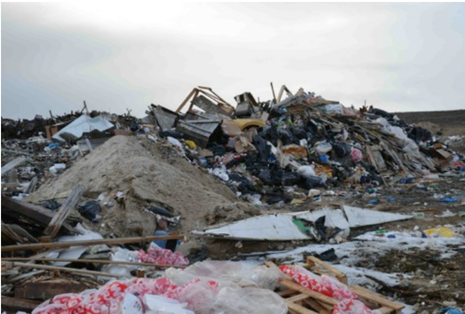
Dumpen i Qaanaaq

Der er store udfordringer med den samlede affaldshåndtering i Qaanaaq og bygderne, og løsninger vil have relevans for en lang række andre bosteder i Arktisk.