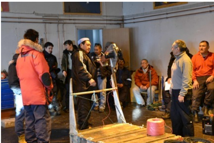
Ophaleren præsenteres ved møde i Qaanaaq april 2015

En benzindreven ophaler blev søgt lanceret i maj 2015 i samarbejde mellem Royal Greenland og lokalafdelingen af KNAPK. Denne bruges i udstrakt grad omkring Illulisat og blev lanceret som en mulighed for at effektivisere fiskeriet gennem montering på slæde. Fiskerikonsulenten fra Royal Greenland blev sendt til Qaanaaq med to indhalere. I den uge, hvor konsulenten var i Qaanaaq, blev ophalerne præsenteret på et møde, hvor omkring 30 fangere deltog, og testet i praksis på isen i dagene efter. Deres funktion løb ind i en del udfordringer, og blev ikke umiddelbart afklaret. Der var bl.a. problemer med at starte motoren og genstarte efter pause, og både montering og de meget lave temperaturer synes at være udfordringer, der skal følges op på. Flere fangere udtrykte skepsis, mens andre var interesserede og enkelte overvejede at investere i en af de to ophalere, der blev solgt på tilbud. Flere gav udtryk for, at selv med denne pris ville det være en meget stor investering for dem.