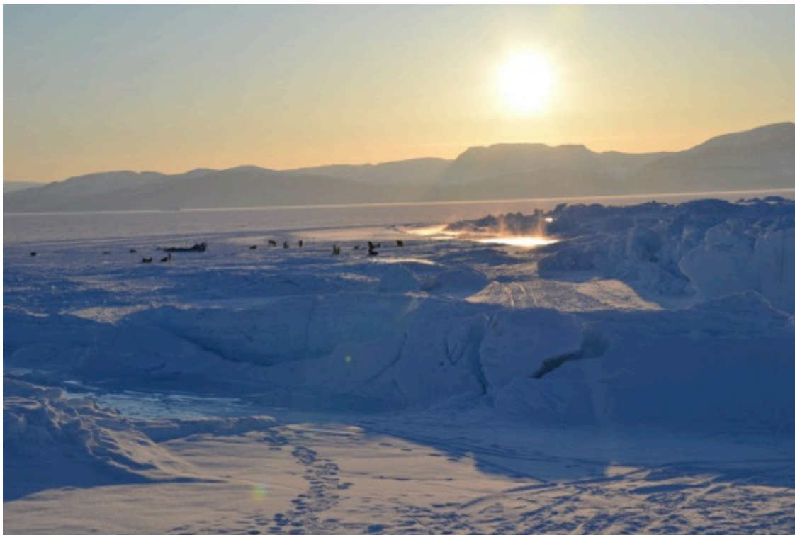
Isskruninger ved revet ud for Qaanaaq

Der er ingen egentlig naturlig havn. Et rev giver en vis læ for joller og mindre både, mens adgang til og fra joller og både er besværlig og foregår direkte via stranden, så selv den mindste vind giver vanskelig forhold. Gods fra atlantskibet skal prammes ind, ligesom eksport af f.eks. hellefisk og affaldsfraktioner skal prammes ud. Om vinteren opstår der indenfor revet tidevandsbaserede isskruninger, der besværliggør transport af hellefisk, og i tøbrudsperioden må de lastede slæder 'sejles' ind på isflager.