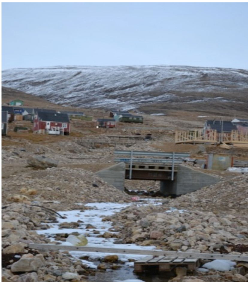
Når frosten sætter ind, forsvinder vandet i elven, men med tøbruddet kommer der store mængder vand, der flytter rundt på store sten