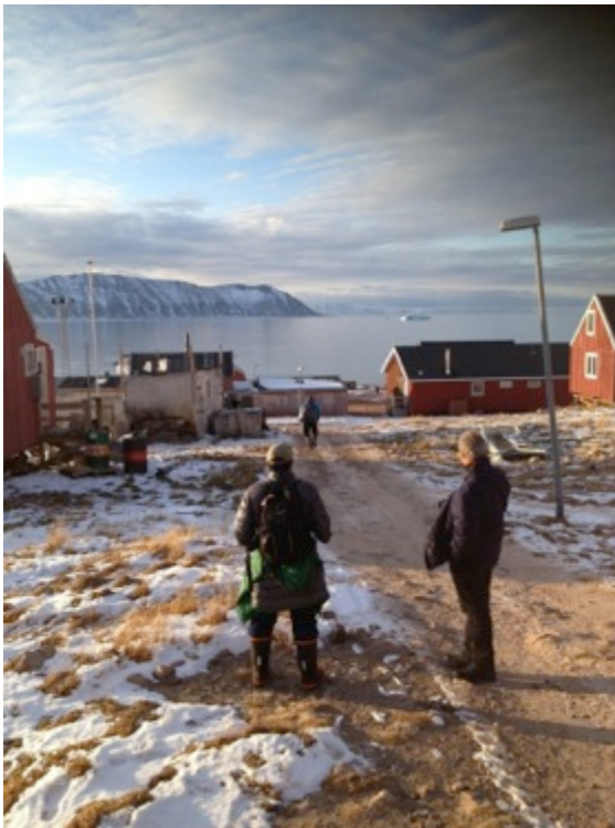
Samtale med en fanger, Siorapaluk, september 2014.

Følgende tre områder, der kobler distriktet med eksterne aktører og politikker, er særlig belyst i denne undersøgelse: