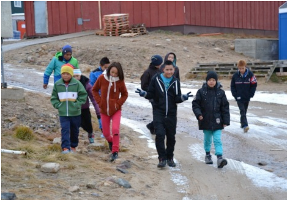
Ung i Qaanaaq

Der er stadig en praksis i distriktet, hvor familier flytter midlertidigt for at fange eller fiske og besøge familie. Mobilitet kan være en styrke i distriktet, men er samtidig en udfordring for børns skolegang. Denne udfordring er man opmærksom på i skolen og søger at håndtere bl.a. ved at koordinere pensum på tværs af de enkelte skoler.