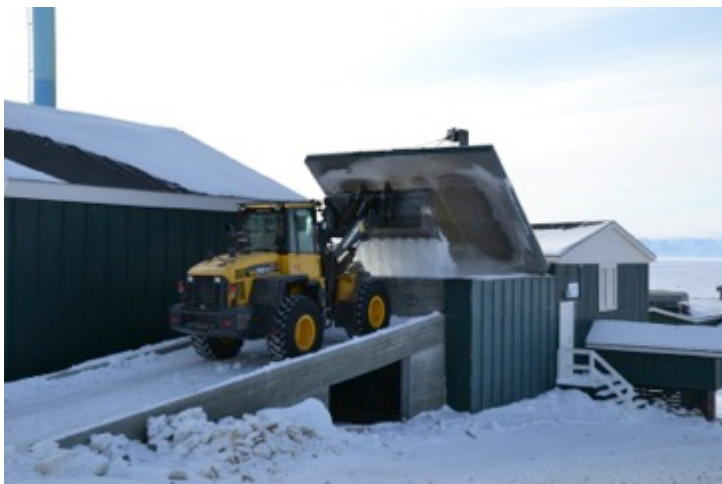
Anlæg til smeltning af is

Qaanaaq by med omkring 640 indbyggere ligger på en moræneskråning på permafrost, og byen er endvidere placeret i et diffust elvdelta, hvor elven i den korte sommer afvander den lokale bræ, der ligger ovenfor byen. I de fire sommer måneder anvendes vand fra elven til drikkevandsforsyningen og samtidig fyldes to store vandtanke, der sikrer vandforsyningen i yderligere fire måneder. De resterende fire måneder hentes isfjelde med en gummiged (entreprenørmaskine) på havisen, hvorefter iskosserne smeltes i et særligt anlæg koblet på distributionsnettet.