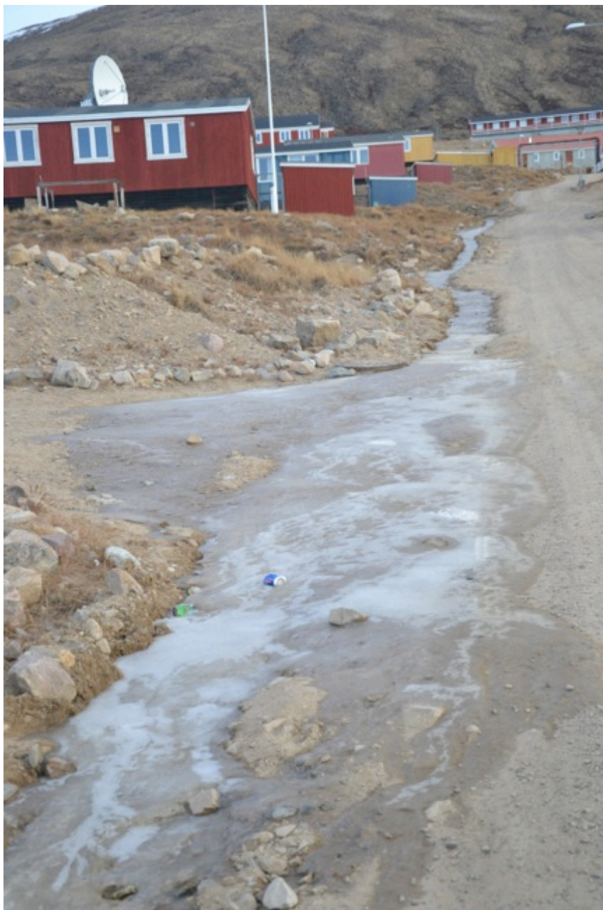
Vand, der løber ovenpå permafrostlaget, siver op forskellige steder og skaber isdannelser