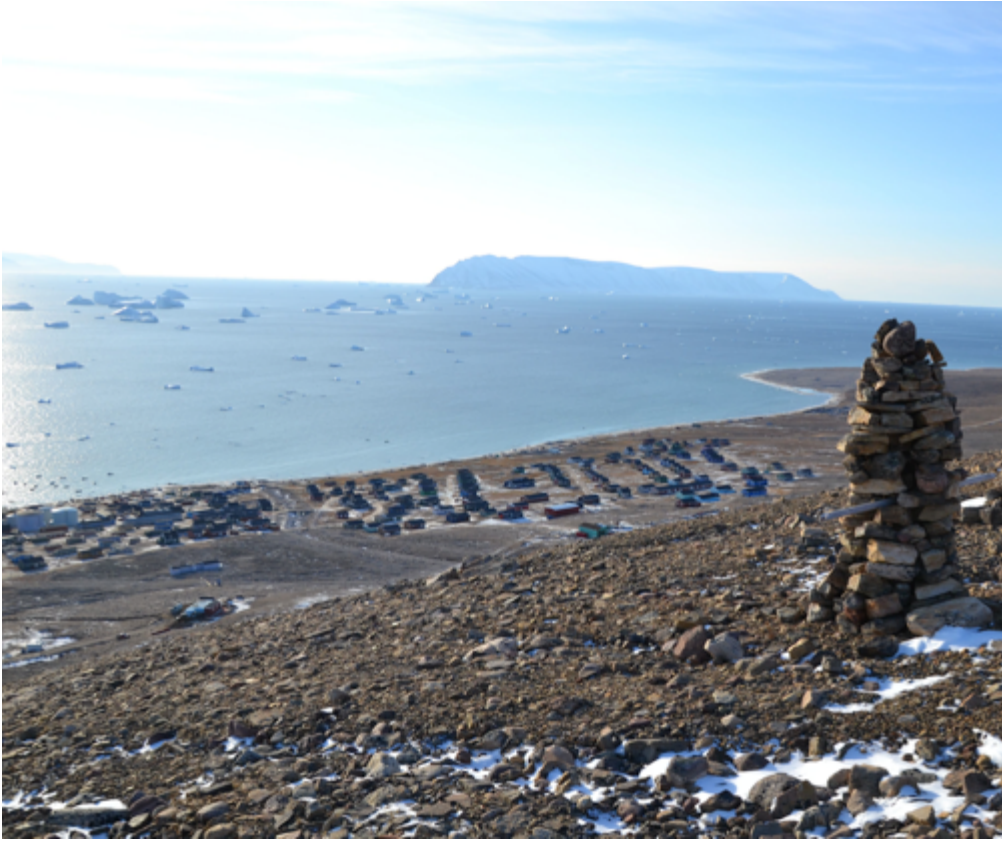
Qaanaaq september 2014