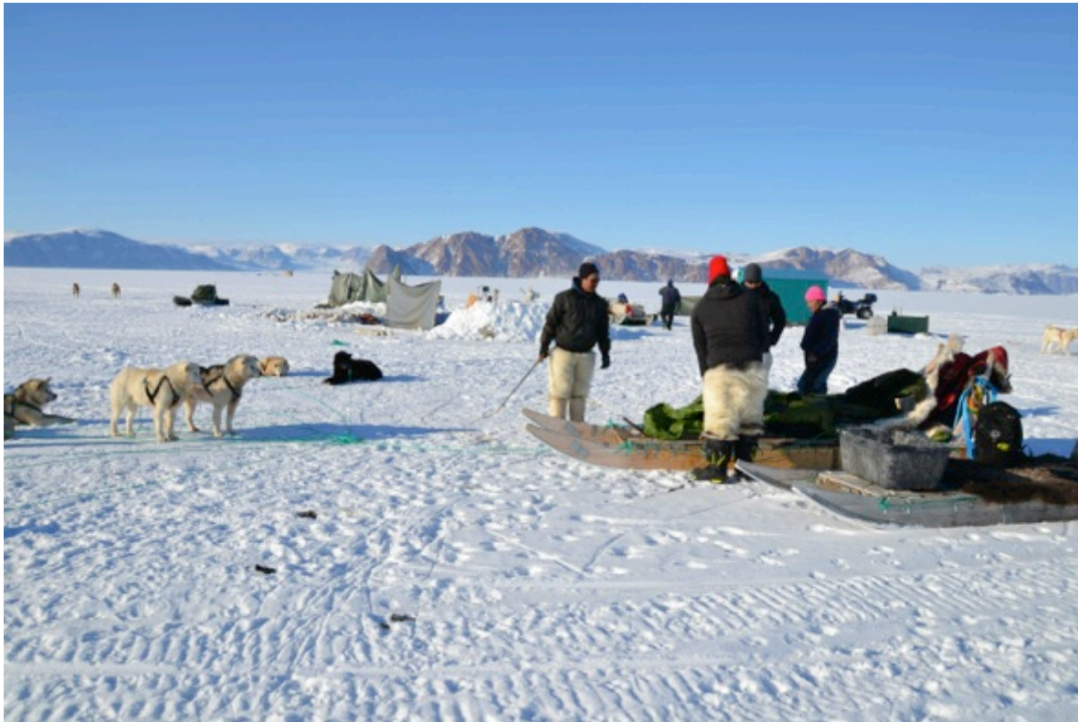
Isfiskeri ved Qeqertat

Begge er erfarne formidlere og facilitatorer af forandrings- og læreprocesser.