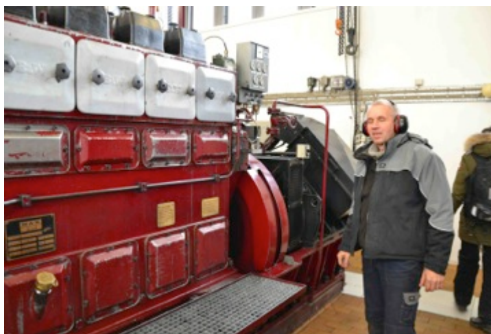
Elværket i Qaanaaq

Det er som nævnt svært at opbygge og vedligeholde faglige kompetencer i små og spredte ø-driftssamfund som der er mange af i Qaasuitsup Kommune og ikke kun i Qaanaaq distrikt. Små samfund er meget afhængige af enkelt personers ressourcer og tilsvarende sårbare overfor disse personers fraflytning. Det er desuden afgørende, at Qaanaaq distrikt som det øvrige Grønland i er en moderniseringsproces, hvor traditionelle former for viden bliver mindre vigtige end nye typer viden og værdi-