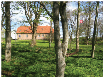
Haven ved Præstegården er altid et besøg værd, uafhængigt af årstiderne. Nu endnu mere med de i artiklen beskrevne nye tiltag. Her i foråret med dejligt solskin og flaget højest, 5. maj 2017.

pjecen i hånden bliver man klog på, hvad der møder én i haven – kanalen, særlige træer og buske, den blå anemone osv. I godt vejr oplagt at tage i brug, hvis der er tid og kræfter til en lille tur rundt i haven. Det er forventningen, at ikke mindst mange 60+ vil sætte pris på pjecen – og turen i haven.