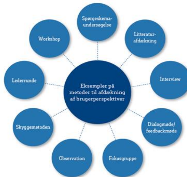
Figur 2: Eksempler på metoder til afdækning af brugerperspektiver (ViBIS 2017:14)

giver et billede af, at brugere kan inddrages ved brug af mange forskellige metoder. Metoderne uddybes på www.patientinddragelsesguiden.dk med trin-for-trin guides og videoer.