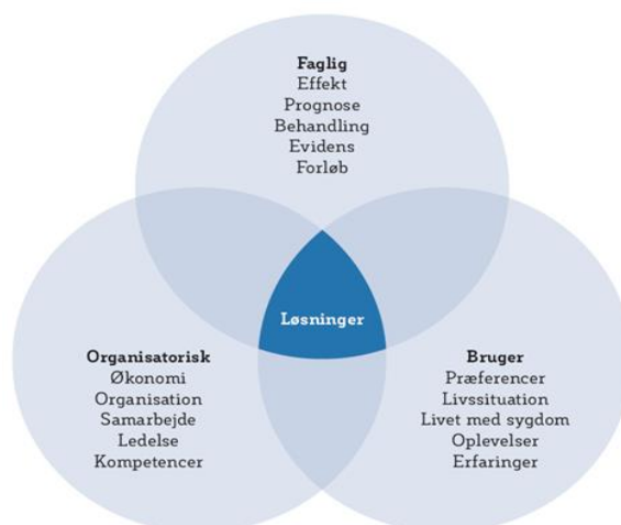
Figur 1: Kategorisering af perspektiver i sundhedsvæsenet (ViBIS 2017:8)

I udviklingen af sundhedsvæsenet er det ideelt at inddrage en række relevante perspektiver: organisatoriske, faglige og bruger-orienterede perspektiver. Figur 1 viser hovedindholdet i disse perspektiver ved hjælp af stikord.