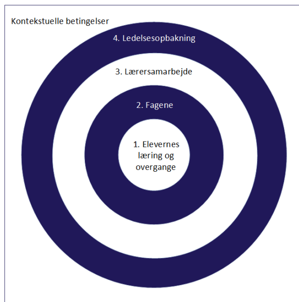
Figur 4: De koncentriske cirkler

Undervejs vil der, enten med skolens navn eller titlen på skolens udviklingsprojekt, blive refereret til og kort beskrevet forskellige konkrete skoleprojekter. Disse er nærmere beskrevet i kataloget: Faglige overgange – et inspirationskatalog , hvor man således kan læse mere omkring, hvad der er afprøvet, og hvordan deltagerne har vurderet de enkelte aktioner.