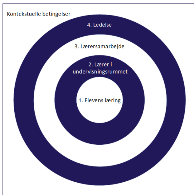
Figur 3: De koncentriske cirkler: Dynamikken omkring lærerens undervisning

De fire cirkler skal aflæses fra midten: