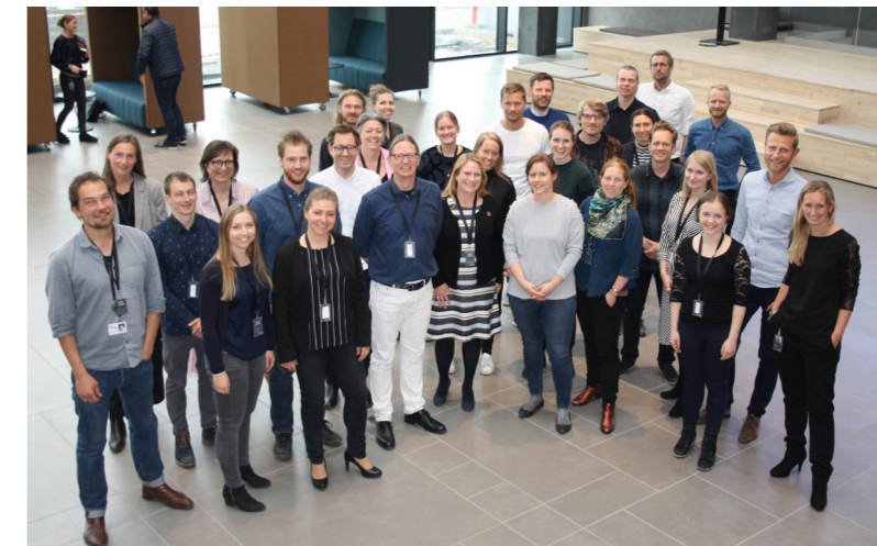
Deltagere på Level(s) test workshop 3 hos Årstiderne Arkitekter / Sweco Danmark.

Desuden stod det klart fra de afholdte workshops, at den udstrakte metodefrihed i Level(s) kan være både værdiskabende og en udfordring for interessenterne.