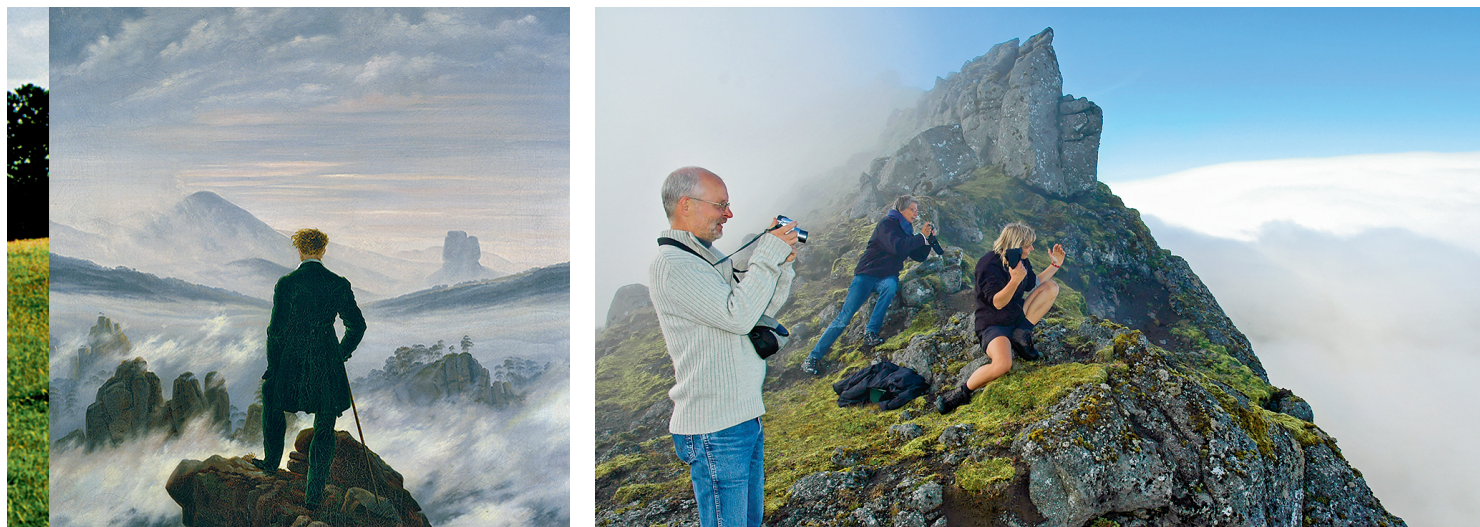
Figur 5.4. Bjergtoppen over det dramatisk-voldsomme landskab har langt fra mistet sin tiltrækning. Til venstre Caspar David Friedrichs 'Der Wanderer über dem Nebelmeer' fra 1818 (Hamburger Kunsthalle). Til højre er vandrere 200 år senere lige så fængede af bjergtoppen og udblikket over et lavere liggende (i dette tilfælde færøsk) tågehav.