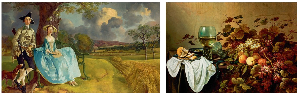
Figur 5.2. Nytte og skønhed forenet. Til venstre Thomas Gainsboroughs 'Mr. and Mrs. Andrews' i det ideale landskab fra 1750 (National Gallery, London), til højre Pieter Claesz' appetitlige 'Stilleben med frugt og rømerglas' fra 1644 (Budapest Kunstmuseum).

bevare, og hvorfor. Hensigten med de følgende afsnit er da også at bidrage til denne præcisering ved at fremdrage bud på kvaliteter, der kunne være værd at bevare for eftertiden.