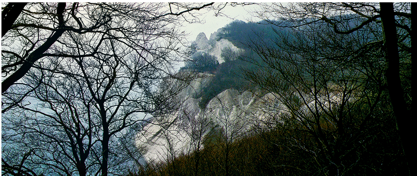
Figur 5.5. Markante og dramatiske geologiske landskabselementer som Møns Klint var blandt de tidligst udpegede bevaringsværdige “naturmonumenter.” Klinten blev dog først endeligt fredet i 1980-1984.