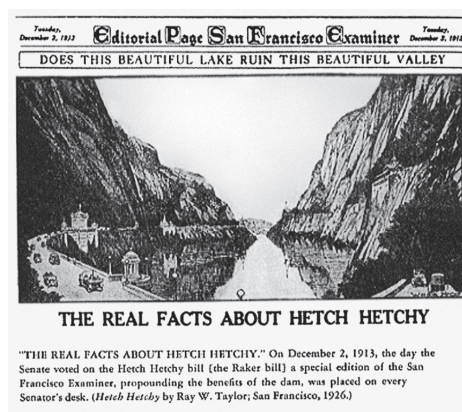
Figur 5.6. “De virkelige kendsgerninger om Hetch Hetchy” blev fremlagt i en særudgave af San Francisco Examiner den 2. december 1913 (til højre), samme dag som senatet skulle stemme om opdæmningen af den indtil da fredede dal (billedet til venstre).

For Muir var vildniset den autentiske, menneskefrie natur. Ikke blot et oplagt mål for videnskabelige ekspeditioner, men et helligt sted, hvor skaberens hensigter kunne aflæses i uforfalsket udgave. Han sammenlignede opdæmningen af Hetch Hetchy-dalen med oversvømmelse af templer og katedraler. Vildniset var samtidig det ægte hjemsted for diversiteten af biologiske organismer og ikke mindst et værdifuldt modbillede til det kunstigt-falske, styrede og planlagte liv i byerne. Et besøg i vildnisområder, hvor man genoprettede kontakten med “moder Jords rødder”, kunne derfor fungere som terapeutisk pleje for stressede bymennesker. Det primitive friluftsliv i ægte natur genoprustedes svækkede dyder. Nationalparkerne fremstod som koncentratrater af sublim storhed, pittoresk kompleksitet og naturmæssig ægthed – på én gang som afspejlinger af og forbilleder for nationen selv (bl.a. Muir 1901/1991).