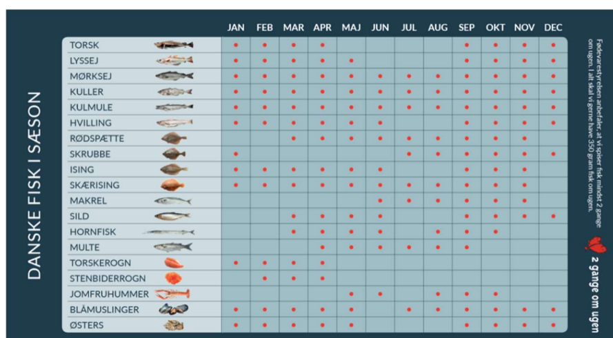
Figur 9: Danske fisk i sæson 51

Fiskebranchen har i en årrække kørt forbrugerkampagnen '2 x om ugen', der formidler information om netop de danske fiskesæsoner for en række af de mest væsentlige fiskearter fanget af danske fiskere samt opskrifter mm (Figur 9). 50