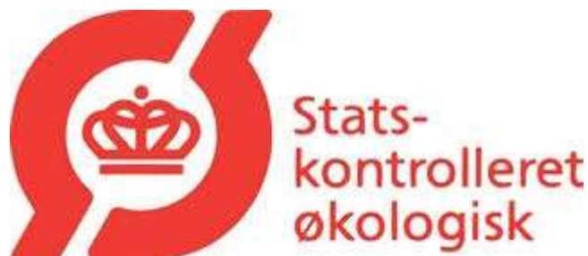
Figur 6: Det danske økologimærke

I Danmark finder man typisk et af to (eller begge på samme tid) økologimærker på et økologisk produkt: Ø-mærket (Figur 6), introduceret i 1989, og EU-bladet (Figur 7), EU's nye økologimærke, introduceret i 2010. Ø-mærket fortæller, at varen er økologisk, og at dette er kontrolleret af danske myndigheder. EU-bladet fortæller, at varen er økologisk produceret og kontrolleret efter EU's retningslinjer. Bag begge mærker står myndigheder som garant for, at kravene til økologisk produktion er opfyldt – også uden for de områder, hvor myndighederne opererer direkte (f.eks. ift. varer produceret uden for EU). 39 I modsætning til de tidligere beskrevne mærker, er økologimærkerne designet med henblik på fødevarer generelt (inkl. nogle få non-food produkter) og dermed ikke specifikt til fisk. For at et produkt skal kunne mærkes som økologisk, skal det produceres under kontrollerede forhold, og økologimærkerne, som de anvendes ift. fisk, er derfor beslægtet med ASC-ordningen for opdrættet fisk. Vildtfanget fisk kan ikke økologimærkes, og økologimærkerne er derfor kun i spil ift. opdrættet fisk.