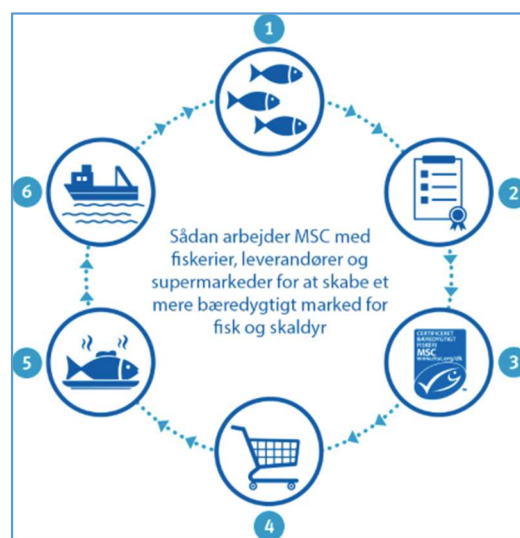
Figur 2: Marine Stewardship Councils 'theory of change' 8

Den generelle logik bag mærkningsordninger - ofte kaldet 'theory of change' (Figur 2) – er, at certificering og efterfølgende mærkning af bestemte produkter som f.eks. 'bæredygtige' (efter nøjere fastsatte kriterier) kan sætte 'forbrugermagten' i spil med det formål at motivere producenter (i kontekst af denne rapport fiskere eller akvakulturproducenter) til at ændre deres praksis for også at blive certificerede og dermed få adgang til det kundesegment, der efterspørger dette (Eden 2011).