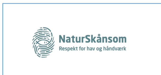
Figur 4: NaturSkånsoms mærke 22

Baseret på en forventning om, at der eksisterer eller kan udvikles et særligt marked for fisk af høj kvalitet, der hidrører fra et kystnært fiskeri med skånsomme redskaber, blev det i slutningen af 2016 - som del af en større pakke fiskeripolitiske tiltag målrettet blandt andet kystfiskeriet - besluttet at igangsætte udviklingen af et mærke for dette fiskeri. 19 Intentionerne er siden hen blevet til virkelighed, og mærket forventes på nuværende tidspunkt at blive introduceret tidligt i 2020. For nærværende er mærket ikke på markedet, men den relevante bekendtgørelse er i høring 20 , hvorfor vi ved besked om foreløbigt navn, logo (Figur 4) og mærkets grundlæggende principper. Det påtænkte navn, 'NaturSkånsom', beskriver godt intentionen og tankegangen bag mærket. Mærket er primært til anvendelse for danske fiskere og som udgangspunkt kun målrettet det danske marked; det vil dog være tilgængeligt for ikke-danske fiskere, der lever op til mærkets krav. 21 Det vil blive statsligt kontrolleret og gratis for fiskerne at anvende.