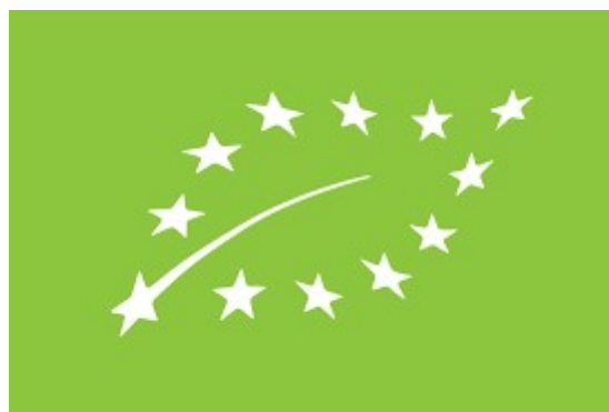
Figur 7: Den Europæiske Unions økologimærke