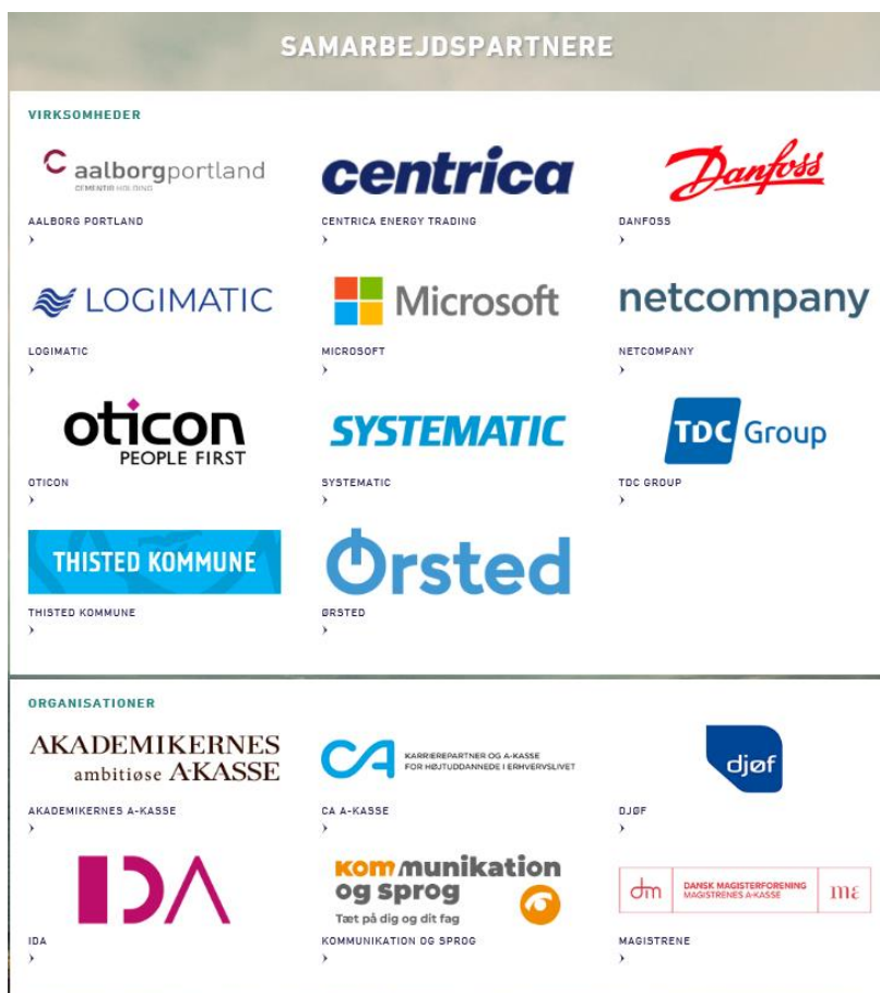
Figur 5 Et udvalg af universitetets samarbejdspartnere ( https://www.karriere.aau.dk/samarbejdspartnere/ ).

Kontrakten mellem virksomheden, universitetet og den studerende er juridisk bindende. Den indeholder bestemmelser om arbejdstid per uge, evt. transportgodtgørelse, en udtalelse fra virksomheden til den studerende ved praktikens slutning, at virksomheden/organisationen skal tildele den studerende en kontaktperson, som den studerende kan rådføre sig hos vedr. professionelle og praktiske spørgsmål, at den studerende skal overholde virksomhedens/organisationens regler for arbejdstider, arbejdsprocedurer og fortrolighed, og om de økonomiske vilkår generelt.