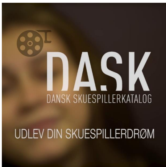
Figur 7 Kompetencer til ”hvordan man skærer en film til nye medier, og laver versioneringer og formater, så de passer ind i en digital strategi”, som direktøren for Mayday Film ønskede for Mediefags- og Kommunikationskandidater, demonstrerede de studerende, der deltog i projektet kort tid efter, ønsket blev fremsat. I faget Medieplatformsteknologier og nye medier producerede de en reklamefilm til DASK og versionerede den til Instagram og til YouTube.